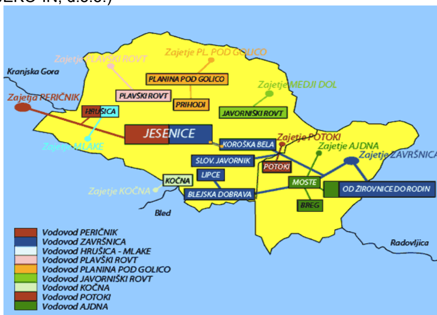
Slika 1: Shema cevovodov v občini Jesenice in občini Jesenice (Vir: JEKO-IN, d.o.o.)

Preglednica 1: Vodovodni sistemi z dolžinami cevovodov in količino distribuirane vode (Vir: JEKO-IN, d.o.o.)