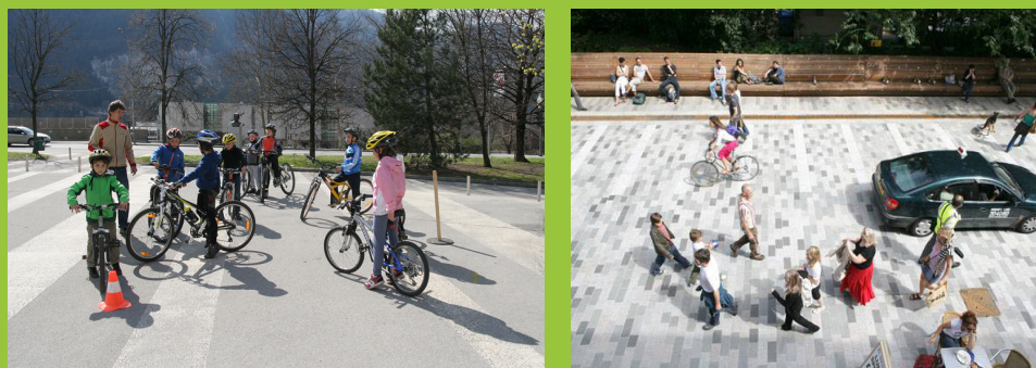
Jesenice, Čufarjev trg