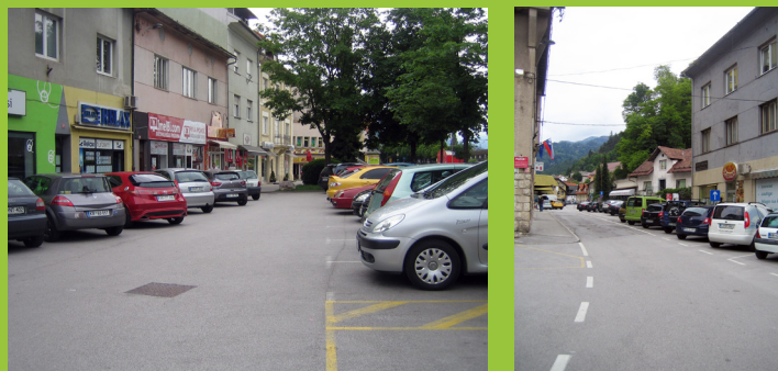
Jesenice - družabno življenje na ulici avtomobilov