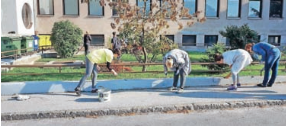
Zaposleni so med drugim prebarvali ograje ...

"Odločili smo se, da uredimo okolico šole, ki je klicala po večjem posegu. Uredili smo športno igrišče, atrij in vrt pred šolo: prepleskali smo oporne zidove, obnovili tekaško stezo, prebarvali otroška igrala, odstranili grmičevje in plevel, pregrabili zelenice, nasadili okrasno cvetje in grmičevje ter uredili okrasno potko na vrtu. Poleg tega smo prebarvali tudi ograje," je povedal Pekolj, ki je pred časom vodil tudi prostovoljno akcijo urejanja otroškega igrišča pri TVD Partizan na Koroški Beli.