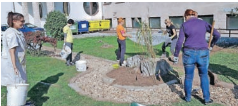
... ter zasadili okrasno cvetje in grmičevje.