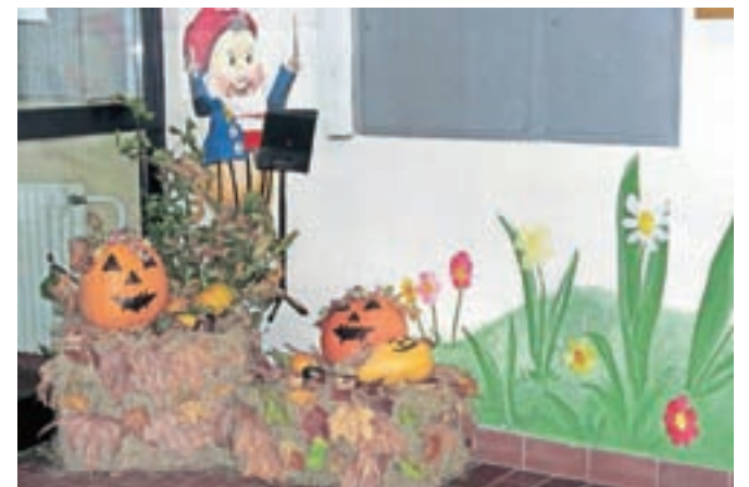
Vhod v stolpnico je polepšal aranžma na temo noči čarovnic.

Včasih tudi drobne pozornosti prispevajo k prijetnejšemu bivanju ljudi, to zlasti velja v večstanovanjskih objektih. V stolpnici na Titovi 41 na Jesenicah, ki je vas v malem, že več kot desetletje skupinica dobrovoljnih skrbi, da vsakdanji utrip ni čisto običajen. Ob različnih praznikih, na primer ob božiču, novem letu ..., in ob drugih priložnostih poskrbi za različne aranžmaje v notranjih prostorih. Prizadevajo si, da je sobivanje vseh prijetnejše na kakšnem skupnem družabnem dogodku. Sedaj jeseni spet zaslužijo pohvalo za lepo urejen vhod v stolpnico, in sicer ga tokrat krasi aranžma buč, ki sodi k noči čarovnic. Vse z namenom, da se nekaj dogaja, da v stolpnici ni preveč monotono.