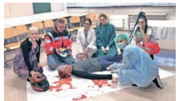
Dijaki Srednje šole Jesenice so pripravili sedem zanimivih delavnic, veliko zanimanja je vzbudila tudi delavnica zdravstvene usmeritve.

dnja šola Jesenice. Predstavila se je s strojno, zdravstveno in predšolsko usmeritvijo, dijaki ob pomoči profesorjev pa so pripravili sedem zanimivih delavnic, s katerimi so devetošolce skušali navdušiti za šolanje za poklice v strojništvu, zdravstveni negi in predšolski vzgoji.