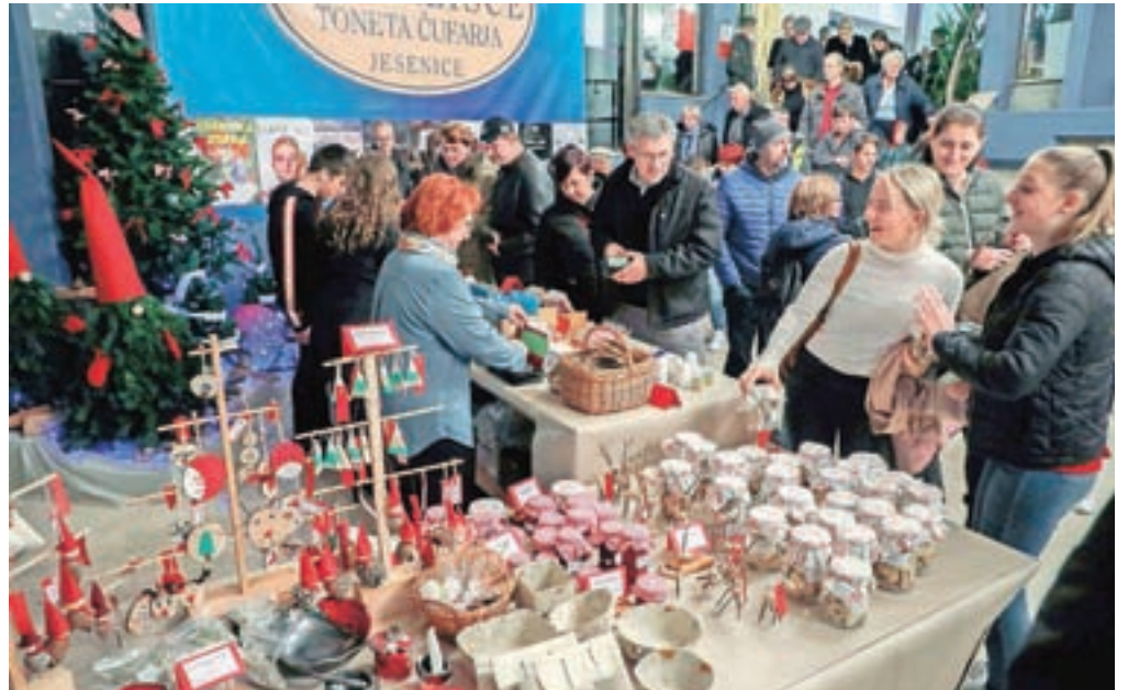
Praznični bazar OŠ Poldeta Stražišarja Jesenice