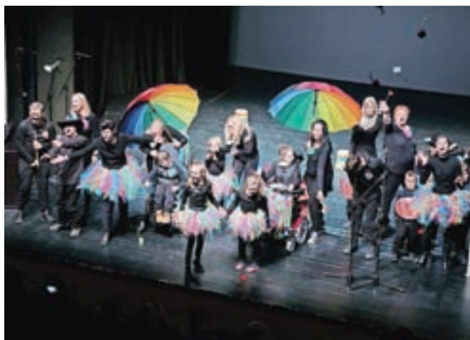
Točke so naslovili po sestavinah, ki jih potrebujemo za dobro voljo.

skupaj zneslo eno leto. Vsak dan posebej pripravi tako, da vzameš en del pridnosti ter dva dela dobre volje in humorja. Vsemu temu dodaj tri žlice optimizma, čajno žličko strpnosti, zrnce poguma in ščepec taktnosti. Dobljeno maso dobro pregneti, pusti vzhajati ravno pravi časa, bogato prelij z ljubeznijo in srčnostjo. Pripravljeno jed okraši s šopkom drobnih pozornosti in jo vsak dan serviraj v globokih krožnikih z vedrino in nasmehom," je pojasnila.