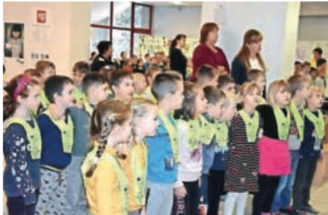
Učenci so zapeli pesem Čebelar.

Na Osnovni šoli Prežihovega Voranca Jesenice so se pridružili akciji tradicionalni slovenski zajtrk in otroci so tako pri malici jedli domačo hrano: med, maslo, mleko, kruh in jabolka. Zapeli so tudi pesem Ansambla Lojzeta Slaka Čebelar, tako kot učenci na številnih drugih šolah in v vrtcih po Sloveniji. Posladkali so se tudi z medenjaki, ki so jih spekli učitelji podaljšanega bivanja. Učitelji so se sicer več teden z učenci pogovarjali o pomenu zajtrka, o lokalno pridelani hrani in o čebelah.