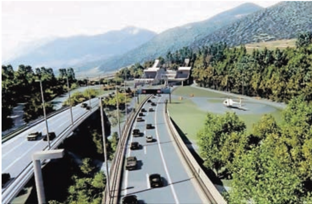
Takšen naj bi bil videti predor Karavanke po izgradnji vzhodne cevi.

Na Darsu upajo, da bodo pogodbo z izvajalcem podpisali po novem letu. Glede na vremenske razmere bi stroji na gradbišču zabrnili najkasneje marca, dela naj bi trajala pet let, čeprav je vodstvo turškega Cengiza javno zatrdilo, da bodo dela zaključili leto prej in s tem nadoknadili zamudo, ki je zaradi številnih pritožb nastala na slovenski strani. Na avstrijski strani je izva-