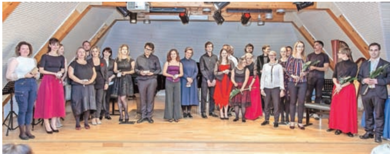
Učitelji so s koncertom znova navdušili.