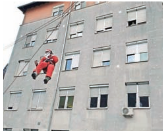
Žičnico so napeljali od stavbe E do glavne bolnišnične stavbe, po njej so se spustili štirje decembrski dobri možje.

Člani Gorske reševalne službe Jesenice so tudi letos, že četrto leto zapored, razveselili otroke na pediatričnem oddelku Splošne bolnišnice Jesenice. Kot Božički so se spustili po žičnici iz stavbe E do vhoda bolnišnice, kjer so jih pričakali tudi otroci iz Vrtca Jesenice. Nato pa so peš odšli do pediatričnega oddelka in najmlajšim pacientom razdelili darila.