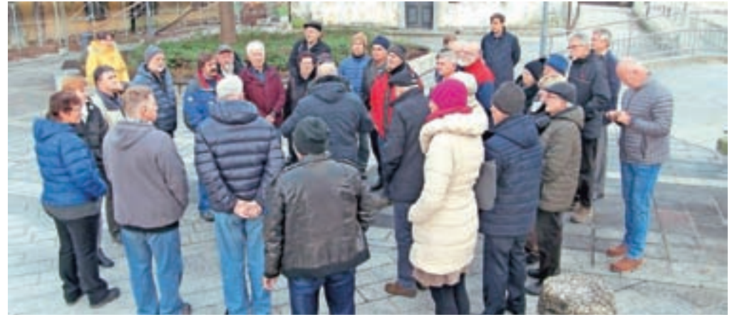
Udeleženci, zlasti nekdanji železarji, so si ogledali železarsko dediščino Stare Save.