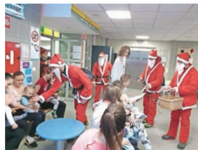
In še zadnja postaja Božičkov: pediatrični oddelek, kjer so razveselili bolne otroke in jim razdelili risbice in darilca.