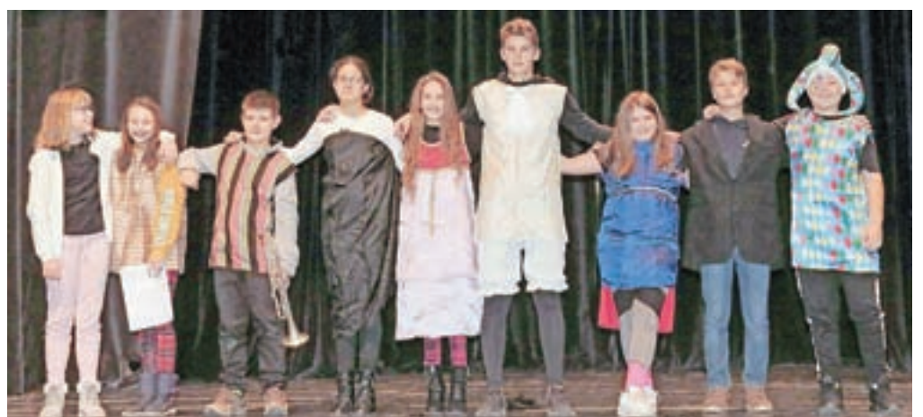
Nastopajoči v predstavi