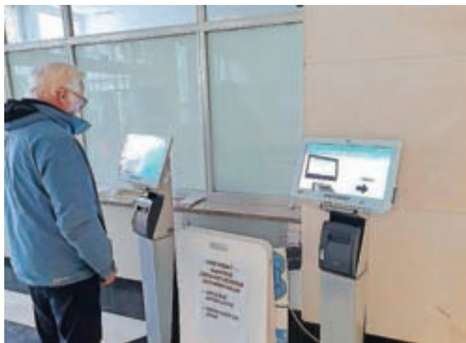
Vrstomat stoji v avli zdravstvenega doma, uporaba pa je povsem enostavna.

»Za elektronsko registracijo pacientov in uvrstitev v čakalno vrsto v ustrezni ambulanti pa je nujno, da je pacient že predhodno naročen v ambulantni. V primeru, da ni naročen, mu ta izpiše, da se mora zglasiti na sprejemnem pultu v avli, kjer ga