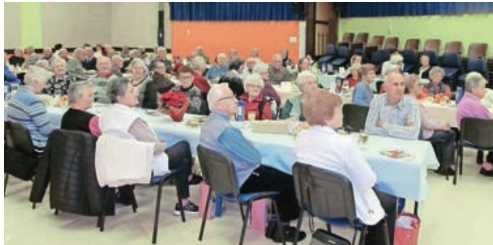
Srečanje starejših KS Plavž ...