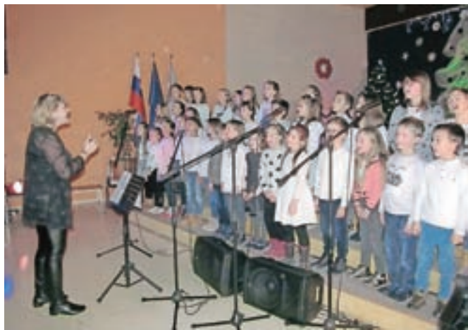
Obiskovalce so navdušili mladi pevci šolskih pevskih zborov.