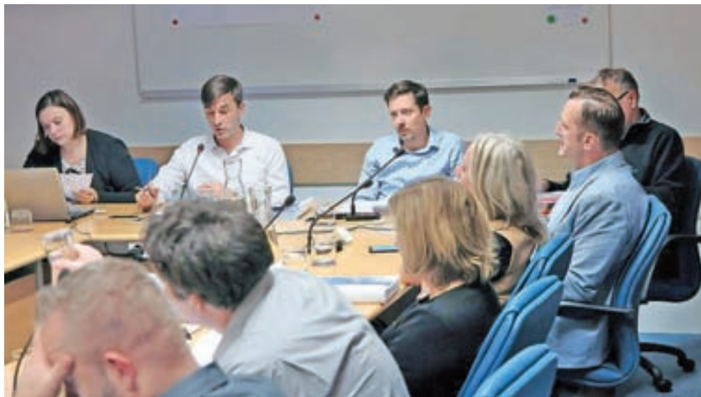
Zadnja letošnja seja občinskega sveta je bila tudi najdaljša, trajala je več kot šest ur.

Najbolj pereča točka dnevnega reda pa je bilo predlagano povišanje cen komunalnih storitev. Javno komunalno podjetje Jeko je predlagalo spremembo cen gospodarskih javnih služb odvajanja odpadne vode, zbiranja odpadkov in oskrbe s pitno vodo (pri štiričlanski družini bi to pomenilo dobrih deset evrov na mesec več na položnici). Predlagalo je tudi potrditev cene 24-urne dežurne pogrebne službe in spremembo cen storitev pokopališke dejavnosti. Nobenega od omenjenih predlogov