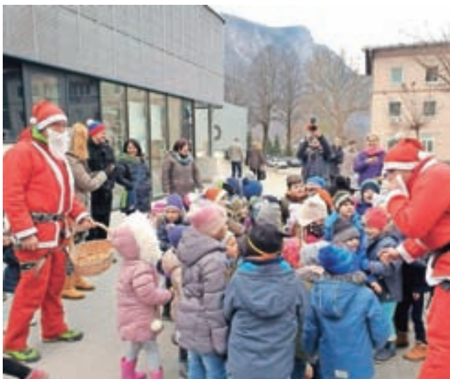
Božičke so pričakali otroci Vrtca Jesenice, ki so za bolne otroke na oddelku prinesli risbice in jim poslali zdravilne objeme.