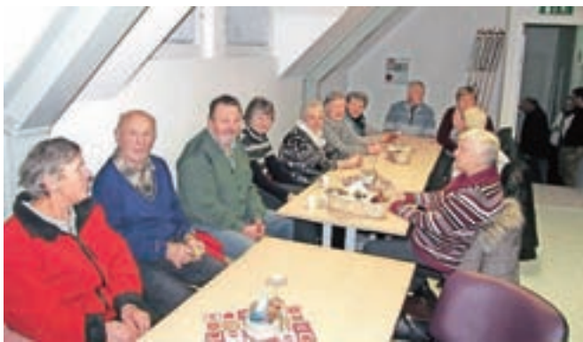
... in KS Planina pod Golico