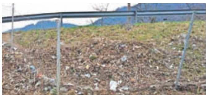
Kupi odpadkov ob lokalni cesti na Spodnjem Plavžu