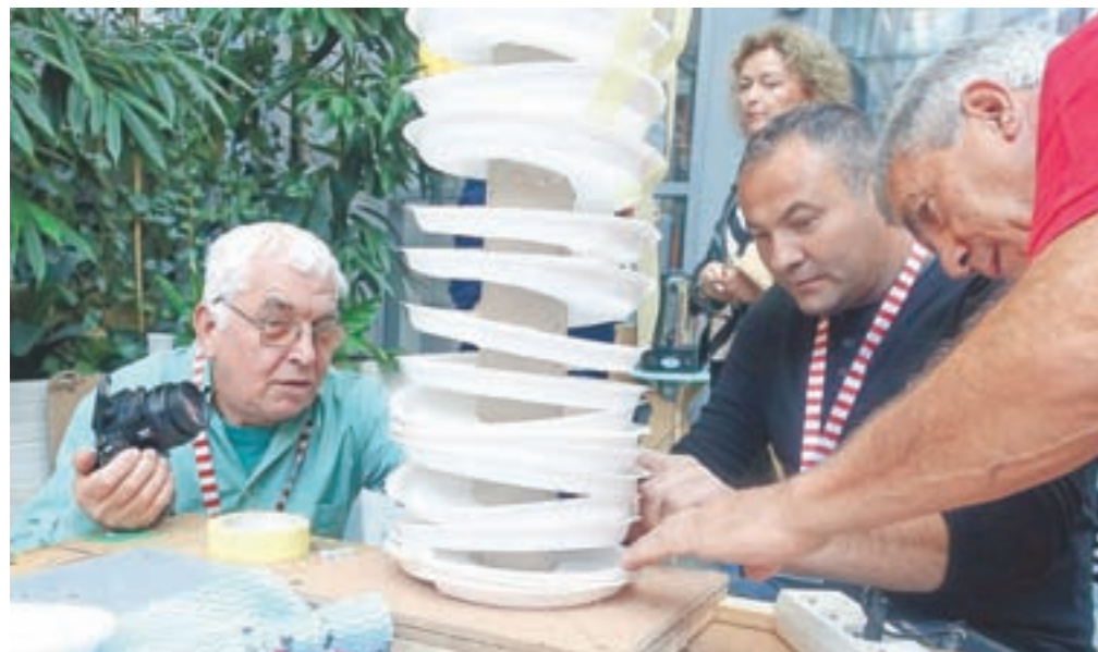
Pri verižnem eksperimentu gre za skupek naprav, ki se pomočjo kroglice poganjajo ena za drugo.

Ob takšnih dosežkih torej izzivov ne manjka? »V glavi je še veliko načrtov, a zmanjkuje časa. Želim si, da bi več slovenskih šol in vrtcev prevzelo verižni eksperiment kot svojo dejavnost, ker je odlična pot za urjenje ročnih spretnosti mladine. Morda nas podpre celo ministrstvo za šolstvo. Upam, da se bo verižni eksperiment širil še po drugih državah. Ta projekt je nastal in se razvil v Sloveniji in je unikaten. Odličen je, ker povezuje v ustvarjanju med seboj vse generacije: upokoјence, starše, vnuke in pedagoško osebje. Naši upokoјenci in upokoјenke, ki sodelujejo v projektu kot mentorji, so navdušeni nad njim. Veseli bomo, če se nam še kdo pridruži. Tudi jeseniška podjetja in zavodi nas podpirajo. Jeseni bomo organizirali državno prvenstvo Verižni eksperiment 2020, ki je sedaj predstavljeno zaradi epidemije, in pa še zadnjo mednarodno delavnico.«