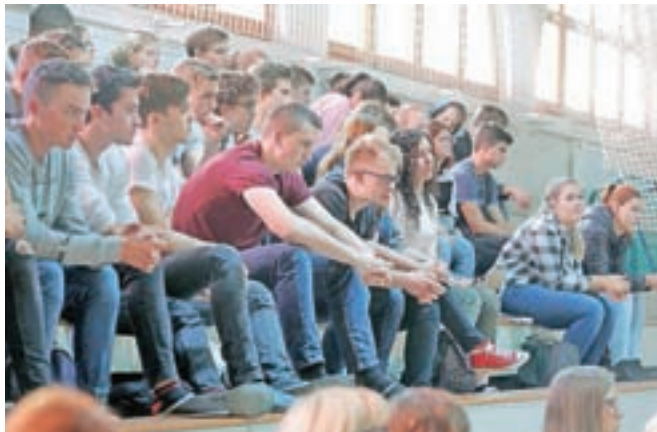
Tudi dijaki Gimnazije Jesenice se zadnje tedne šolajo na daljavo.

Kot pravi ravnateljica, so v pouk na daljavo tako rekoč padli, profesorji pa so k sreči imeli že nekaj izkušenj s tovrstnim poučevanjem dijakov športnikov. »Profesorji porabijo veliko več časa za pripravo in samo izvedbo pouka na daljavo. Seveda pa sta vložena trud in čas poplačana s pozitivnim odzivom dijakov. Zavedamo pa se, da tudi dijaki porabijo veliko več časa pri tovrstnem pouku,« pravi Dornigova.