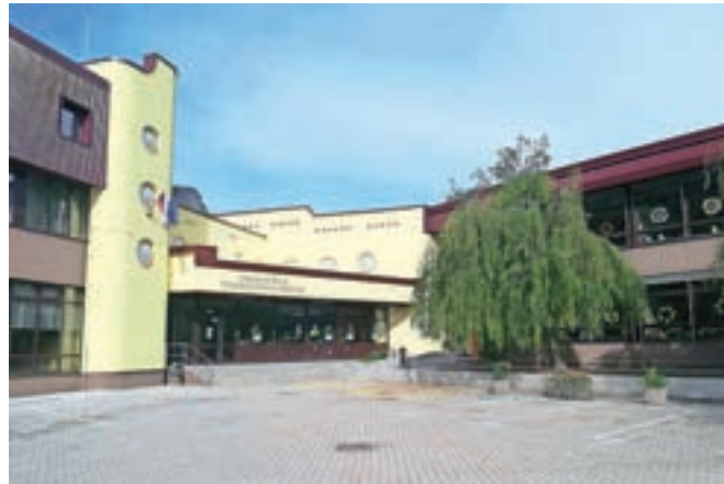
Stavba Osnovne šole Toneta Čufarja je obnovljena.