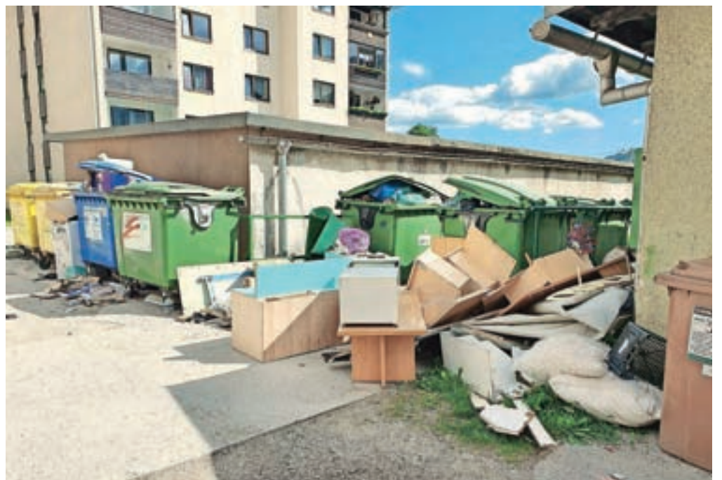
Odlagališče kosovnih odpadkov med bloki na Koroški Beli

Bralka nas je opozorila na težavo, s katero se srečujejo na Koroški Beli. Sredi vasi je namreč nastalo pravo odlagališče kosovnih odpadkov, ki bi v resnici sodili v zbirni center. Tako domačini opozarjajo, da imajo otežen dostop do zabojnikov za smeti, širi se neprijeten vonj, prihaja pa tudi do velikega nezadovoljstva in celo preprirov. S težavo so seznanjeni na Občini Jesenice, kjer so se obrnili na javno komunalno podjetje Jeko in dobili zagotovilo, da bodo odpadke odpeljali. Stanje si je ogledal tudi redar Medobčinskega inšpektorata in redarstva Jesenice, v prihodnje naj bi nadzor nad ekološkimi otoki še poostri. Na Občini Jesenice sicer ugotavljajo, da do takšnega nepravilnega odlaganja odpadkov prihaja tudi v drugih delih občine. Ob tem velja ponovno poudariti, da vsi občani, ki so