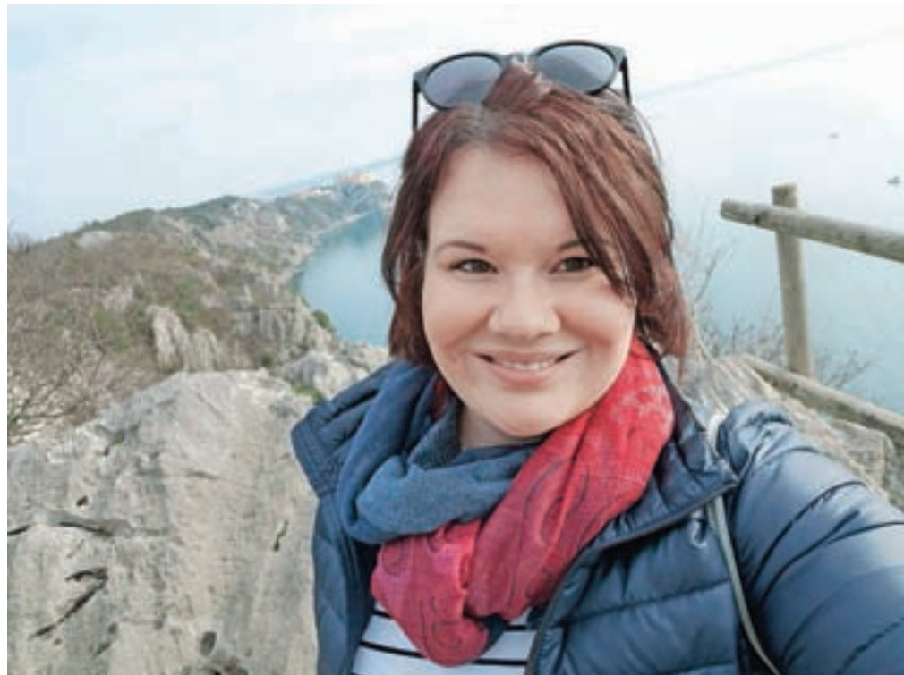
Vsakdan Monike Sušanj se zavoljo epidemije ni zelo spremenil, pogreša le nekaj najdražjih, prijatelje in občutek, da lahko počne, kar želi.

In kako sogovornica gleda na trenutno situacijo epidemije? Pravi, da je vsekakor zelo težka, ne zgolj zaradi virusa, temveč zaradi nujne socialne distance, strahu, ki ga doživlja vsak posameznik po svoje, negotovosti. »Že pred leti sem nekje prebrala, da so spremembe edina stalnica v življenju. Čas bo pokazal, kako bo življenje šlo naprej, zagotovo pa bomo nekoliko bolj pazili na stike in razdaljo. Z določenimi ukrepi bomo morali živeti, določene spremembe si bo v svoje življenje lahko vnesel vsak posameznik,« je dejala in sklenila: »Upam, da bomo bolj pazili tudi na odnose. To je tudi edino, kar šteje. Odnosi, s tistimi, ki so nam blizu, ki jih imamo radi, ki nas imajo radi, odnos do šibkejših in ranljivejših v družbi. Če se bomo tega naučili, bo zelo veliko.«