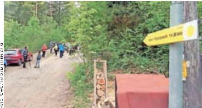
Pot je označena s smerokazi in markacijami.

Pot je prehodna in označena z rumenimi markacijami v obe smeri, vrisana pa je tudi v Pohodniško karto Jesenic. Iz razglednih točk – pomolov se odpirajo lepi pogledi na mesto. Na Kozjaku in Malem Jelenkamnu sta vpisni knjigi z žigom, kjer se pohodniki lahko vpišejo in strnejo vtise s poti.