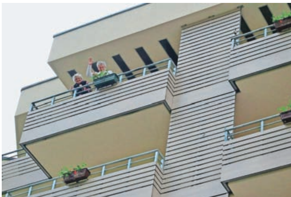
Stanovalci doma starejših so budnico spremljali z balkonov.