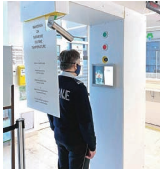
Merjenje telesne temperature pri vходу v bolnišnico na napravi IR TempMeter

Poleg naprave, ki deluje v jeseniški bolnišnici, so kamero in sondo kupili tudi v Velenju in jo uporabljajo v tamkajšnjem zdravstvenem domu. Deset sond so kupila tudi podjetja, ki že imajo IR-kamere, z nadgradnjo s sondo