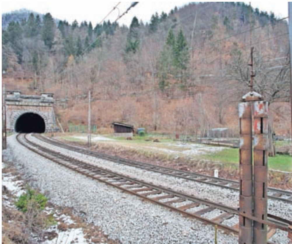
Železniški predor Karavanke na Hrušici: en tir bodo odstranili, proga med postajama Jesenice in Področca bo le še enotirna.

Tudi prenova železniškega predora Karavanke bo skupni projekt Slovenije in Avstrije, le da je bil tokrat objavljen skupni razpis Slovenskih železnic in avstrijskih železnic ÖBB za izvedbo gradbenih del. Kot so nam povedali na Družbi RS za infrastrukturo (DRSI), so se za skupni razpis odločili iz več razlogov. »Eden od pglavitnih je predvsem potrebna novitost tehničnih rešitev, ki je vezana na skupno zaporo železniškega prometa na tem odseku, kakor tudi dejstvo, da si ne moremo privoščiti nikakršnih zamud oziroma razhajanj v izvedbi,« so pojasnili. Poleg tega so dela vezana na popolno zaporo železniške proge, zato bo tudi ves tovorni promet usmerjen na obvozne železniške proge, na slovenski strani predvsem na železniško progo Zidani Most–Pragersko–Šentilj. Postopke javnega naročanja so prevzele avstrijske železnice, po pojasnilu DRSI zato, ker je železniški predor pretežno na avstrijski strani. V okviru projekta bodo železniški predor Karavanke varnostno-tehnično nadgradili. Glavna sprememba bo ta, da bodo odstranili drugi tir in zgradili enotirno progo v predoru in na odseku proge od