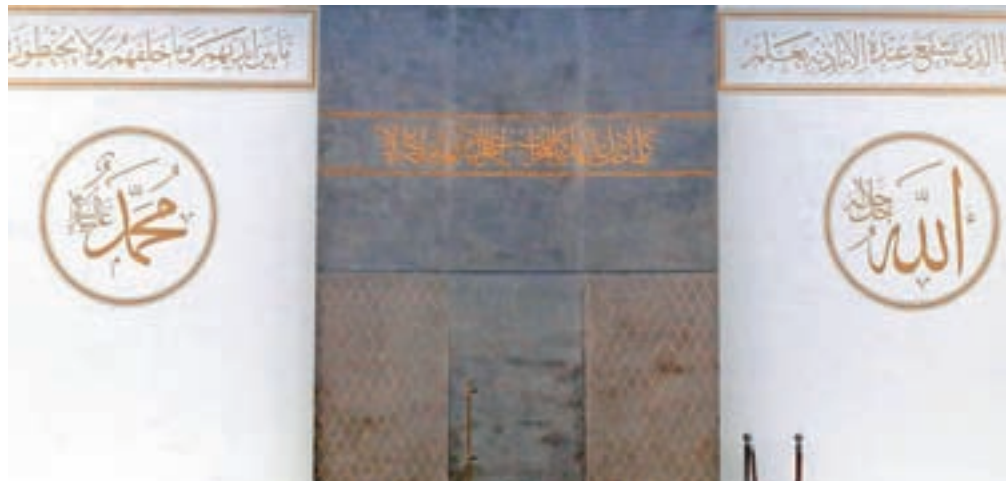
Notranost ljubljanske džamije, v kateri od ponedeljka ponovno potekajo molitve.

Letošnji ramazan je drugačen zaradi epidemije in pre-