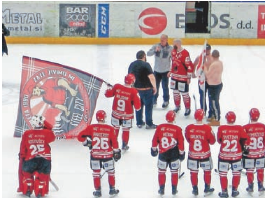
Jeseniški igralci so na zadnji domači tekmi pred prekinitvijo sezone predali zastavo navijaški skupini Red Stellers ob njihovi tridesetletnici delovanja.

Trenutno stanje je treba prebroditi in gledati naprej. V jeseniškem hokejskem kolektivu so postavili določene cilje. V članski ekipi želijo delati z mladimi igralci iz slovenskega prostora, predvsem pa iz jeseniške baze igralcev. Želijo si, da bi imeli mlado člansko ekipo, ki bi bila prepoznavna ter dobro in strokovno vodena. Ničkoliko mladih slovenskih hokejistov, ki so še daleč od