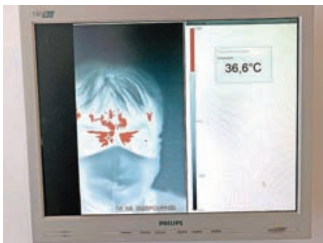
Kamera vsako sekundo opravi več deset meritev in povprečje izmerjenih temperatur prikaže kot meritev.

pa jih zdaj uporabljajo za merjenje telesne temperature zaposlenih. Poteka pa tudi že serijska proizvodnja sond, ki bodo namenjene pretežno v tujino imetnikom IR-kamere.