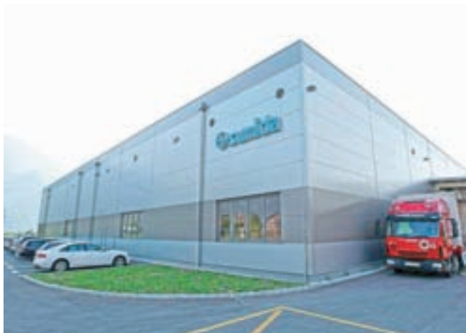
Sumida Slovenija na Blejski Dobravi

»Za ukrep čakanja na delo se nismo odločili, saj bo padec prodaje dolgotrajnejši in ker ne bomo zadostili pogojem iz prvega zakona o interventnih ukrepih, kjer bi morali naši prihodki v prvem polletju pasti za več kot dvajset odstotkov v primer-