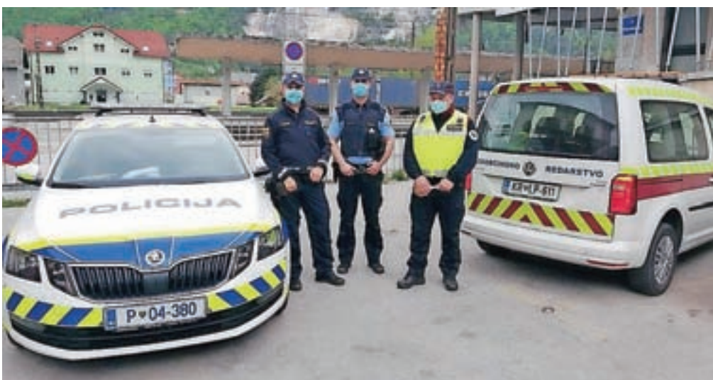
Jeseniški policisti in redarji so opravili nadzor nad vožnjo kolesarjev.

Poostrene nadzore bodo sicer izvajali še do konca meseca.