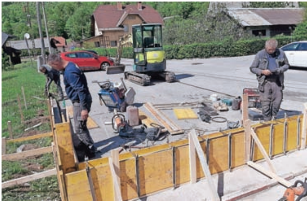
Nove kolesarnice bodo nasproti zdravstvenega doma (za trafiko), na Slovenskem Javorniku (nasproti Pizzerie Venezia) in na Blejski Dobravi (nasproti gasilskega doma).

Tako so prejšnji teden že začeli graditi še tri nove kolesarnice, ki jih bo Občina Jesenice zgradila v okviru projekta Hitro s kolesom in bodo dopolnile tri že obstoječe kolesarnice kolesarskega sistema JeseNICE bikes. Nove kolesarnice bodo nasproti zdravstvenega doma (za trafiko), na Slovenskem Javorniku (nasproti Pizzerie Venezia) in na Blejski Dobravi (nasproti gasilskega doma).