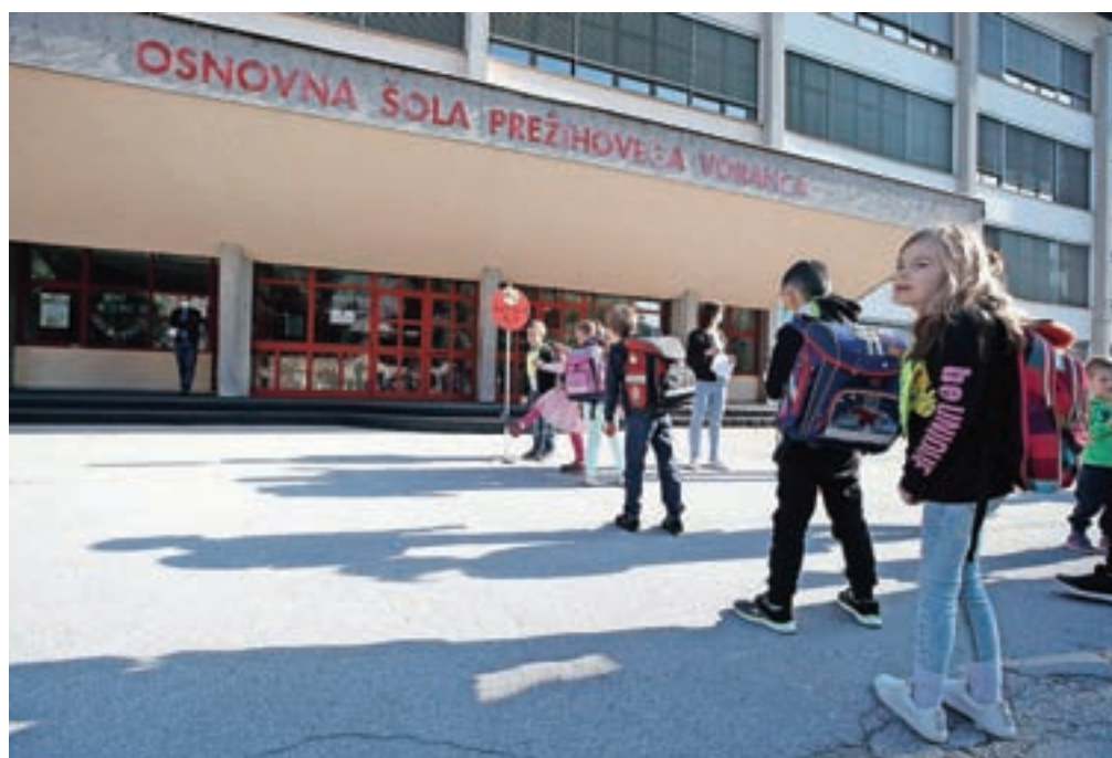
Ponedeljek pred Osnovno šolo Prežihovega Voranca Jesenice: kot bi bil ponovno prvi september ...

Posebna pravila veljajo v jedilnici, ki so jo povsem preuredili, naenkrat je v njej lahko le štirideset otrok, čeprav je v njej prostora za 230 učencev. Pred delilnim pultom so začrtane talne ozna-