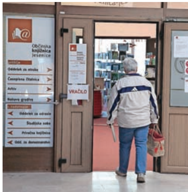
Osrednja jeseniška knjižnica je ponovno odprta.