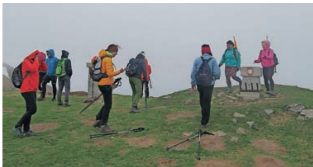
Vrh 1836 metrov visoke Golice je bil oblegan kljub vetrovnemu in hladnemu vremenu.