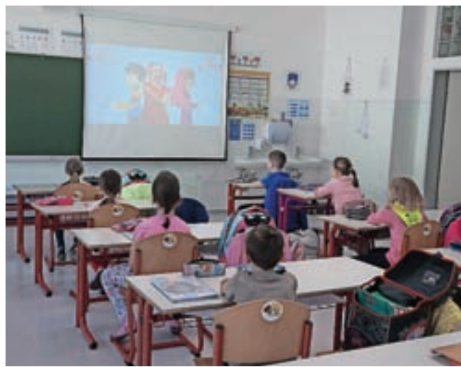
V vsaki klopi lahko sedi samo en učenec, namesto devetih oddelkov jih imajo zdaj osemnajst.