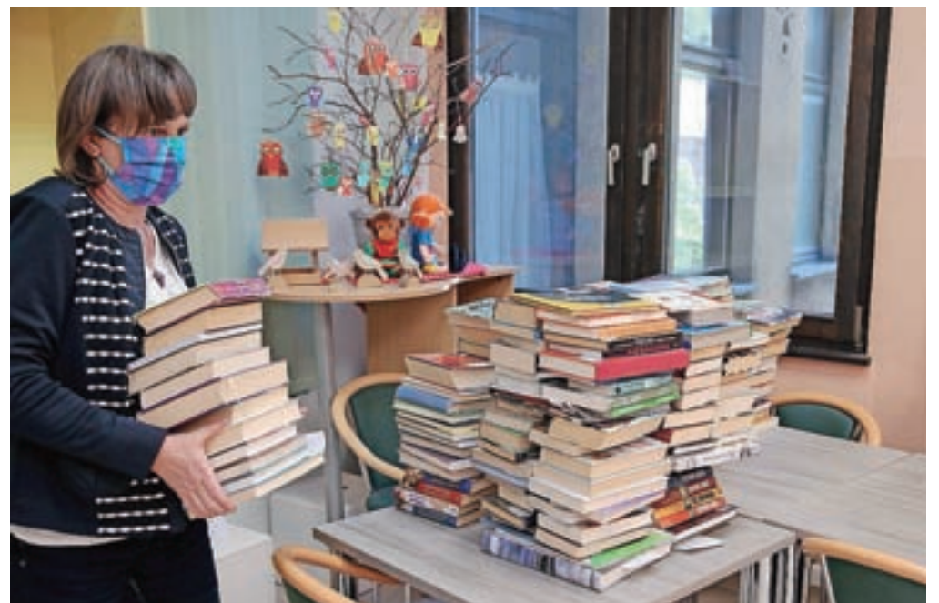
Nova, začasna resničnost v knjižnicah: bralci ne morejo sami izbirati knjig, zanje to storijo zaposleni.

"Obisk in izposoja sta sicer manjša kot v časih pred karanteno. Sklepamo, da ljudje še malo odlašajo z obiskom knjižnice, možno je tudi, da mnogi kljub vsem objavam še ne vedo, da nas lahko spet obiščejo. Obiskovalci lahko v knjižnici vrnejo že izposojeno knjižnično gradivo in si izposodijo novo. Žal po navodilih NIJZ bralci še ne smejo med knjižne police in sami izbirati knjig, zato zelo spodbujamo, da si knjige naročijo v servisu Moja knjižnica v sistemu COBISS, po e-pošti ali telefonu. Pripravljene knjige namreč lahko hitro prevzamejo, izposoja je zato tekoča, torej brez zastojev in nepotrebne čakanja in s tem možnega ogrožanja čakajočih bralcev," razlaga direktorica. Je pa res, dodaja, da je prosti pristop do knjižnične zbirke temelj vsake sodobne knjižnice, zato bralci sprehod med policami pogrešajo. "Tisti, ki knjižnico že obiskujejo, so se s pultnim sistemom