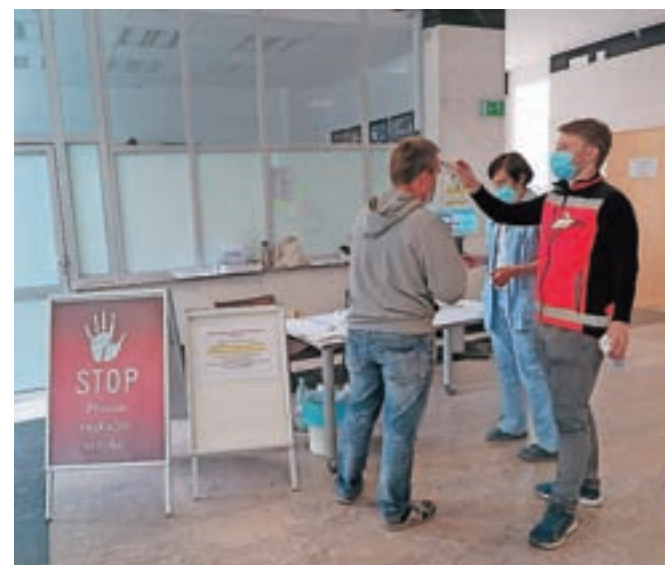
Pri vhomu v zdravstveni dom ostaja vstopna točka, kjer vsakega naročenega pacienta sprejmejo in mu tudi izmerijo telesno temperaturo.

Vsi pacienti se morajo pred prihodom v zdravstveni dom naročiti na pregled, torej poklicati po telefonu ali se naročiti po elektronski pošti. Za nujne paciente je poskrbljeno v Službi nujne medicinske pomoči, ki deluje v sklopu Urgentnega centra Jesenice v bolnišnici.