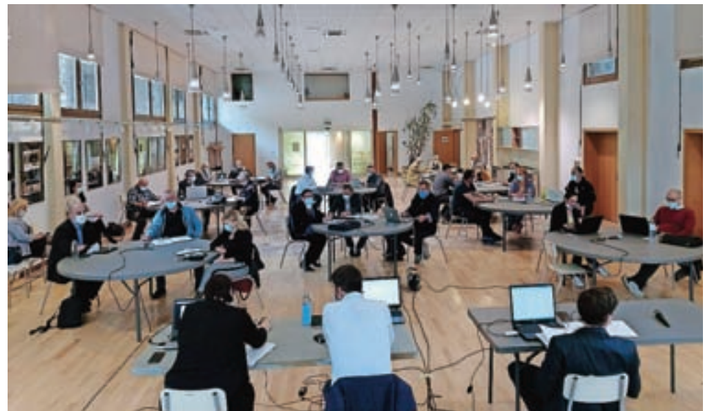
Seja je tokrat potekala v Kolpernu.

Po skrajšanem postopku so sprejeli tudi predlog Odloka