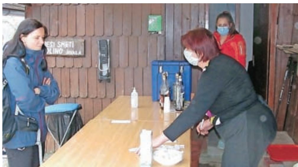
Osebje koč se je prilagodilo razmeram in streže v zaščitnih maskah.

sprašujejo, kako je pri nas in kdaj bodo lahko prišli.« Ob sproščanju ukrepov in upoštevanju vseh navodil za zdaj ni vprašljiva izvedba tradicionalnega junijskega pohoda Občine Jesenice na Golico na praznik dneva državnosti. Letošnji bo enajsti po vrsti. Priprave so se začele, izvedba pa bo prilagojena izvajanju vseh potrebnih zaščitnih ukrepov.