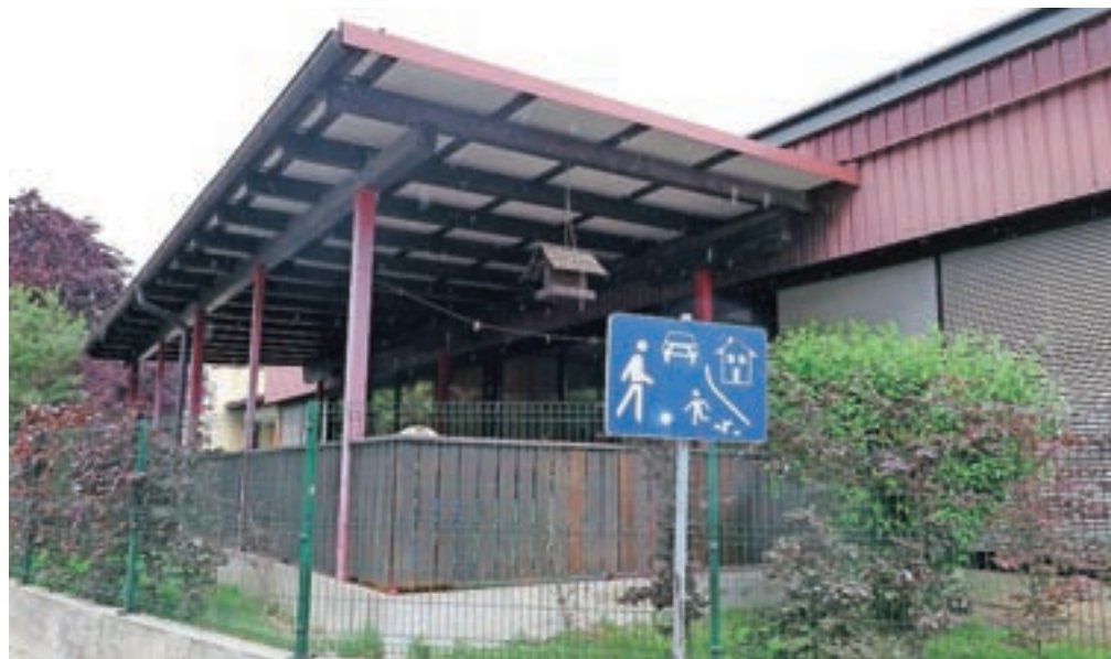
Tako streha kot sama stavba nista izolirani, stavbno pohištvo je dotrajano in v celoti potrebno zamenjave.