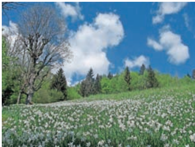
Travniki v Plavškem Rovtu so posuti z narcisami.

vilne obiskovalce, domačini še vedno skrbijo za tradicionalni način kmetovanja ter redno, a pozno košnjo v juniju. Razvojna agencija Zgornje Gorenjske in Občina Jesenice pa sta v letu 2016 oblikovali tudi večletni program Ohranimo narcise, v sklopu katerega so lastniki zemljišč, ki upoštevajo ukrepe za ohranjanje narcis, upravičeni do nadomestila iz občinskega proračuna. V maju v Turističnem društvu Golica vsako leto poskrbijo tudi za prireditve Mis narcis. Letos naj bi potekala v soboto, 23. maja, a so bili zaradi epidemije in prepovedi večjih prireditev prisiljeni vse majske prireditve odpovedati oziroma prestaviti.