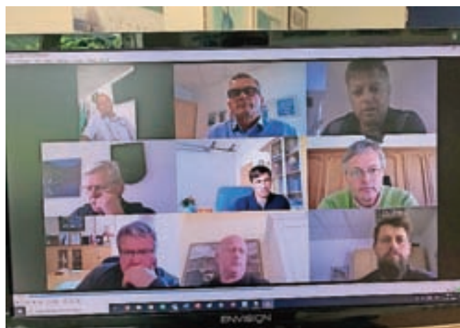
Župani so tokrat sestankovali virtualno.

mora biti turizem destinacije Julijske Alpe v prihodnje trajnostno naravnano, zavzeli so se za manj masovni turizem, ki bo prinesel več dodane vrednosti. Na sestanku pa so govorili tudi o lokalni samooskrbi v času epidemije. Z aktivnostmi Razvojne agencije