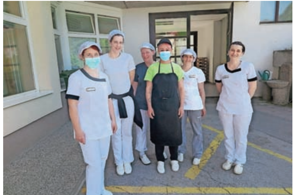
Del deklet iz domske kuhinje