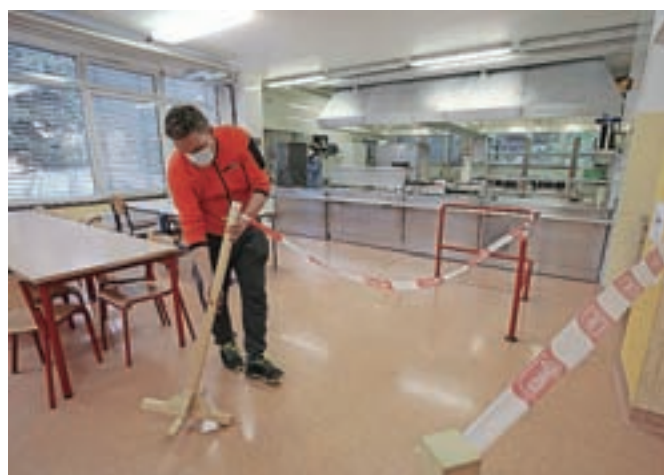
Tudi v jedilnici so pravila po novem povsem drugačna, naenkrat je v njej lahko le štirideset otrok, začrtane so tudi talne oznake za varno razdaljo.