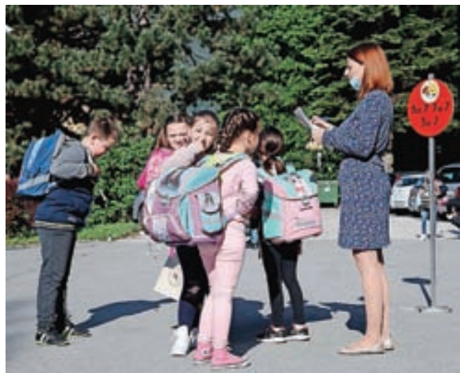
Učenci so razdeljeni v manjše skupine, pri vrodu v šolo jih pričakajo učiteljice in pospremiijo v razrede.