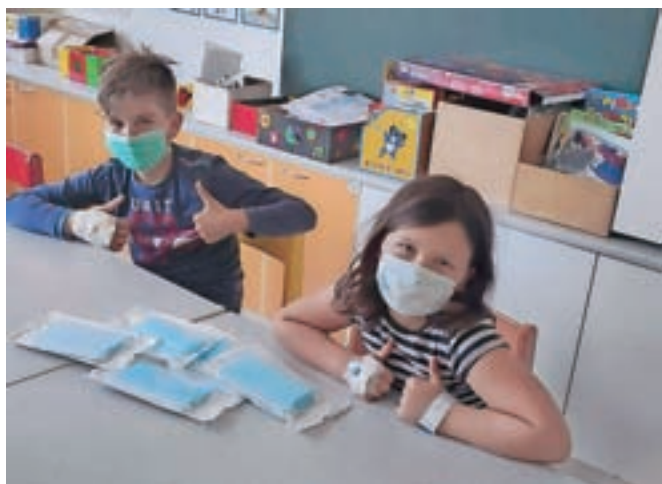
Zaščitne maske za male bolnike na otroškem oddelku je podarilo Društvo za pomoč otrokom z redkimi boleznimi Viljem Julijan.

ne maske za male bolnike, ki se v teh dneh zdravijo na oddelku. Maske jim je v društvu uspelo dobiti z veliko truda s pomočjo kitajske organizacije za redke bolezni in v sodelovanju z japonsko farmacevtsko družbo Takeda.