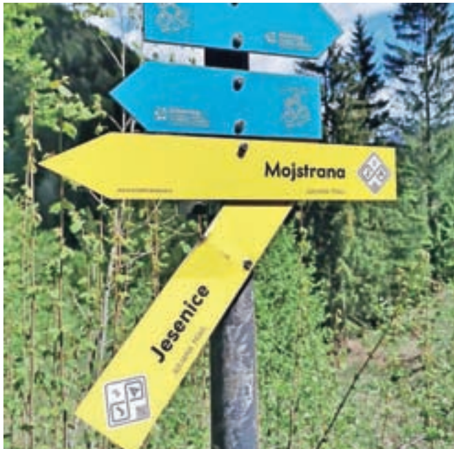
Vandali so se spravili nad usmerjevalne table za pohodniško pot Juliana Trail.

Lani jeseni so odprli krožno daljinsko pohodniško pot Juliana Trail, ki poteka okrog Julijskih Alp, speljana pa je tudi skozi jeseniško občino. Okrog 270 kilometrov dolgo pot, ki je razdeljena na 16 etap, je doslej prehodilo že ogromno pohodnikov, ne le iz Slovenije, ampak tudi iz drugih držav. Pot je označena s smerokazi, ki so rumene barve, v logotipu JA (Juliana Trail) pa je tudi številka etape. Žal pa so bile table v jeseniški tarči že tarče vandalizma, saj so jih vandali poškodovali in ukrivili. V Turistično-informacijskem centru (TIC) Jesenice, kjer so lani poskrbeli za uradno odprtje jeseniškega dela poti, so raz-