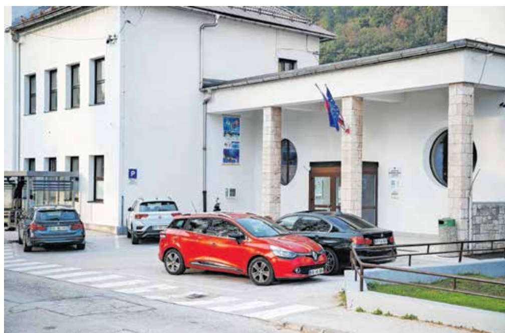
Pri Osnovni šoli Koroška Bela je le nekaj parkirnih mest, zato imajo tako zaposleni kot starši in obiskovalci težave, kje parkirati ...

V občinski upravi so pojasnili, da je bila s strani OŠ Koroška Bela in Krajevne