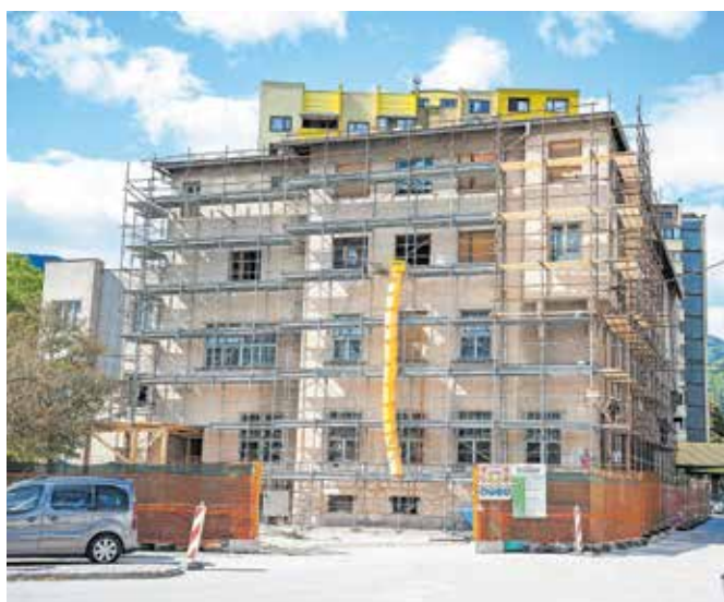
Obnova stavbe sodišča bo stala okrog pet milijonov evrov.

štalacij, s protipotresno utrditvijo objekta, zamenjavo strehe in stavbnega pohištva in obnovo fasade. Uredili bodo dostop v stavbo za funkcionalno ovirane osebe, vključno z vgradnjo dvigala. V okviru celovite prenove