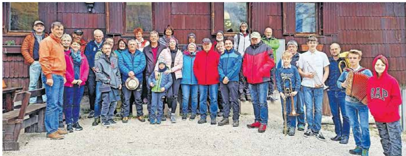
Udeleženci srečanja pri Erjavčevi kočici na Vršiču

zona, ima pa kup načrtov, da kočica ohranja domačnost, kar je najlepša popotnica, da bo sloves ohranila za bodoče rodove. Na srečanju so se spomnili še enega letošnjega okroglega jubileja, stoletnice Knafelčeve markacije, Jeseniški markacisti so predstavili svo-