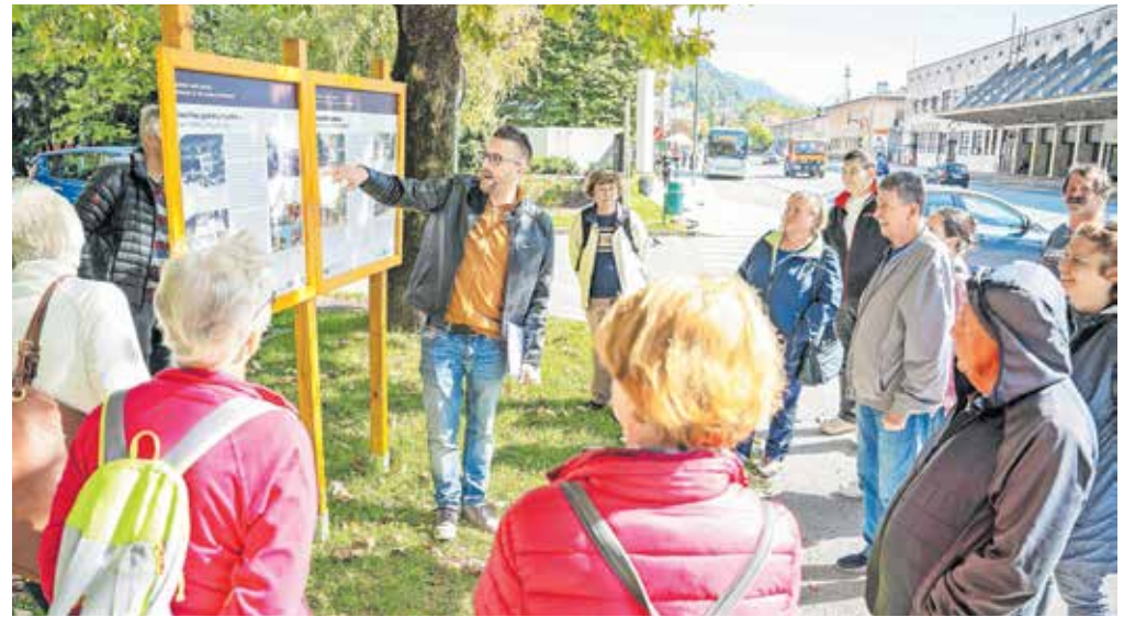
Razvojna agencija Zgornje Gorenjske je ob uradnem odprtju pripravila še voden ogled tretjega dela tematske poti Spomini starih Jesenic, odsek med nekdanjo Tancarjevo gostilno, danes restavracijo Ejga, in stavbo TVD Partizan, nekdanjim Sokolskim domom.

»Zdi se mi pomembno, da kot skupnost vemo, od kod prihajamo. Na ta način lažje poznamo sebe danes, prepoznavamo lastne interese in si tako tlakujemo pot v prihodnost. Verjamem, da bodo informacije o starih Je-