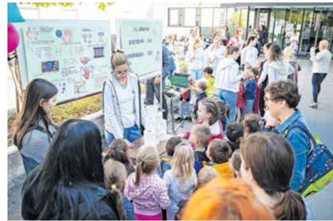
Otrokom so dijaki ponazorili vsakodnevne situacije, ob katerih moramo poiskati umivalnik z milom in brisačo.

Kot je povedala Sandra Jerebic iz bolnišnice, je umivanje rok ena glavnih veščin, ki se je mora človek naučiti že v mladih letih. S skrbno higieno rok namreč lahko preprečimo marsikatero okužbo. Svetovni dan umivanja rok zaznamujejo vsako leto, letos pa je bil dogodek še posebej pester, kajti sodelovali so dijaki vseh treh usmeritev Srednje šole Jesenice: zdravstvene, vzgojiteljske in strojne. Postavili so »postaje« z različnimi predstavitvami in otrokom iz vrtca ob veselih zvokih harmonike ponazorili vsakodnevne situacije, ob katerih moramo poiskati umivalnik z milom in brisačo, kot so kuhanje, uporaba stranišča, dotikanje denarja, računalniške