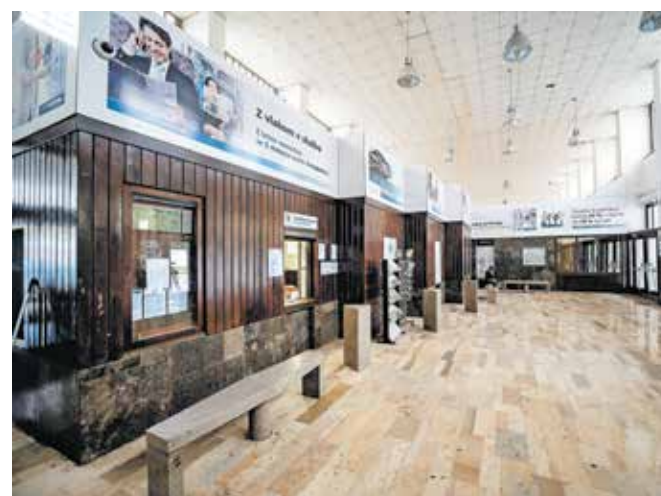
Novo podobo bo dobila tudi vhodna avla.

»Za zdaj je skupaj predvidenih več kot 120 novih parkirnih mest. Veselimo se prenove postajnega objekta, ki ga želimo tesneje povezati z mestom, veselimo se novih podhodov in prečnih povezav,« je dejal župan Blaž Račič.