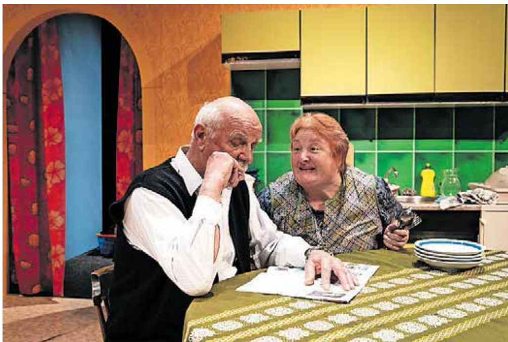
Prvi večer se bo predstavila domača igralska skupina Gledališča Toneta Čufarja s komedijo Mihe Mazzinija Za vse sem sama.

»Festival ima res tradicijo, 35 let se je obdržal s svojim zvestim občinstvom.«