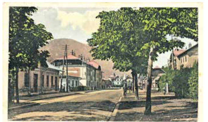
Pogled proti kolodvoru leta 1936. Med gimnazijo in kolodvorom je bil nekoč kostanjev drevored, ki so ga zaradi širitve ceste podrli.

RAGOR projekt izvaja v partnerstvu z Gornjesavskim muzejem Jesenice, financira pa ga Občina Jesenice. V načrtu je, da bi tematsko pot prihodnje leto zaključili še s četrtnim delom, predstavivijo območja na Stari Savi, s čimer bi bila povezana glavna tri naselja, ki so se leta 1929 združila v mesto Jesenice.