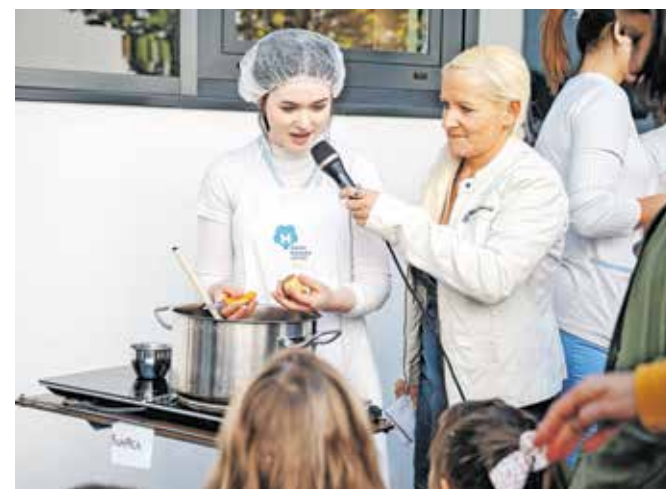
Tudi kuharice, ki pripravljajo hrano, morajo skrbeti za higieno rok, so dijaki spomnili malčke iz vrtca.