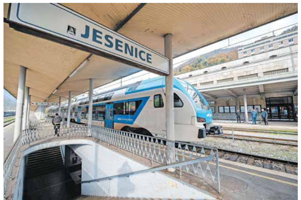
Železniška postaja Jesenice bo v celoti prenovljena.

Na železniški postaji Jesenice bodo zamenjali zgornji in spodnji ustroj postajnih tirov, nadgradili vozno mrežo nad postajnimi tiri, zgradili nov peron in obnovili dva obstoječa perona. Predvidena je celovita obnova objekta železniške postaje, v avli naj bi posodobili prostor za prodajo voznic, uredili prostor za TIC ... Zgradili bodo nov podhod pod progo ob stolpnici na Cesti revolucije 2b (do cen-