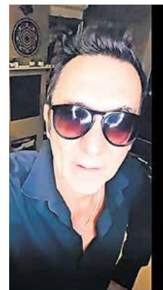
V kratkem zabavnem filmčku k učenju bosanskega jezika vabi Branko Đurić - Đuro, in sicer v svoji značilni mešanici slovenščine in bosanščine.