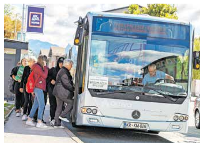
Kakšen mestni promet si želijo in potrebujejo Jeseničani?

»Potnikom, ki bodo sodelovali pri raziskavi, se že vnaprej lepo zahvaljujemo za sodelovanje – verjamemo, da bodo informacije pripomogle k oblikovanju