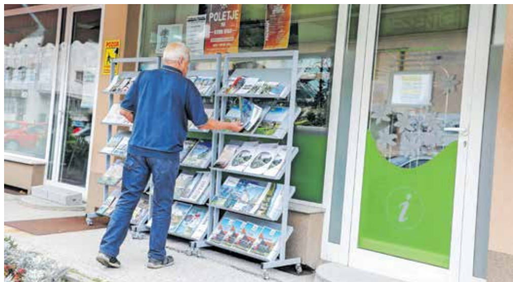
V pisarni TIC se radi ustavijo tudi domačini, največkrat kupijo spominke, ki jih odnesejo svojim prijateljem v druge države, prihajajo pa tudi po različne promocijske materiale.