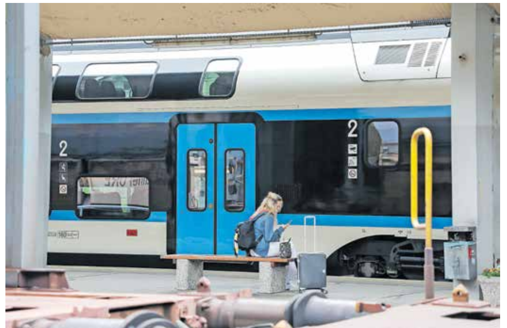
Med obiskovalci prevladujejo pohodniki, ki pridejo z vlakom in svoje potovanje začnejo na Jesenicah.