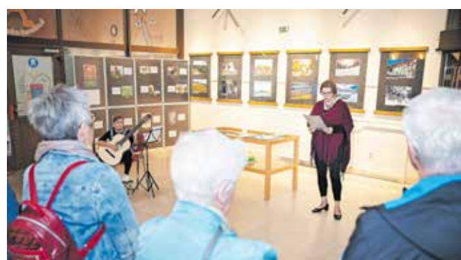
Z odprtja razstave fotografij, izbranih za koledar