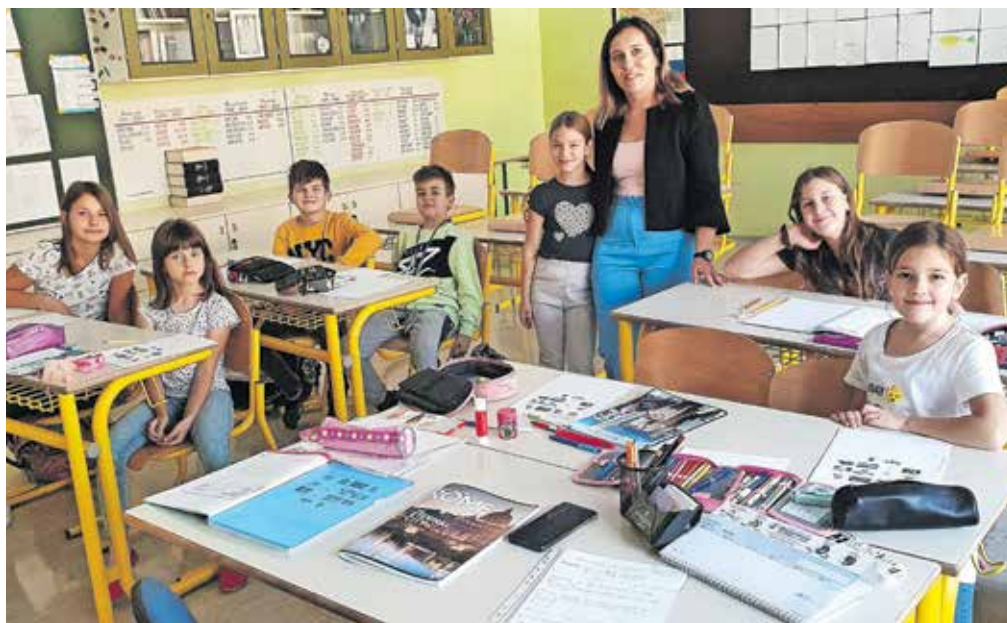
Utrinek z ure bosanskega jezika na Osnovni šoli Koroška Bela

Na šoli v septembru že vrsto let ob evropskem dnevu jezikov aktiv jezikov pripravlja pesniški recital, na katerem učenci recitirajo pesmi v svojih prvih jezikih ali jezikih, ki se jih učijo v šoli ali drugje.