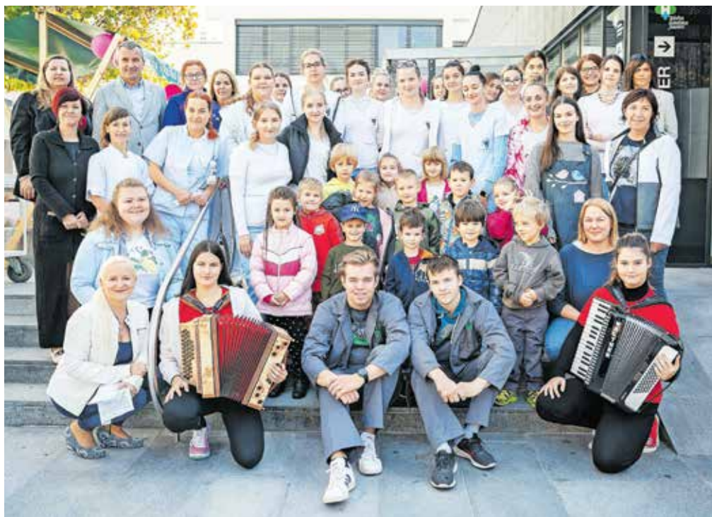
Skupaj za skrbno higieno rok ...

bolnišnice, ki so od dijakov, študentov in zdravstvenega osebja lahko izvedeli marsikaj o pomenu higiene rok, pod posebno napravo pa so tudi lahko preverili, kako (ne)temeljito so si razkužili roke. V dar pa so prejeli tudi razkužilo za roke.