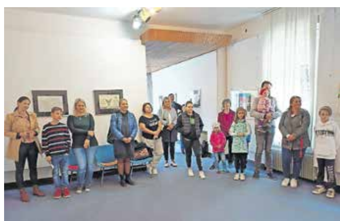
Z odprtja razstave v Doliku