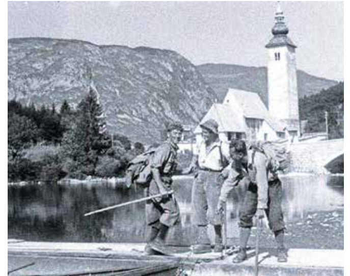
Svojo hribolazniško dogodivščino, ki razkriva številne lepote slovenskih gora, sklenejo v dolini na bohinjski strani.