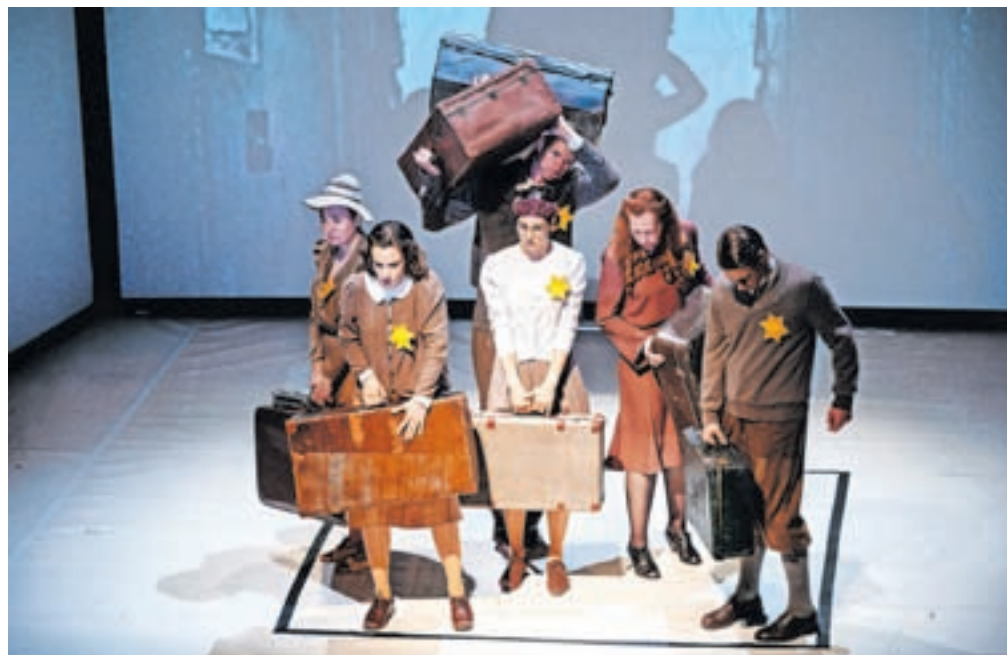
Odrska izvedba Dnevnika Ane Frank, ki so jo uprizorili igralci Mini teatra, nikogar ni pustila ravnodušnega.

Spomnil je na oborožen spopad Cankarjeve čete na Mežakli, na pomembno vlogo partizanske bolnišnice v bližini Zakopov in na osvoboditev delavskega taborišča Podmežakla. »Občina Jesenice vseskozi ohranja spoštljiv odnos do dogodkov preteklosti, saj je zelo pomembno, da častimo spomin na tiste, ki so osvobodili naše kraje,« je poudaril in pozornost namenil tudi trenutnim konfliktom v svetu. Kot je dejal, svet še vedno ni doumel, kako krhka sta mir in blagostanje ter kako hitro lahko zagorijo nova gorišča, za njimi pa ostajajo pogorišča, bolečina in osiromašnje. »Vojne na področju naše