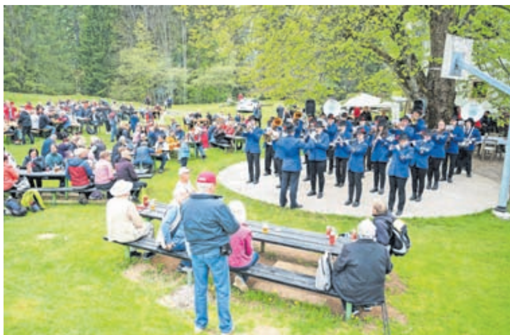
Tudi letos je Dom Pristava predstavljal zadnjo postajo prvomajske budnice Pihalnega orkestra Jesenice - Kranjska Gora.

za kakovost življenja pomembnejše primerno delovno okolje. Dovolj prostega časa za družino in prijatelje,« je med drugim poudarila Irena Joveva in dodala, da je ne glede na to, kam jo v življenju vodi poklicna pot, na j bo v Bruselj ali Ljubljano, ponosna, da prihaja iz jeseniške delavske družine.