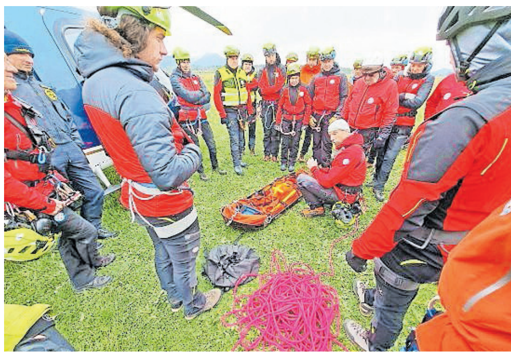
Jeseniški gorski reševalci letos praznujejo sto let organiziranega reševanja v gorah.