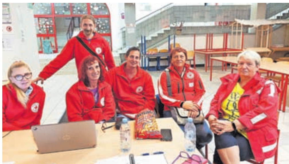
V lanskem letu se je združenje izkazalo tudi ob grožnji plazu nad Koroško Belo, saj so skrbeli za namestitve in oskrbo v evakuacijskem centru v Osnovni šoli Prežihovega Voranca, vključili pa so se tudi v zbiranje pomoči za prizadeve v poplavih.

V sklopu združenja imajo tudi skladišče za rabljenimi oblačili, za katero se res trudijo, da je urejeno in da imajo na voljo lepa, čista oblačila. »Prosimo, naj bodo oblačila, ki jih ljudje prinesejo, čista in nosljiva. Vsak-