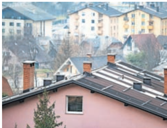
Bi bila rešitev, da bi distribucijo toplote v sistemu daljinskega ogrevanja spet prevzelo javno komunalno podjetje Jeko?

Skubic je na seji pojasnil podrobnosti, kako je bila oskrba z daljinskim ogrevanjem urejena pred sklenitvijo koncesije. Sprva je za oskrbo skrbel občina sama oz. z njo javno komunalno podjetje Jeko-IN. V letu 2013 so nato sprejeli odlok o koncesiji, ki je bil podlaga za kasnejšo sklenitev koncesije z družbo Enos, d. d., leta 2014. Skubic je nato izčrpno razložil, da je na podlagi prejete dokumentacije in podanih pojasnil Ob-