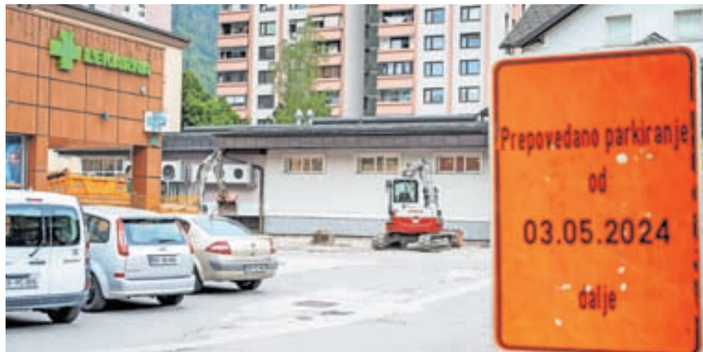
Območje med lekarno in trgovino, kjer so začeli urejati Trg prijateljstva

Občina Jesenice je začela izvedbo projekta Trg prijateljstva – Ureditev urbanih površin na Plavžu, s katerim bo preoblikovala središče Plavža v sodobno in prijetno okolje za srečevanje in druženje. Glavna značilnost prenove bo novo tlakovanje trga, poleg tega pa bodo prostor opremili z novo urbano opremo in kakovostno razsvetlavo, zasadili zelene površine ter postavili skulpturo prijateljstva. Kot so sporočili z občine, je cilj prenove ustvariti prijeten in prepoznaven ambient, ki bo prispeval k višji kakovosti življenja prebivalcev v tem delu Jesenic, vsi dostopi na trg pa bodo prilagojeni gibal-