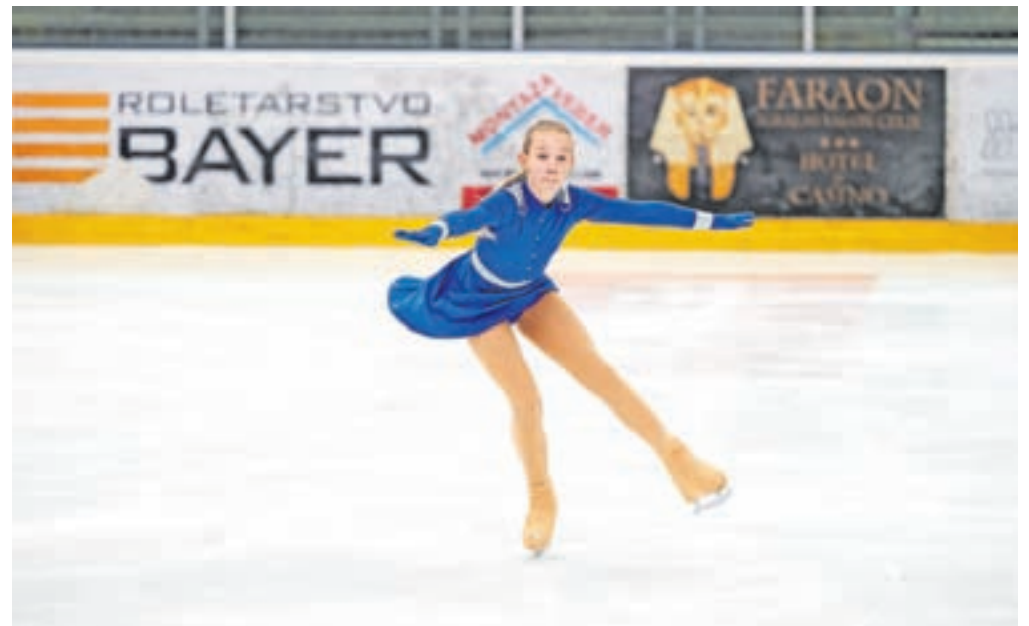
Jeseniški drsalci so ekipno postali tudi tretji najboljši klub med več kot stotimi konkurenti.