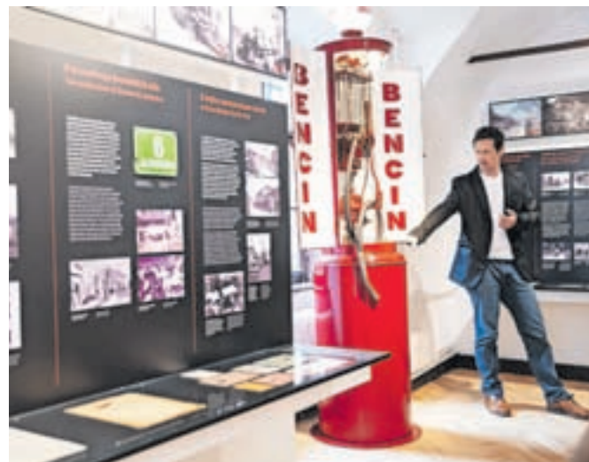
Prva jeseniška bencinska črpalka

ko so bile Jesenice najmlajše mesto v Kraljevini Jugoslaviji. Zajeta so obdobja razvoja na številnih področjih, urbanističnem, zdravstvenem, šolskem, kulturnem, športnem in drugih. Del razstave zajema najbolj mračno in težko obdobje druge svetovne vojne z bombardiranjem mesta 1. marca 1945 in povojno obnovo. Obnovljena zaporniška celica gestapa v Kosovi graščini je prežeta s pieteto do takratnih zapornikov. Vpeti so moderni pris-