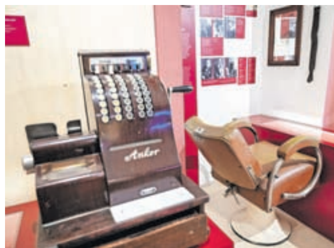
Blagajna in frizerski salon iz okrog leta 1930