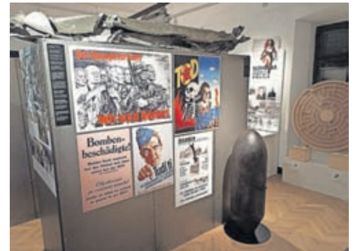
Na ogled je tudi ena od 94 bomb, ki so 1. marca 1945 razdejale mesto, in del krila bombnika, ki je strmoglavil na sedlo Suha.