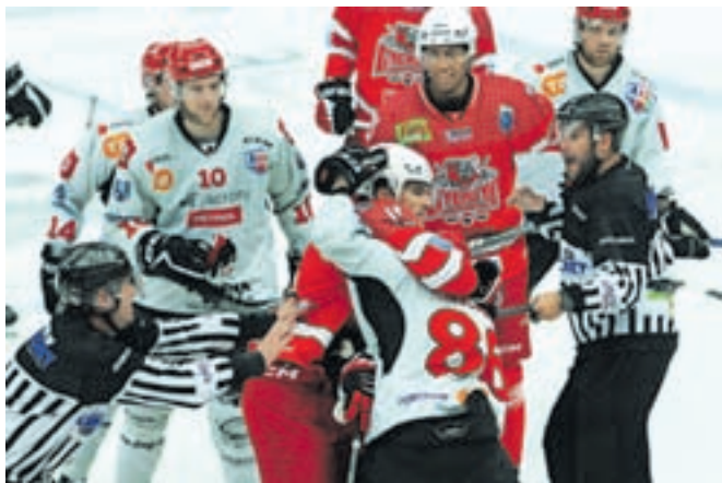
Za prijateljsko tekmo je bilo v obeh ekipah čutiti kar nekaj noveze in tudi boksarskih vložkov ni manjkalo.

Jeseničane čaka dolga sezona. Nastopili bodo v državnem prvenstvu, Celinskem pokalu in v Alpski ligi.