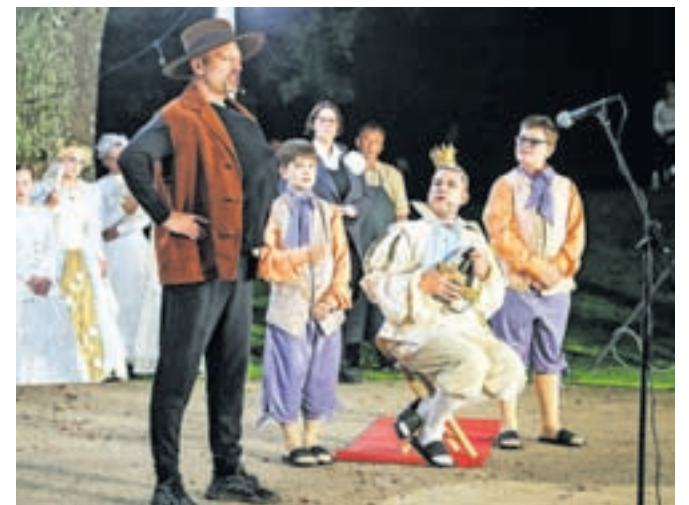
Martin Krpan na prostem pred Domom Pristava