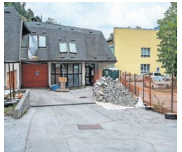
Dela bodo predvidoma zaključena v začetku leta 2025.

Občino Jesenice. Prenova bo omogočila ustanovitev novega Centra za krepitev zdravja in Centra za duševno zdravje odraslih, ki bosta nudila preventivne zdravstvene programe. Energetska sanacija stavbe bo izboljšala rabo energije, zmanjšala porabo in tekoče stroške.