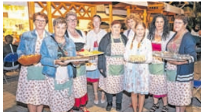
Manjkalo ni niti dobre hrane, ki so jo pripravile podeželske ženske.

vo, ki je po besedah Andreja Palovšnika resnično mozaik spomina.