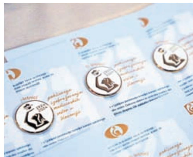
Jubilejne značke so ob stoletnici poklicnega izobraževanja medicinskih sester v Sloveniji prejeli vsi dijaki, ki so zaključili izobraževanje na srednjih zdravstvenih šolah.