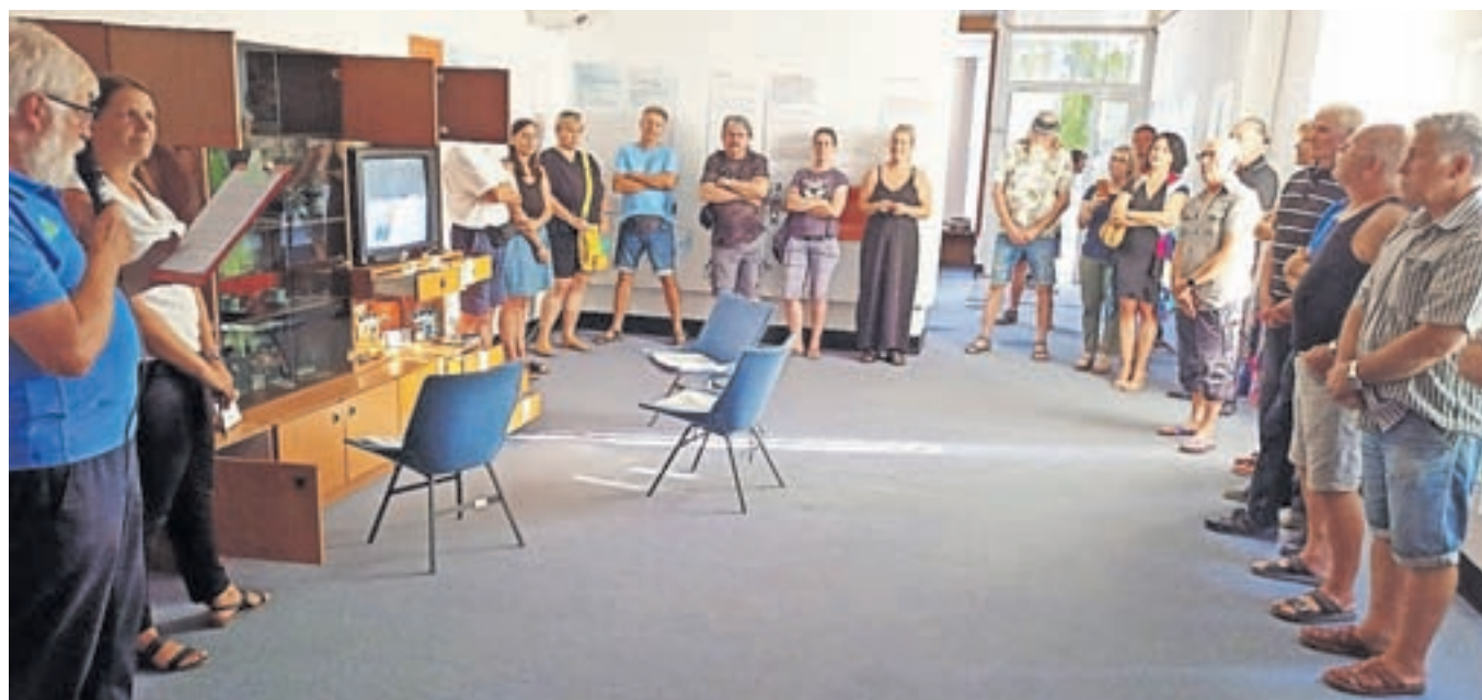
Z odprtja razstave, ki bo v Doliku na ogled do 10. septembra

Olimpijskega komiteja Slovenije na Jesenicah Brane Jeršin predvsem poudaril vlogo tekmovalcev, hokejskih sodnikov in številnih sodelavcev v tehničnih službah z Jesenic in celotne