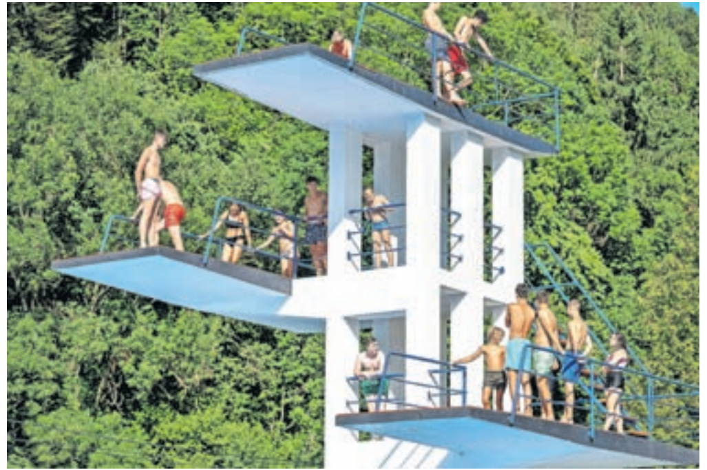
Desetmetrski skakalni stolp, edini še delujoč v državi, je odprt med 11. in 18. uro, za red in varnost na njem skrbi reditelj.

Za parkiranje obiskovalcev so tudi letos poskrbeli tako, da so uvedli enosmerni promet na cesti proti banki in omogočili parkiranje ob levem robniku, v dogovoru z Osnovno šolo Prežihovega