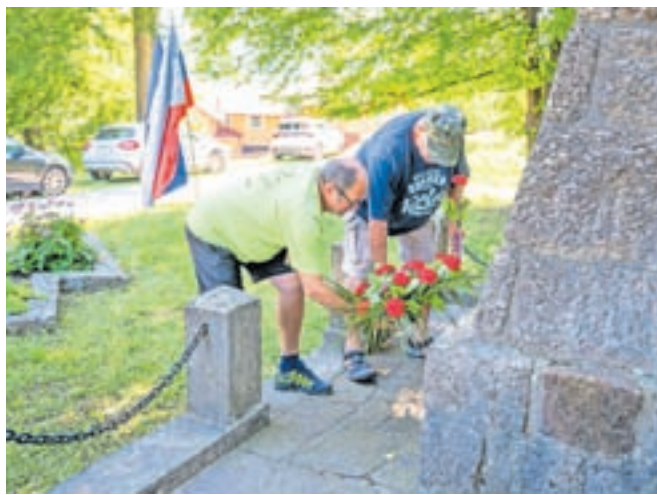
Ob prazniku so položili cvetje k spomeniku padlim borcem, talcem in žrtvam fašističnega nasilja.

»Člani Sveta KS smo v preteklem obdobju kar nekaj pozornosti posvetili prometni varnosti skozi Podmežaklo, pogosteje kot prej so se pojavljale prometne nesreče, več je poškodovanih ograj, zato smo po proučitvi različnih predlogov sprejeli sklep, da Svetu za preventivo in varnost v cestnem prometu predlagamo omejitev hitrosti na 40 kilometrov na uro skozi celotno Podmežaklo.« Srečanje se je nadaljevalo s športnimi in družabnimi igrami.