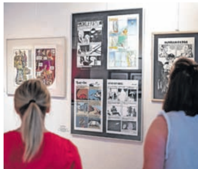
Stripi, grafike, fotografije, skulpture, risbe in še marsikaj drugega je na ogled v muzeju Kosova graščina.