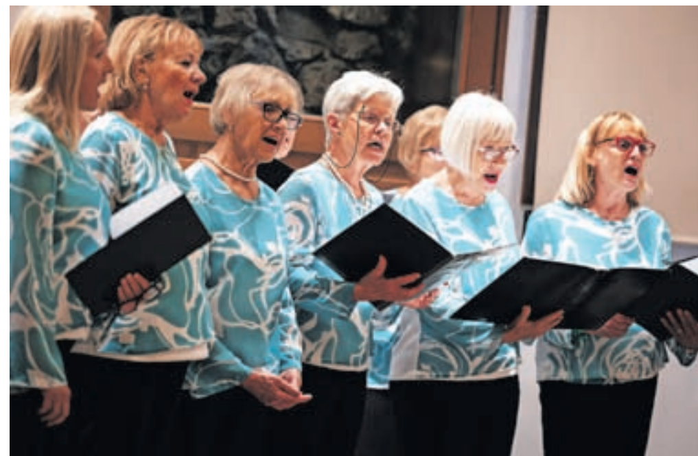
S pesmijo so za prijetno vzdušje poskrbele članice ženske vokalne skupine Zimzelen iz Nove Gorice.