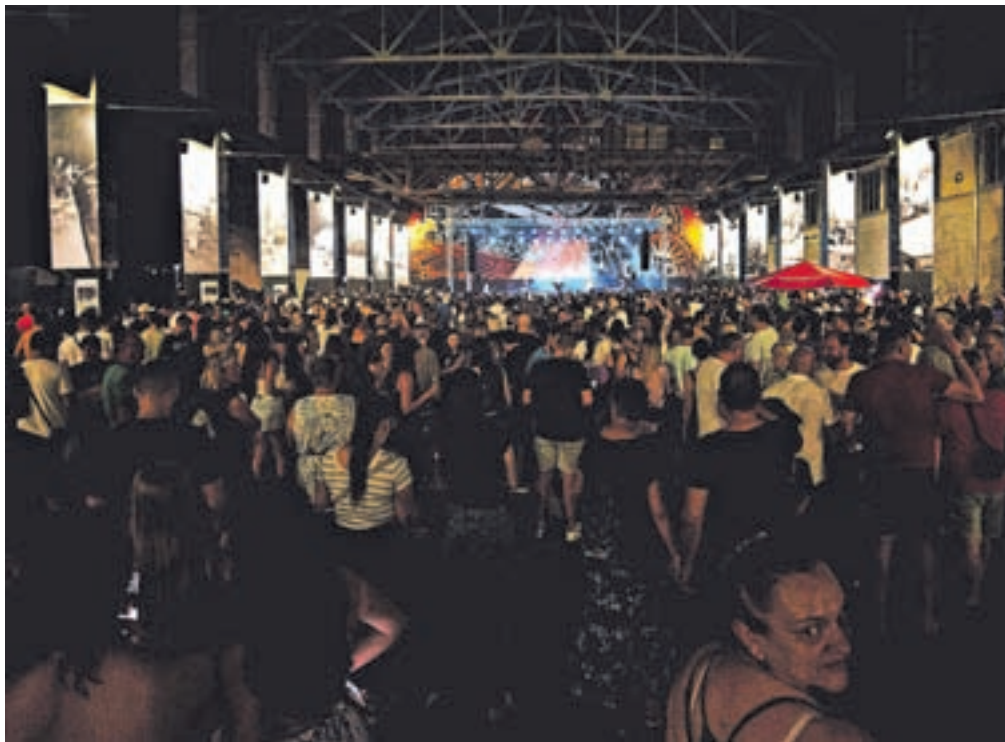
Vrhunec poletnega dogajanja so trije koncerti v muzeju na prostem na Stari Savi. Nastopila sta že skupini Hari Mata Hari in Crvena jabuka, 30. avgusta pa prihaja še hrvaška izvajalka Lidija Bačić.

In čeprav se počitnice počasi zaključujejo, pestrega jeseniškega poletja nikakor še ni konec. Tako se bo do konca avgusta in tudi še v začetku septembra zvrstilo še več dogodkov. V petek, 23. avgusta, ob 21. uri bo na Čufarjevem trgu