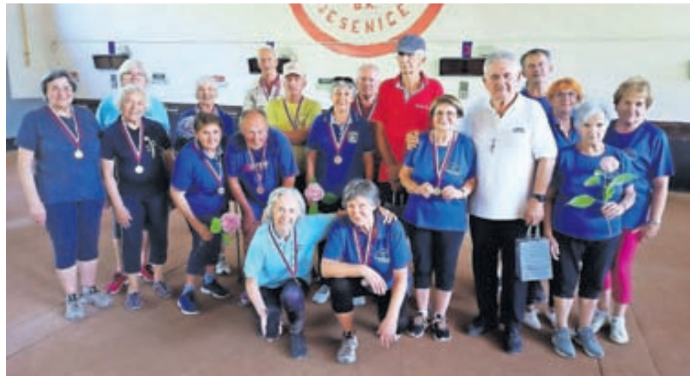
Najboljše ekipe avgustovskega turnirja