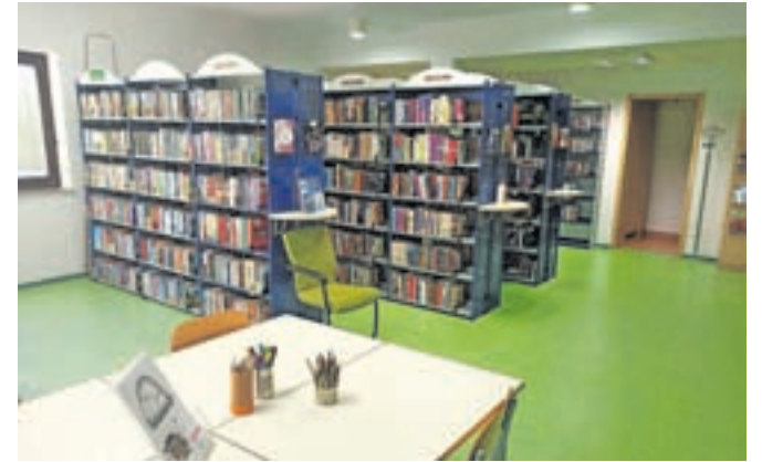
Knjižnica na Hrušici je odprta ob torkih in četrtek od 14. do 19. ure.

Knjižnica na Hrušici je od 9. julija v novih prostorih. Selitev je bila potrebna zaradi širitve vrtca v stavbi kulturnega doma. Nova lokacija knjižnice je še vedno v stavbi kulturnega doma, v prvem nadstropju prizidka. Vodstvo Občinske knjižnice Jesenice je z novimi prostori zadovoljno, saj omogočajo preglednejšo izbiro knjižnega gradiva, posebno sobo ima otroški oddelek, škoda je le, da so zdaj prostori težje dostopni gibalno oviranim osebam. Da bi privabili še več bralcev, si v knjižnici prizadevajo stalno dopolnjevati izbor knjig z novostmi, ki so za bralce še posebno privlačne. V novih prostorih je na voljo tudi čitalnica, kjer lahko obiskovalci prebirajo revije.