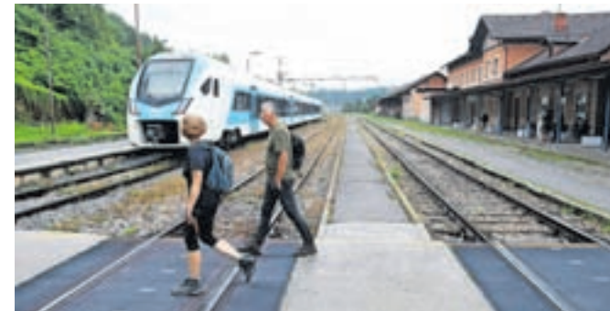
V soboto in nedeljo bo tudi med Kranjem in Jesenicami organiziran nadomestni avtobusni prevoz.

Potnikom so vse informacije na voljo na spletni strani Slovenskih železnic ter na brezplačni telefonski številki 080 81 11.