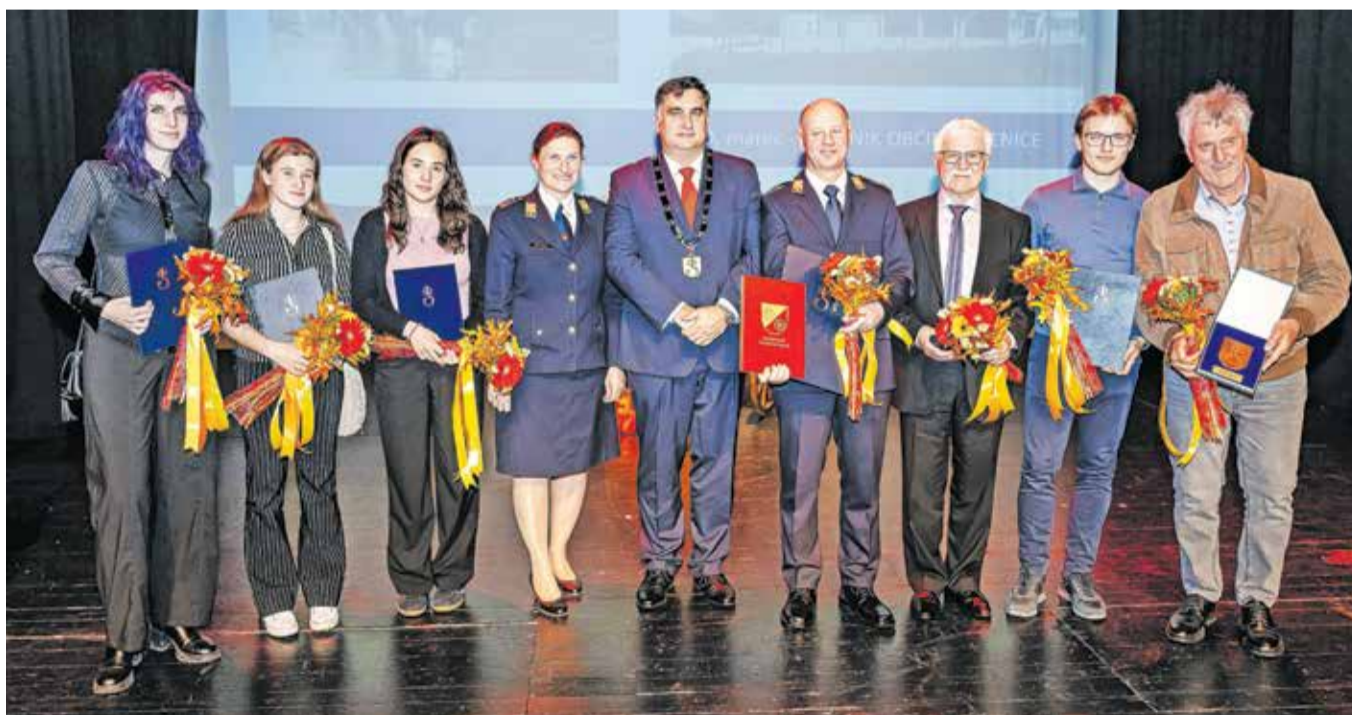
Letošnji občinski nagrajenci z županom