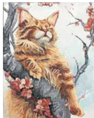
Tehnika akril, avtorica je stara 14 let.