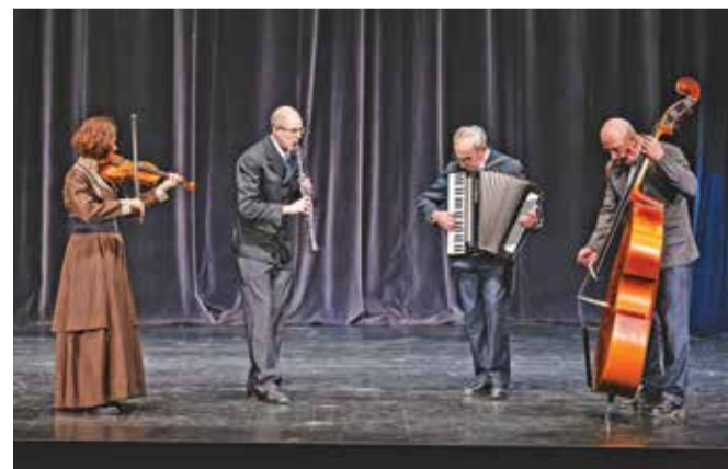
Ljudski godci Suhe hruške

V Kulturnem domu na Slovenskem Javorniku je potekalo območno srečanje folklornih skupin in poustvarjalcev glasbenega izročila 2025. Predstavili so se: Otroška folklorna skupina Drobilčki, Pevska skupina Juliana, Ljudski pevci iz pod Stola, poustvarjalci glasbenega izročila Suhe hruške in Folklorna skupina Juliana. Srečanje, ki nosi ime K'e ste deklič, da b' rajal fantič, je organizirala jeseniška območna izpostava JSKD.