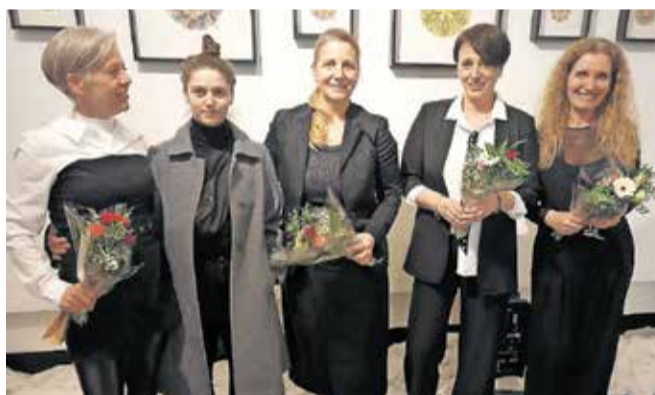
Umetnice, ki razstavljajo v Doliku