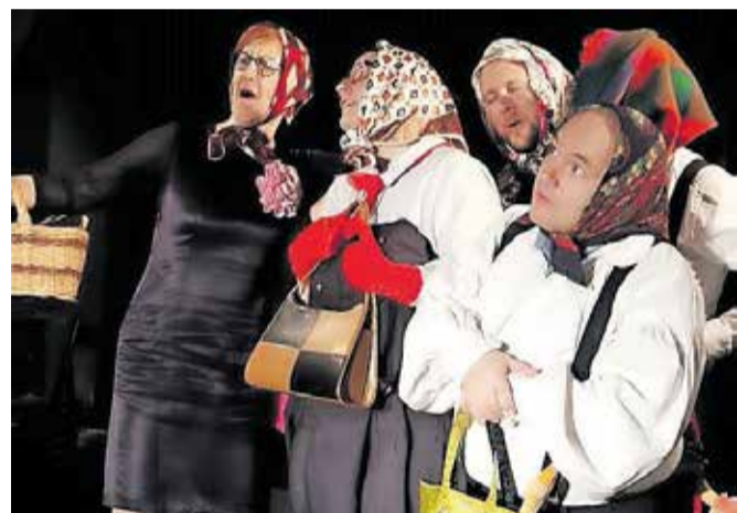
Teater, prof. je igralska skupina profesorjev gimnazije, ki brez težav sprejema salve smeha dijakov ob humornih delih svojih predstav.