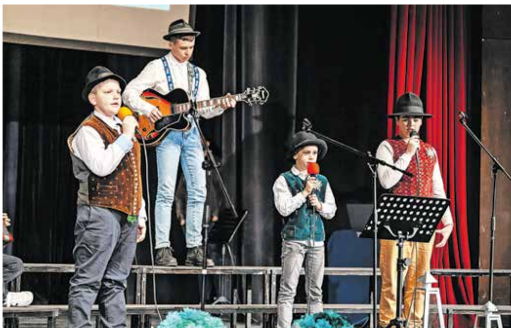
Šolska skupina Mali kaos: v njem so tako učenci kot učiteljice.