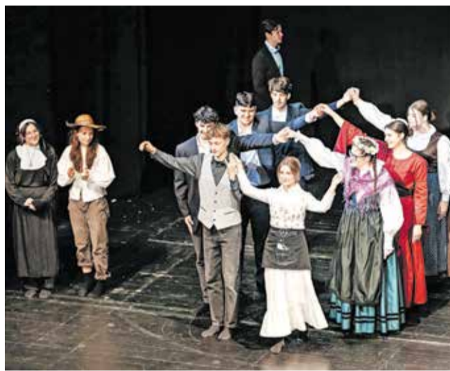
Na festivalu so se letos predstavili štirje razredi, Klasiki iz 3. a so uprizorili predstavo Matiček se ženi.

»Dramski festival je čudovit rezultat dobrega meseca gledališkega ustvarjanja, ko je vsa šola dihala z gledališčem. Dijaki so porabili vse proste ure in odmore, da so prirejali dramska besedila, ustvarjali vloge, vadili. Imeli