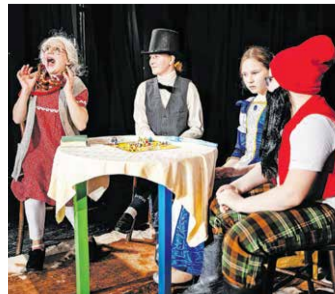
Mladi igralci so kot stranski liki reševali volka iz pravljice o Rdeči kapici, ki pa je na koncu pokazal, da »volk dlako menja, nravi pa nikoli«.