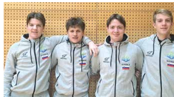
V mladinski reprezentanci v floorballu U19, ki odhaja na svetovno prvenstvo, so tudi štirje igralci iz jeseniške občine.