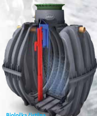
Biološka čistilna naprava one2clean

Čistilne naprave za vaš dom, vikend, podjetje ali naselje Sistemi za zbiranje deževnice - pametna rešitev za trajnostno rabo vode Kakovostne komponente in hitra dostava. Povožni rezervoarji do 12.5 T.