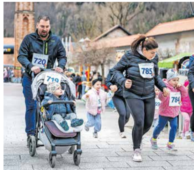
V uvodnem teku Teci svoj krog so bili zmagovalci vsi, ki so pretekli vsaj en krog. Tek se je udeležilo 520 mladih tekačev.