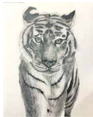
Tehnika svinčnik, avtorica je stara 14 let.