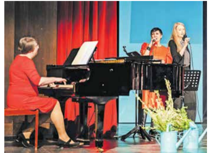
Zapele in zaigrale so tudi učiteljice.