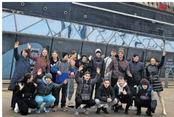
Jeseniški učenci na potepanju po Londonu

pot nadaljevali proti nogometnemu stadionu Wembley, kjer so se celo usedli na tribuno za kraljevo družino. Zadnji dan potovanja so se odpeljali še v mesto Brighton.