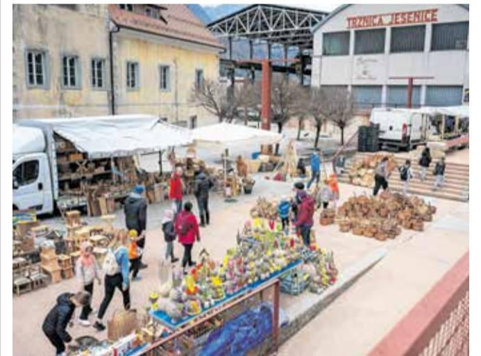
Več kot trideset razstavljalcev je na stojnicah ponujalo različne izdelke.