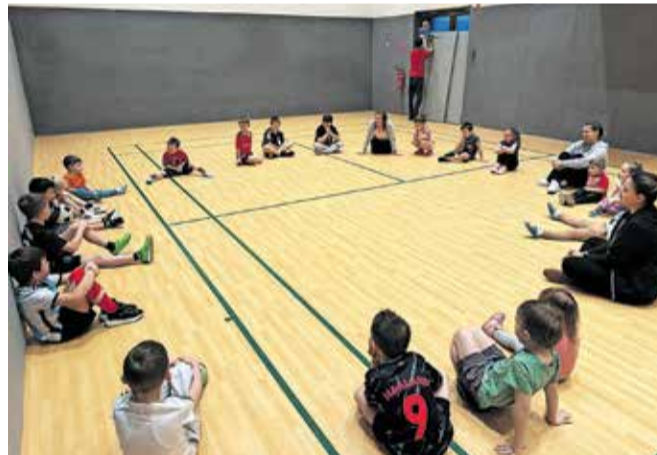
Na dosedanjih srečanjih so igrali nogomet, floorball, plesali, se smejali, na koncu pa sklenili še krog prijateljstva.