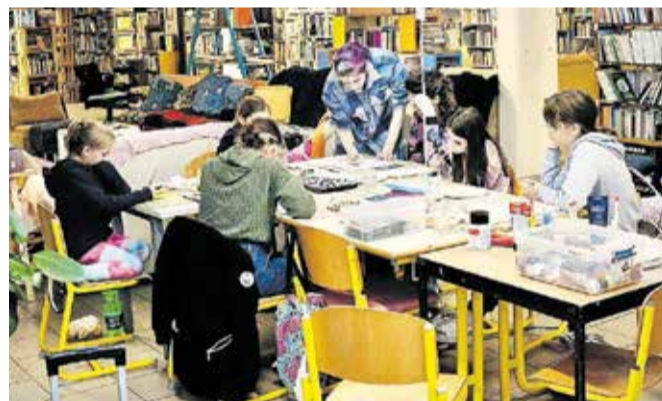
Na Jesenicah slikarska šola deluje v prostorih Hiše srečevanj.

Šola je namenjena ljudem vseh starosti, od otrok do upokojencev, traja deset mesecev, vpisi pa potekajo čez celo leto. Vsako leto pripravljajo tudi poletne slikarske kolonije za otroke, slikarske vikend odmike za odrasle, po šolah pa brezplačne triurne likovne delavnice.