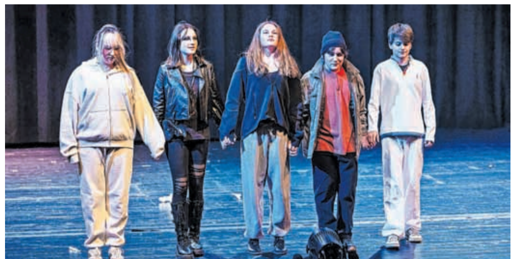
Igralci v predstavi Čez črto