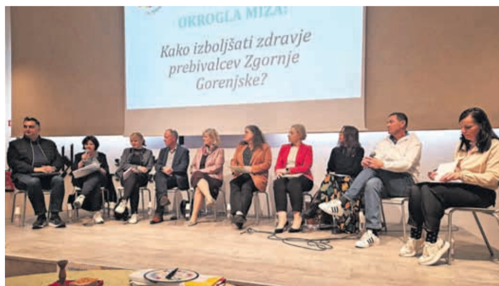
Okrogla miza o tem, kako izboljšati zdravje prebivalcev Zgornje Gorenjske

»Malo za šalo, malo zares bi kot družinska zdravnica res lahko na recept predpisovala tudi gibanje, nekateri to že imajo, saj je pomembno, da se več gibamo, da gremo vsak dan za eno uro ven, ob hitri hoji se zbistri tudi glava.«