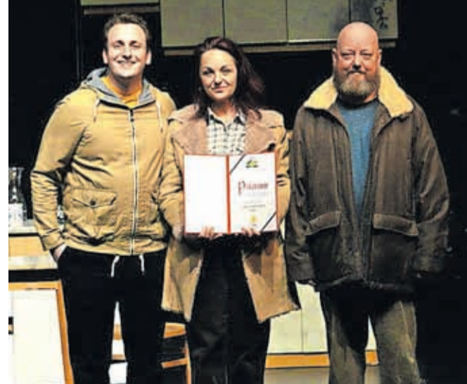
Ker se igralci niso mogli udeležiti podelitve v Pekrah, so jim priznanje izročili v domači dvorani na Jesenicah po izvedbi predstave, ki je bila tokrat dobrodelna.