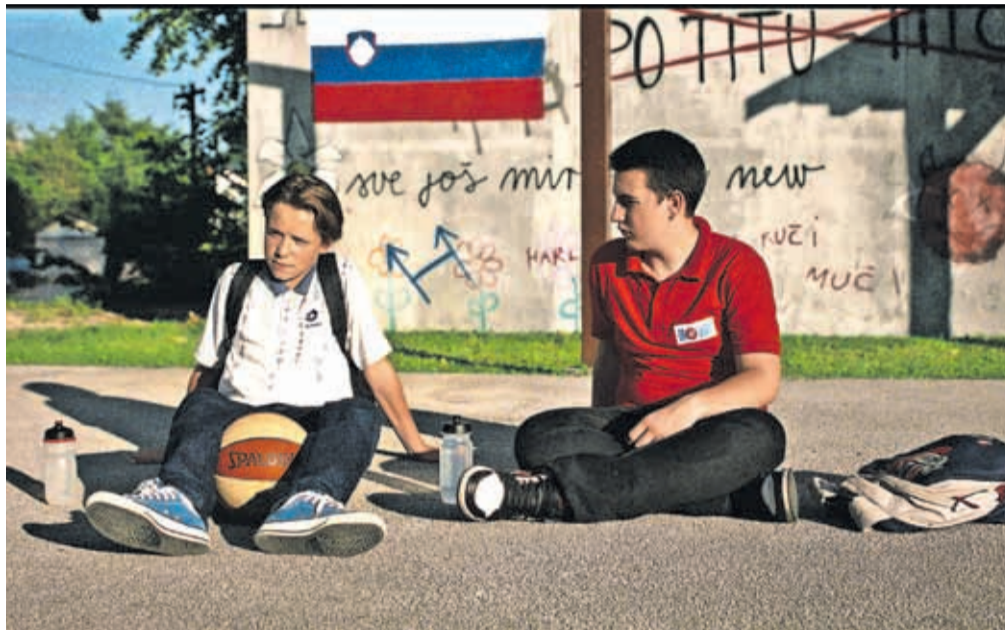
Prizor iz filma: Samir s prijateljem Zoranom