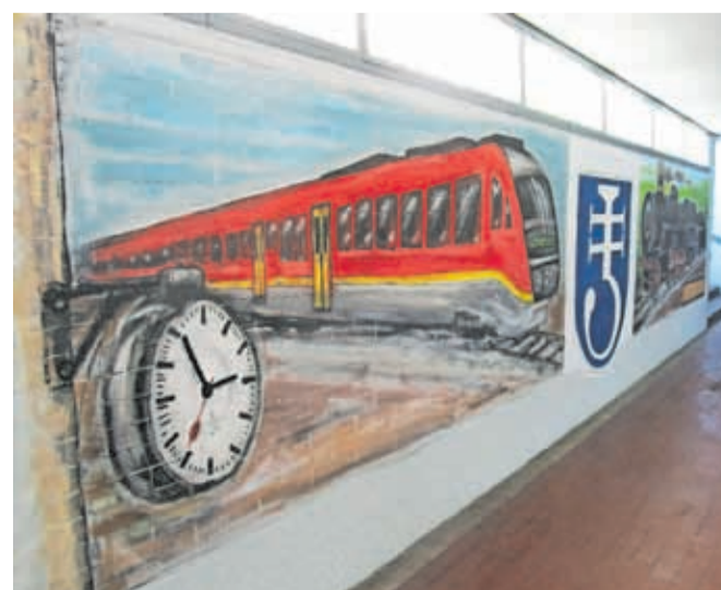
Murali v podhodu so nastali leta 2013, izdelali so jih prostovoljci in umetnica Saša Vrečko.

V podjetju Slovenske železnice – Infrastruktura so odgovorili, da se je septembra 2025 začela izvedba