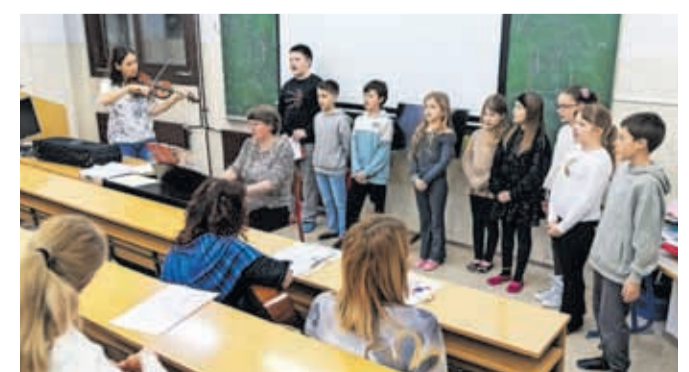
Na pomladni koncert se pripravlja tudi šolska skupina Mali kaos.