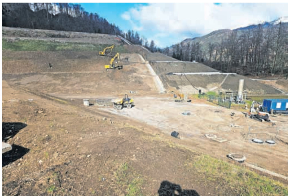
Gradbena dela na deponiji Mala Mežakla