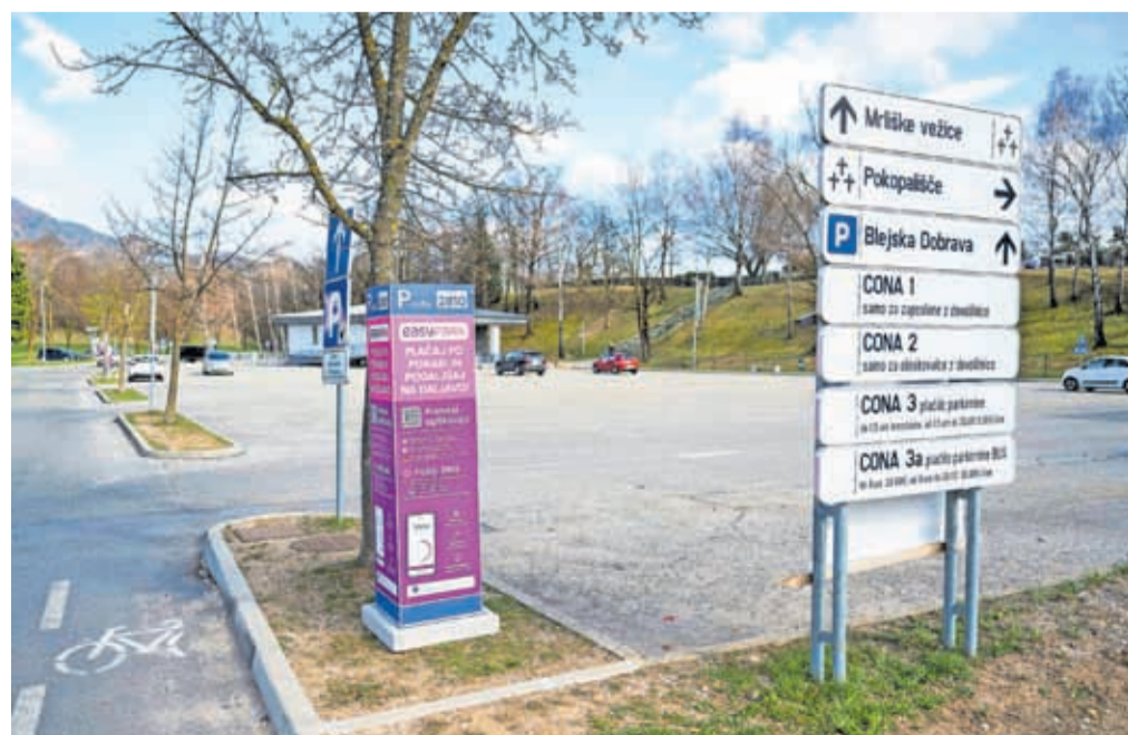
Na parkirišču pri pokopališču na Blejski Dobravi so odslej nameščeni parkomati sistema EasyPark. Plačilo z gotovino ali kartico ni več mogoče.

fon, na voljo je brezplačno v mobilni trgovini Google Play ali Apple. Dodati je treba svojo telefonsko številko, registrsko tablico in način plačila. Ko parkiramo, odpremo aplikacijo na telefonu, ki samodejno najde lo-