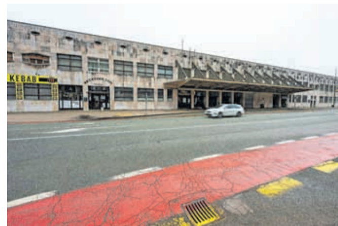
Od 1. junija naprej bo avtobusno postajališče pri železniški postaji začasno zaprto.

Avtobusno postajališče pri železniški postaji Jesenice začasno ne bo v uporabi zaradi del v sklopu projekta Nadgradnja železniškega vozlišča Jesenice. Sprememba bo veljala od 1. junija do 31. avgusta 2026. V tem času bo mogoče uporabljati najbližji sosednji avtobusni postajališči. U. P.