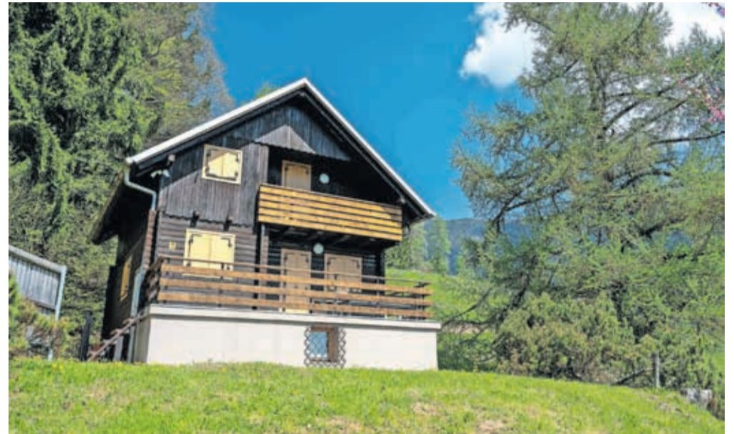
Kurirčkov dom: občina bo objavila namero o sklenitvi neposredne pogodbe za oddajo v najem.

V Neodvisni listi Za boljše Jesenice so postavili vprašanje o tem, kaj se dogaja s Kurirčkovim domom na Pristavi: »Po vseh finančnih vlaganjih (ne majhnih) v objekt in dejavnost, ki naj bi obogatila turistično ponudbo, nas upravičeno zanima, kaj imamo od tega.«