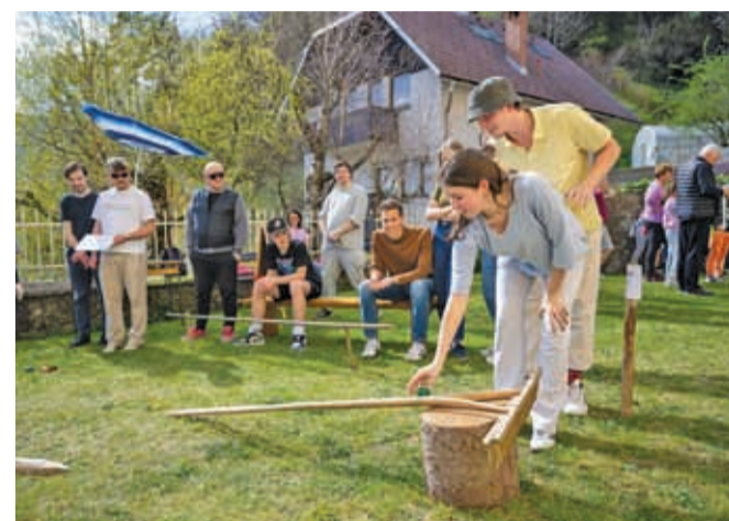
Na dveh »pirhodromih« se je pomerilo 43 tekmovalcev, starih od dva pa vse do 62 let.

Na Koroški Beli na velikonočni ponedeljek vsako leto obudijo star slovenski običaj pirhanja, ko se v zabavnem tekmovanju pomerijo tako najmlajši kot odrasli. Osrednji dogodek je bilo takalučanje (znano tudi kot trkljanje ali valičanje) pirhov. Na dveh »pirhodromih« se je pomerilo 43 tekmovalcev, starih od dva pa vse do 62 let. Dogodek je presegel lokalne okvire, saj so udeleženci prišli od blizu in daleč – iz Rateč, Domžal, Ljubljane in celo Cerknice. Mednarodni priidih pa sta dogodku dala celo gosta iz Anglije. Na koncu so razglasili najboljše, nagrade pa so dobili vsi sodelujoči. U. P.