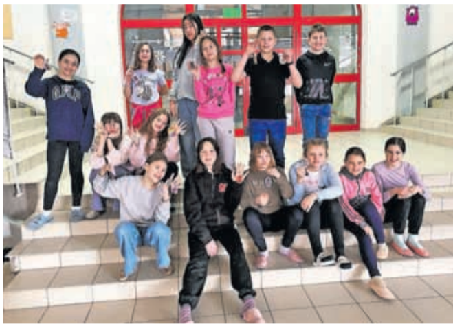
Učenci, ki so sodelovali na Andersenovem večeru branja v šoli, so zavzeti bralci.

Učenci, ki so med prvimi opravili bralno značko, so se za nagrado lahko udeležili Andersenovega večera branja in prespali v šoli.