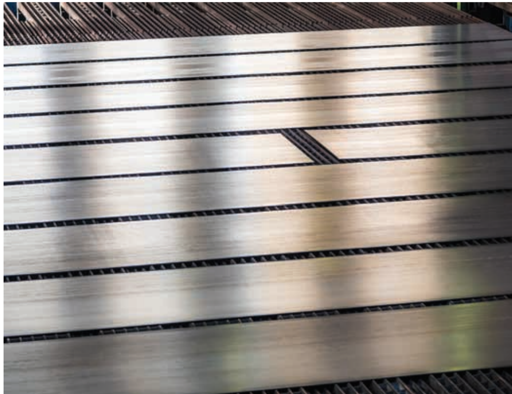
Jeklo za vesolje / FOTO: DOBRAN LAZNIK

Slovensko jeklo bo prvič postalo del vesoljskega plovila. Izdelujejo ga v Skupini SIJ, doslej so ga naročniku – njegovega imena za zdaj ne smejo razkriti – dobavili že več kot petsto ton. Razvoj tega posebnega jekla je potekal pod vodstvom projektne pisarne za razvojno-raziskovalne projekte na Skupini SIJ in v sodelovanju razvojnih ekip družb SIJ Metal Ravne in SIJ Acroni. Sodelovali so tudi z Inštitutom za ko-