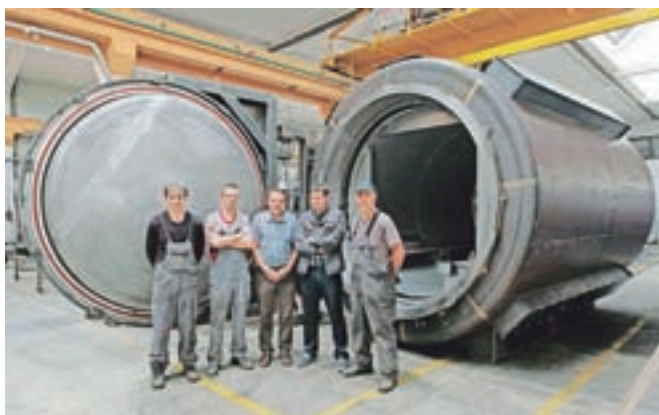
Petnajst ton težko peč za predelavo rude za ruskega kupca so morali izdelati v samo petih tednih.

Na osnovi izkušenj in znanja pa so pred kratkim pri-