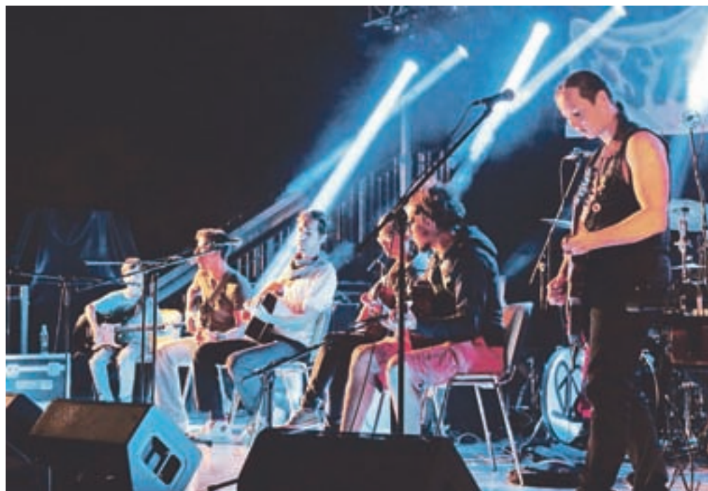
Jeseniški kitarski orkester