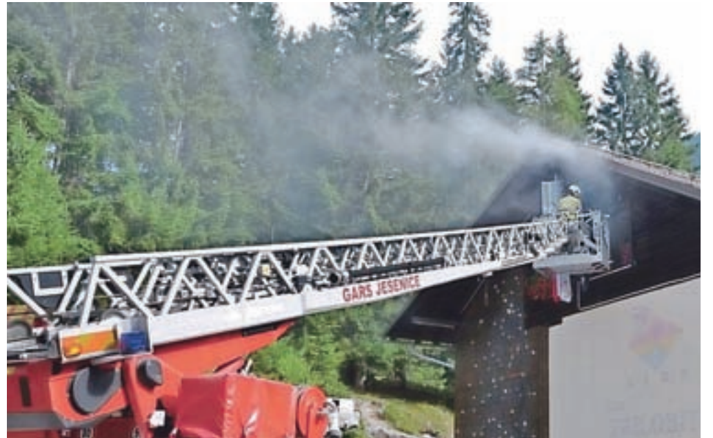
V gasilski vaji so prikazali reševanje otrok iz goreče stavbe z avtolestvijo.