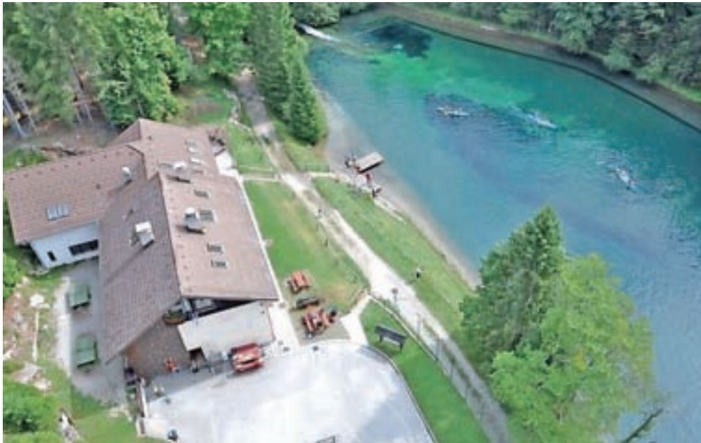
Panoramski posnetek doma Trilobit s čudovito okolico

fosilov, tudi trilobita, po katerem nosi ime dom. Trilobit je namreč trokrpar, izumrli morski členonožec, katerega ostanke so našli prav v tem delu Karavank.