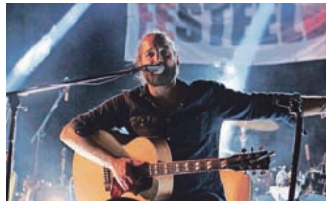
Hamo & Tribute 2 Love