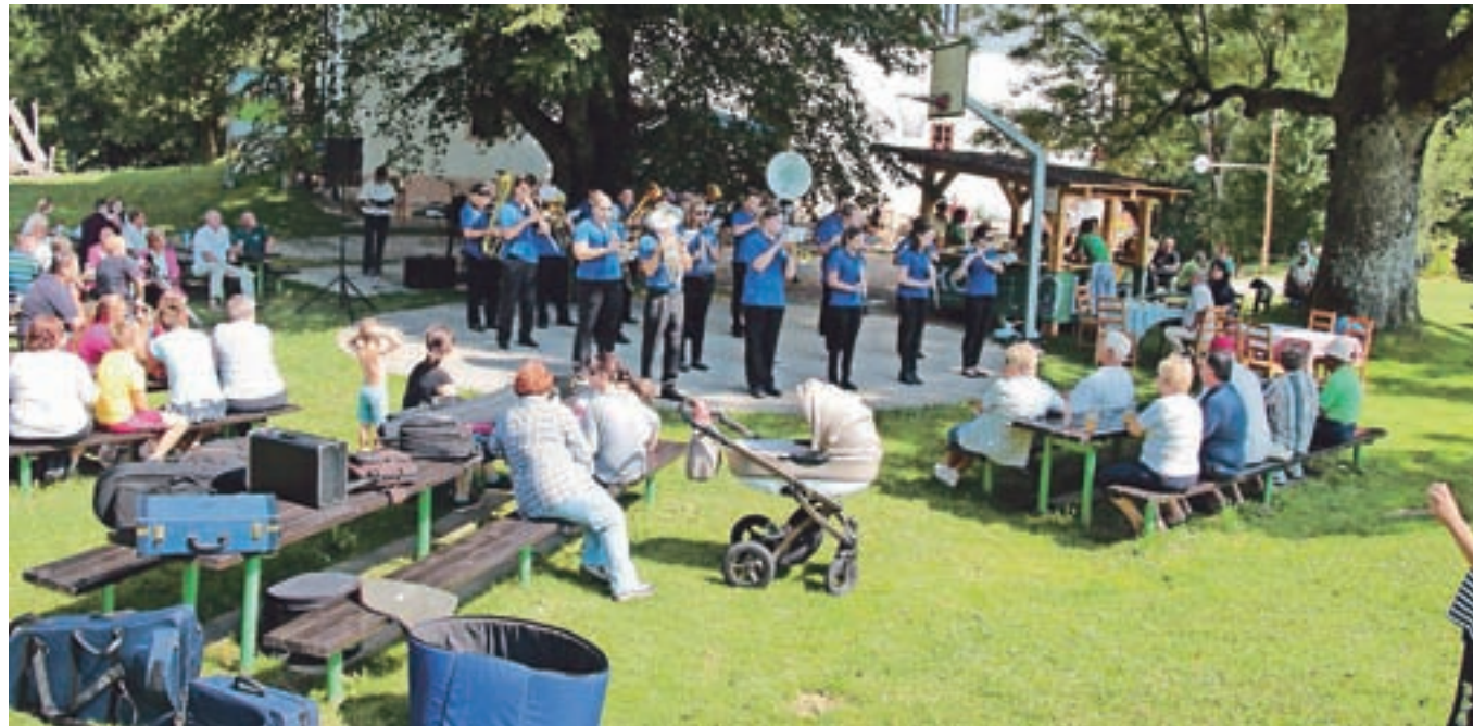
Osrednjega praznika Krajevne skupnosti Slovenski Javornik - Koroška Bela se je udeležilo lepo število krajanov.