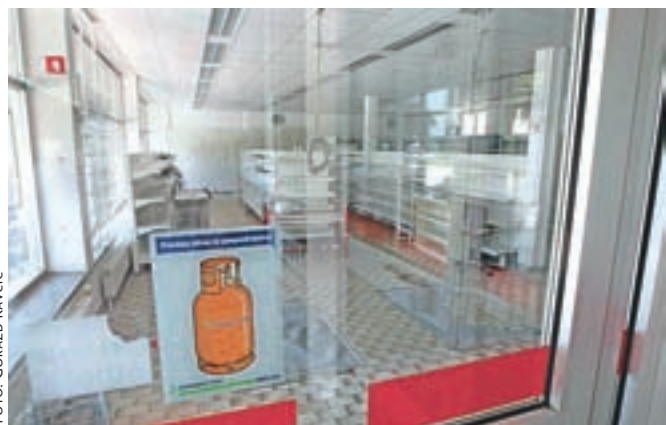
Mercator bo lokal oddal za kakšno drugo dejavnost.