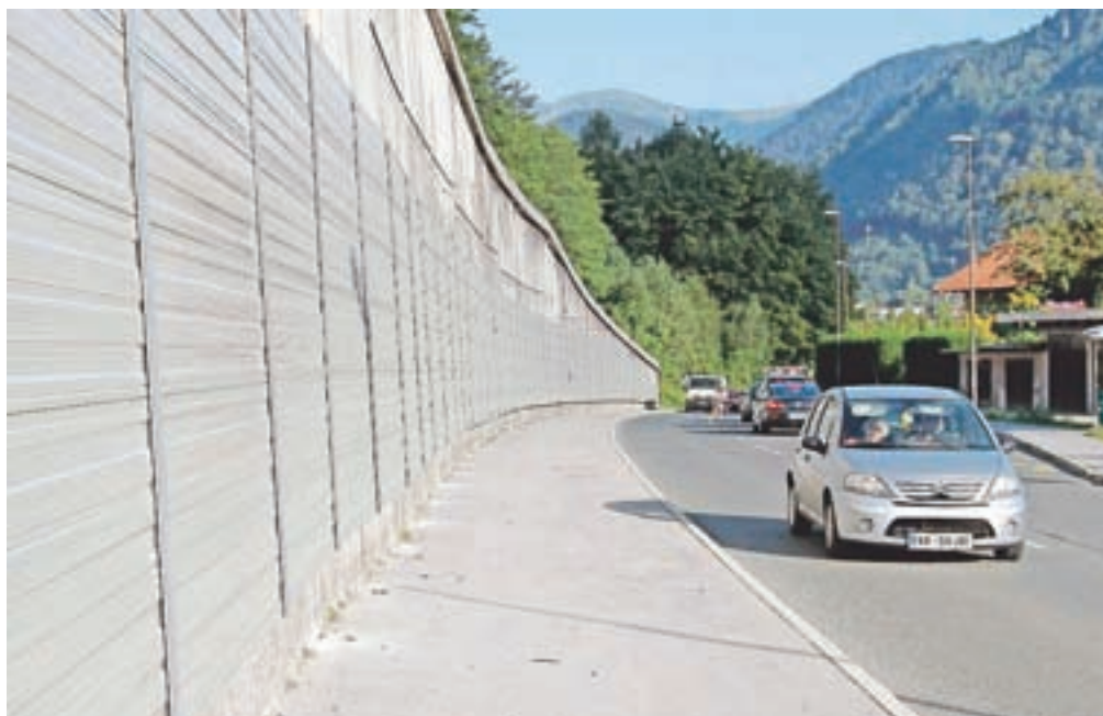
Država je vendarle uredila protihrupno zaščito na opornem zidu pri naselju Lipce. Od betonskega zidu se je namreč hrup prometa odbijal in se še okreplil.