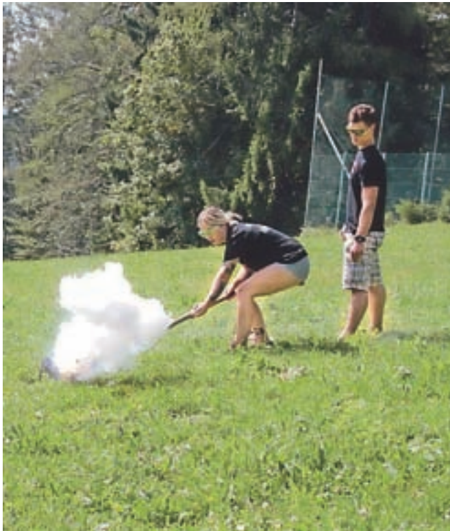
Za bobnenje so poskrbeli člani Kulturnega društva Možnar.