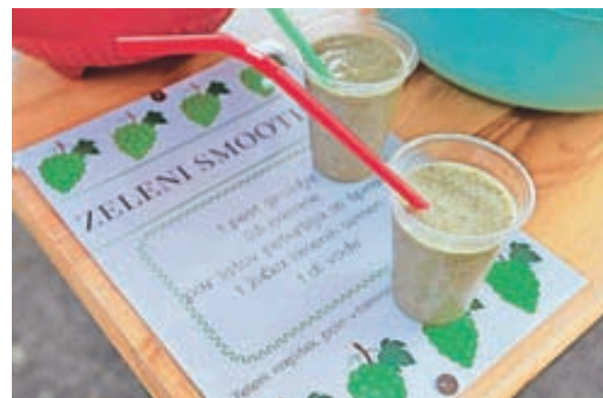
Zeleni napitek, poln vitaminov

nam recept za zeleni smuti. Zanj so uporabile pest belega grozdja, pol banane, pest špinače, žlico lanenih semen in deciliter vode ter vse skupaj zmešale v mešalniku. Na zdravje!