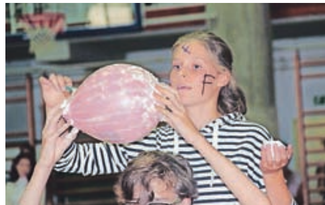
Črka F za "fazane" ...