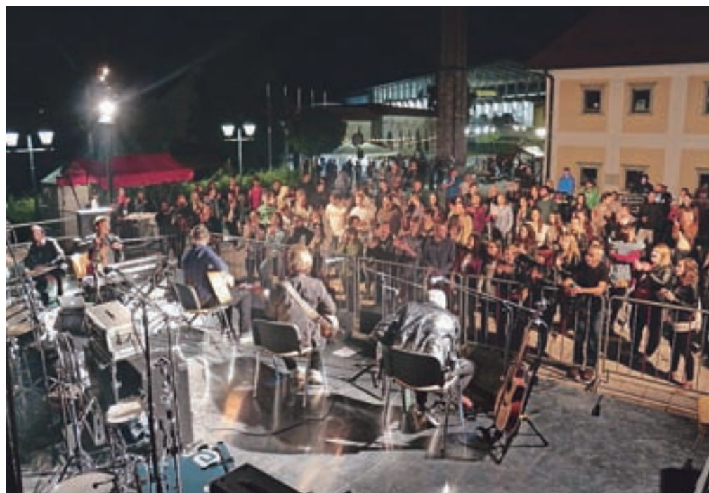
Vrhunec FeSteelvala je bila sobotna rokersko-bluzovska poslastica.