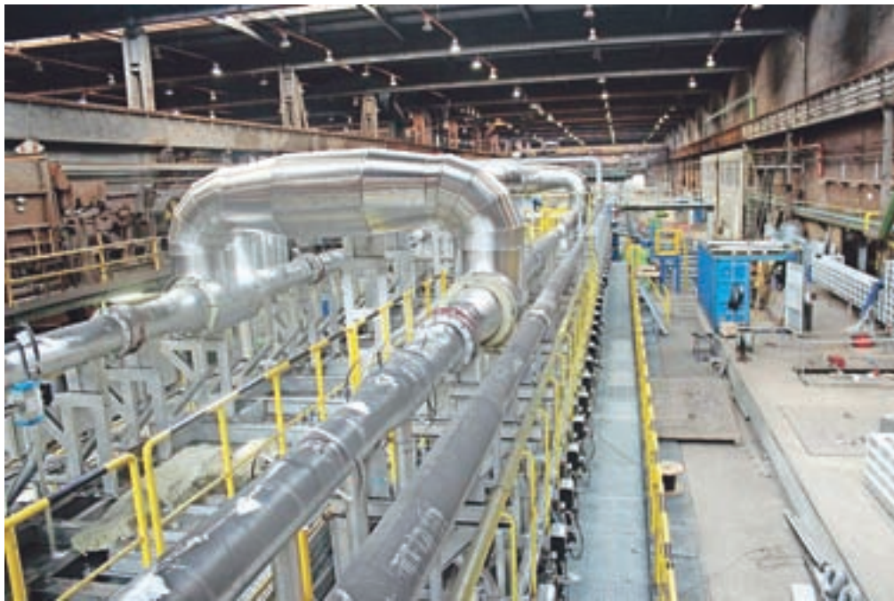
Nova linija za toplotno obdelavo specialnih plošč debele pločevine

Poslovanje družbe SIJ Acroni v letu 2016 je pozitivno in stabilno ter v skladu s sprejetimi poslovnimi načrti, so povedali.