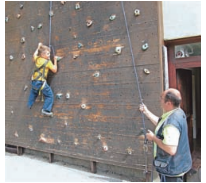
Otroci so se lahko preizkusili v streljanju z loki in v plezanju na zunanji umetni steni.

domu je devet zaposlenih, od tega štirje učitelji, ki si prizadevajo, da so programi šol v naravi in drugih dejavnosti čim bolj zanimivi in poučni. Veliko pozornosti namenjajo prav geologiji, saj je območje Zahodnih Karavank bogato z najdbami