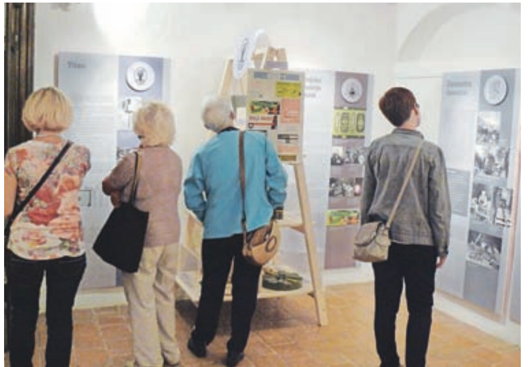
Razstava v Kosovi graščini je na ogled do 10. oktobra.