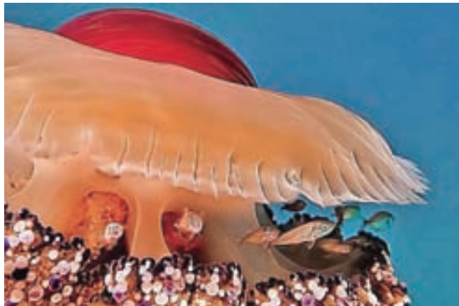
Ribice v meduzinem zavetju

vske nazive podeljuje glede na število fotografij, sprejetih na PSA-razstavah. "Pridobivanje PSA-nazivov je težka naloga, saj so med več tisoč fotografijami na eni razstavi sprejete samo res dobre. Sprejemi na razstavah pa vsakemu fotografu dajejo tudi povratne informacije o kvaliteti njegovih fotografij," je povedal Bricelj, ki je za pridobitev naziva Mojster PSA potreboval kar 1500 sprejetih fotografij. To je eden od vrhuncev njegovega fotografskega ustvarjanja, ki se je začelo že v otroštvu, ko je kot petletni deček z maminim fotoaparatom napravil prvo fotografijo, doma v kuhinji je namreč fotografiral brata. S fotografijo se ukvarja vse odtlej, svoj prvi fotoaparatom je dobil v osnovni šoli, začel je s črno-belo fotografijo in slike sam razvijal doma, sledilo je obdobje diapozitivov, leta 2004 pa je prešel na digitalno fotografijo. In kateri motivi ga pri fotografiranju