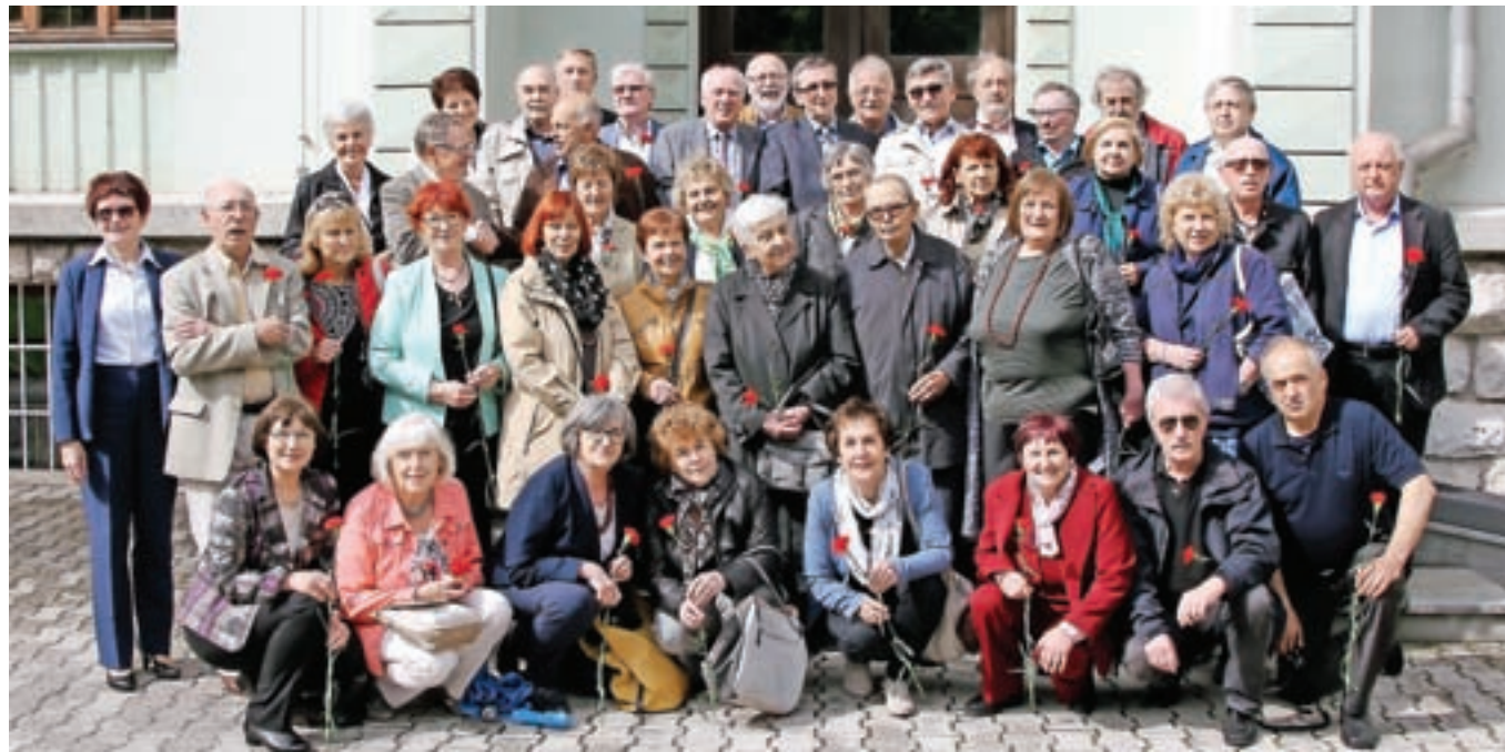
Udeleženci srečanja nekdanjih gimnazijcev, ki so maturirali pred petdesetimi leti.

"Srečanja maturantov sem se udeležil z velikim veseljem, zlasti še, ker je matura zame predstavljala tudi konec bivanja na Jesenicah. Toliko čudovitih doživetij bi lahko opisal v obdobju do mojega devetnaj-