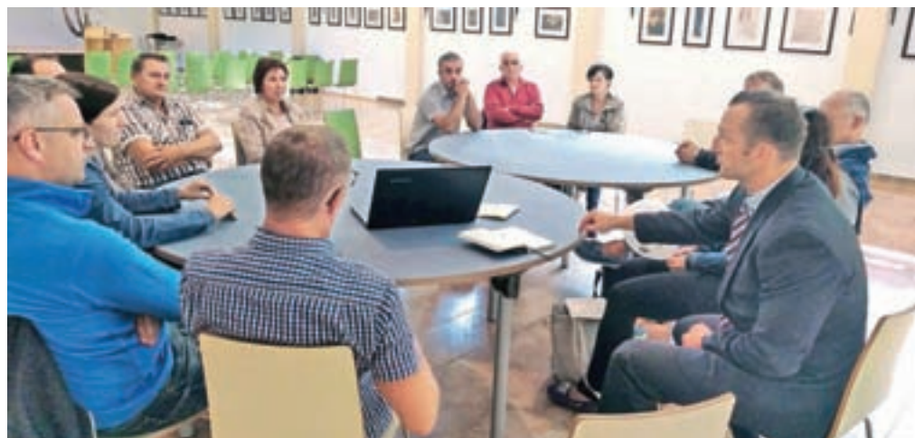
Izvedli so štiri javne razprave, več delavnic, dve anketni raziskavi, trideset intervjujev in nagradno žrebanje za sodelujoče v anketi.

Pet ključnih področij ukrepanja oziroma tako imenovane prometne stebre, ki so trajnostno načrtovanje, hoja, kolesarjenje, javni potniški promet in motorni promet, pa bomo podrobneje predstavili v naslednji številki.