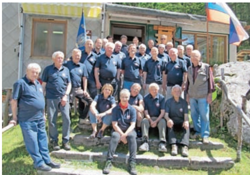
Zaslužni člani PD Javornik pred kočjo v Krmi