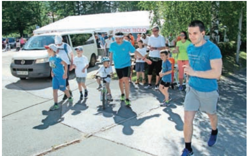
Letos je teklo kar 497 tekačev vseh starosti.