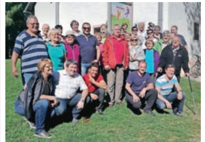
Udeleženci iger na Pristavi