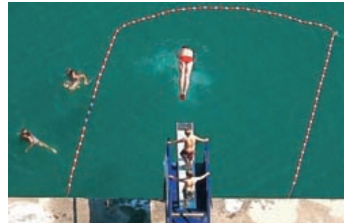
Skok v vodo (objavljena v reviji National Geographic)

Je edini Slovenec, ki objavlja v reviji PSA Journal, za enega večjih uspehov pa si šteje, da je bila njegova fotografija kopalcev v Blejskem jezeru objavljena v reviji National Geographic.