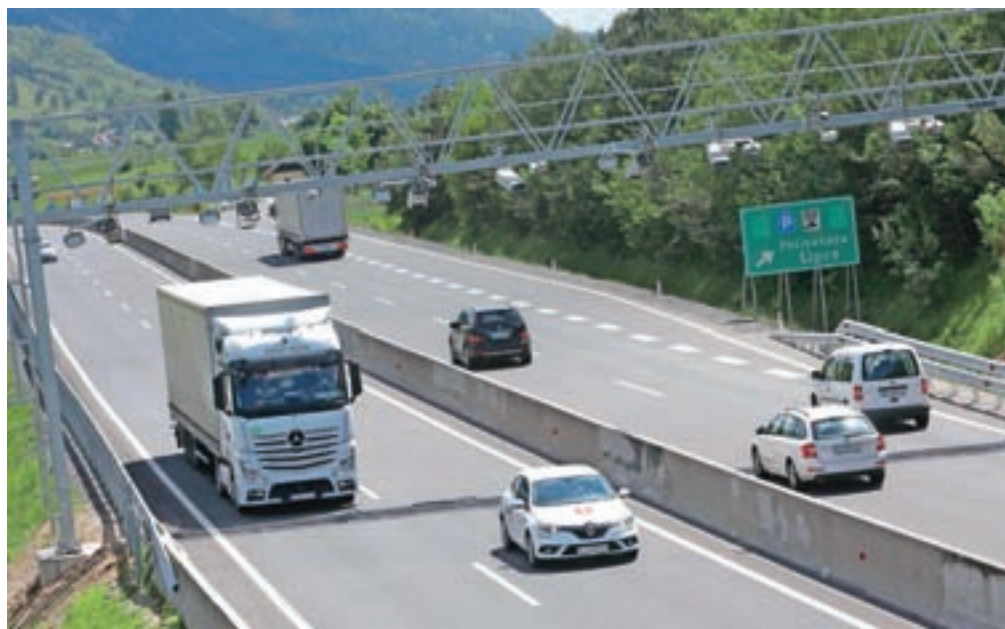
Nadzorni portal nad avtocesto pri počivališču Lipce bo namenjen elektronskemu cestninjenju težkih vozil.

Vozniki, ki se vozijo po gorenjski avtocesti med Leskami in Jesenicami, so pri počivališču Lipce pred kratkim opazili novo postavljen portal nad avtocesto. Gre za nadzorni portal, ki bo namenjen elektronskemu cestninjenju težkih vozil z največjo dovoljeno maso nad 3500 kg oziroma vseh nevinjetnih vozil. Kot pojasnjujejo v Družbi za avtoceste v Republiki Sloveniji (DARS), bodo postavili 126 fiksnih cestninskih portalov nad avtocestami in hitrimi cestami, ki bodo uporabljali tako imenovano DSRC (Dedicated Short Range Communication) tehnologijo. Omenjena tehnologija bo omogočala brezžično komunikacijo med vozilom in obcestno napravo. Od začetka prihodnjega leta bodo cestnino od tovornjakov, avtobusov in vseh drugih nevinjetnih vozil, kot načrtujejo, začeli zbirati v prostem prometnem toku.