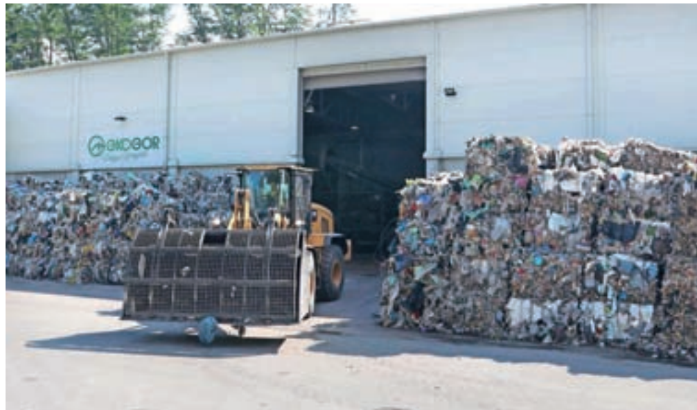
Pri obratu za mehansko-biološko obdelavo odpadkov v CERU Mala Mežakla na predelavo čaka še kar nekaj odpadkov.

Prav tako z deponije še niso odpeljali nobene pošiljke odpadkov tako imenovane »lahke frakcije« v sežig v Avstrijo. Izvozno dovoljenje za izvoz odpadkov na termično