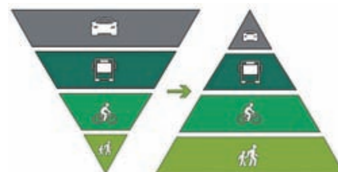
Bistvo razvoja trajnostne urbane mobilnosti: v ospredju je človek, ne avtomobil.

Za doseganje javnega konsenza pred sprejetjem CPS za občino Jesenice je bil predlog CPS s pozivom občanom za podajo mnenj na voljo na spletni strani Občine Jesenice, Občinski svet pa ga je v dveh obravnavah