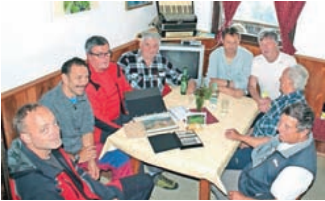
Razstavo so odprli ustvarjalci in staroste Planinskega društva Jesenice.

Planinci so v Koči na Golici odprli dokumentarno razstavo o bogati zgodovini ene najbolj obiskanih slovenskih planinskih koč.