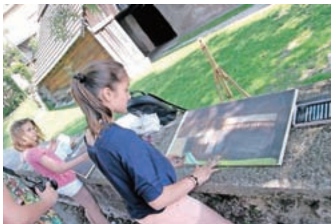
Otroci so motive za ustvarjanje iskali po Koroški Beli.