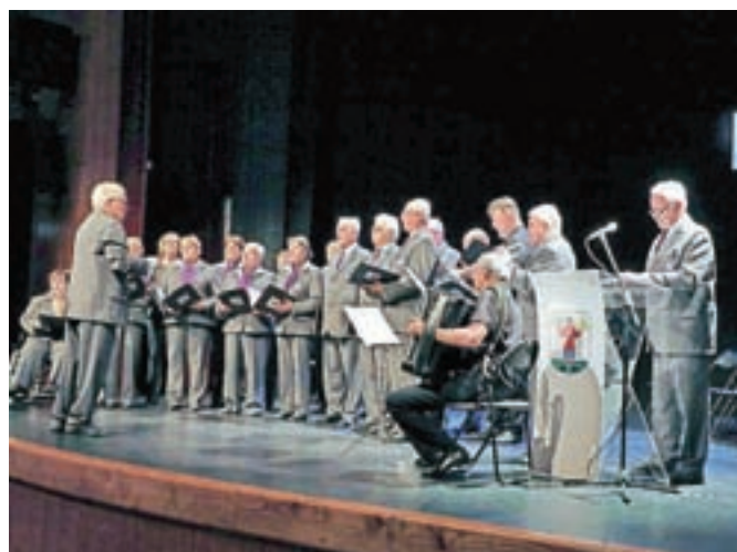
Nastopil je tudi veteranski pevski zbor.