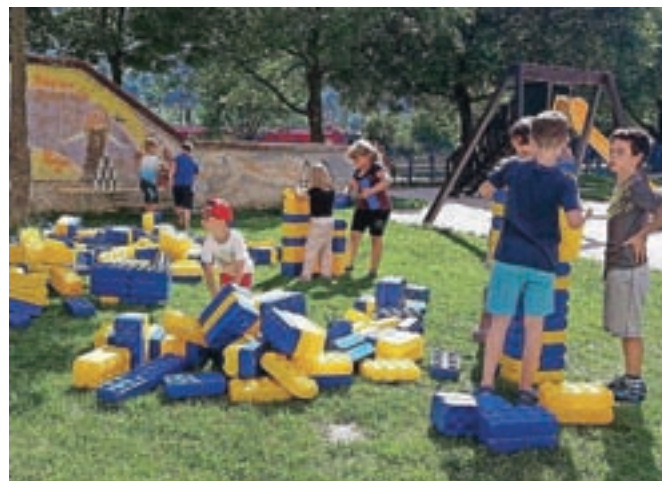
Julijsko športno-zabavno popoldne v soseski Center II

Da otrokom v času poletnih počitnic ni dolgčas, skrbijo tudi v Mladinskem centru Jesenice. Pestro je tako v Centru II kot v prostorih mladinskega centra in na bazenu Ukova. Poletno ustvarjanje, športne in družabne igre, foto stojnica, cirkuška šola – dogajalo se bo vse do konca počitnic, več informacij je na voljo na spletni strani centra.