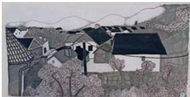
S Torkarjevo plaketo nagrajena slika Maje Zupan