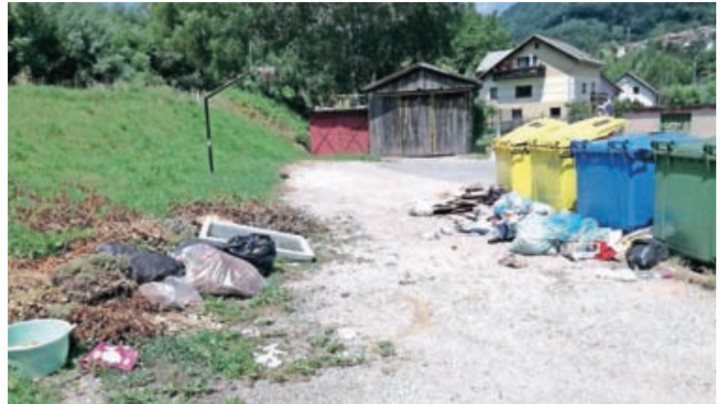
Na eko otoke sodijo le papir, embalaža in steklo ...