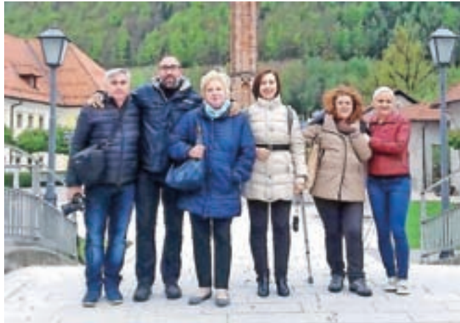
Španski učitelji na obisku na Jesenicah

Tri učiteljice Srednje šole Jesenice so gostovale v Sevilji, štiri učitelji iz Španije pa so spoznavali delo jeseniške šole.