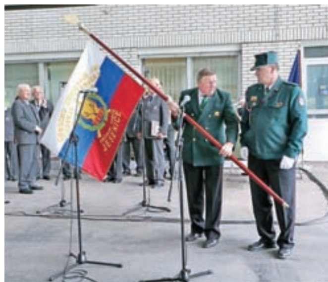
Razvitje prapora občinskega odbora veteranov vojne za Slovenijo

ne milice s platoja. S slovesnostjo pa počastijo tudi dan državnosti. Slavnostna govornica bi morala biti ministrica za delo ANJA KOPAČ MRAK, a se zaradi drugih obveznosti dogodka ni