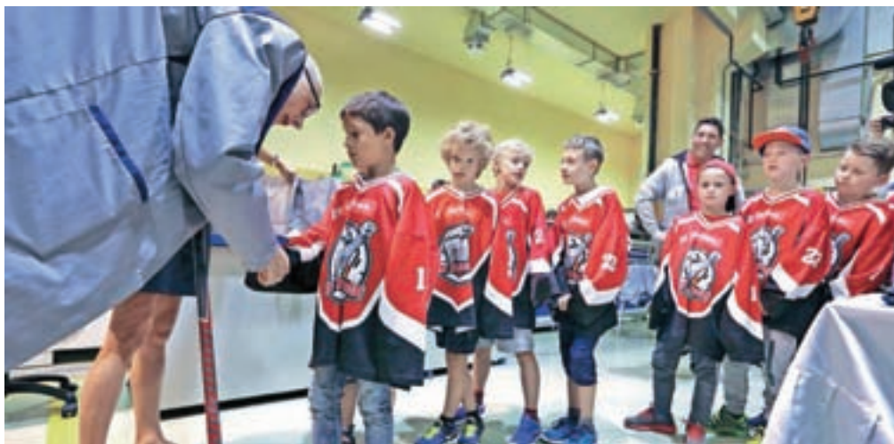
Mladim jeseniškim hokejistom so podarili kompozitne hokejske palice, športne majice in kape.

ma kluboma – HD Jesenice in HDD Jesenice – so podpisali pismo o nameri za podporo Hidrie jeseniškemu hokeju. Pri tem pa ne bo šlo za klasično sponzorstvo, temveč hokejistom ponujajo