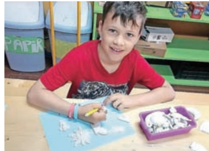
Poletno ustvarjanje / BESEDILO: URŠA PERNELN