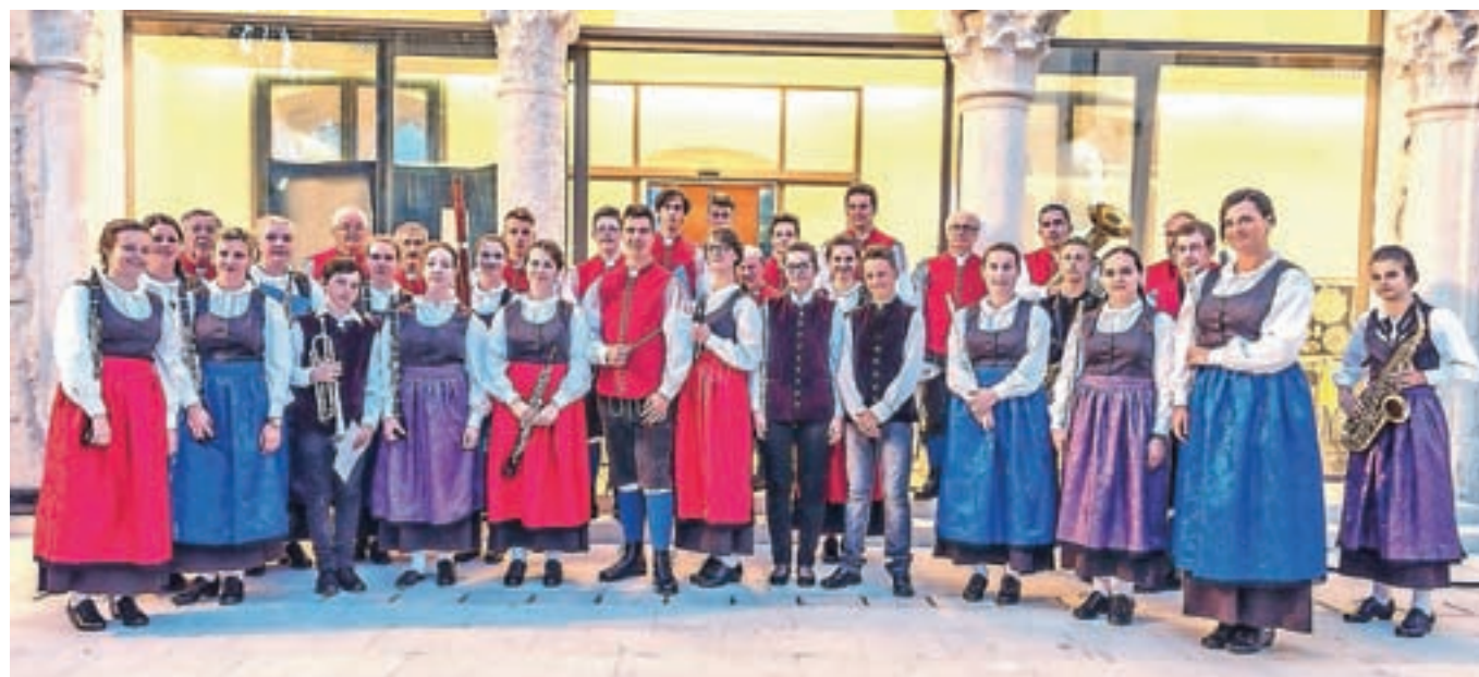
Pihalni orkester Jesenice - Kranjska Gora v novih rateških nošah

Kranjski Gori in na Jesenicah. Tudi mladi Štajerci so se odeli v slovenske noše. V resnici je bil Slovenski večer tridimenzionalen: za uho, oko in celo okus! Namreč, Slovenija je imela na Pagu tudi svojo stojnico, s katere so bile slovenske