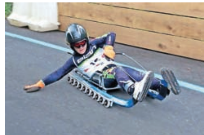
Jeseniški sankalci poleti ne počivajo.