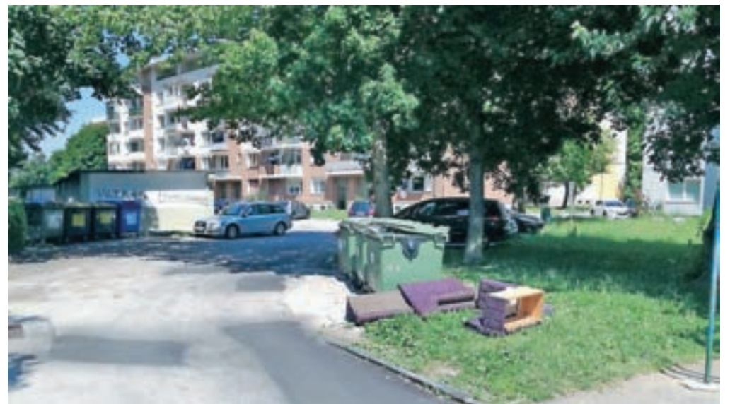
... kosovne odpadke pa je treba odpeljati v zbirni center ali pa za brezplačen odvoz (na podlagi izpolnjene dopisnice) poklicati podjetje JEKO.

odpadkov poostri, še naprej pa bodo občane ozaveščali o pomenu skrbi za okolje in o pravilnem odlaganju odpadkov.