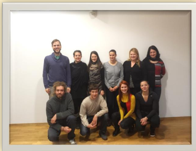
Aktualna skupina PVSP 2014 na Gorenjskem

Cilji operacije so zagotavljanje podpore, zlasti v obliki usposabljanja, mladim z višjo in visoko izobrazbo, ustvarjanje novih delovnih mest v podjetništvu, zaposlovanje mladih.