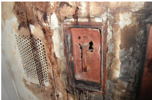
Slika 4: Poškodbe dimovodnih naprav

Lastnik oz. uporabnik je dolžan omogočiti in zagotoviti redno letno neodvisno meritev emisije dimnih plinov, da se preveri vplive kurilne naprave na okolje, učinkovito rabo energije, tlačne razmere in prisotnost nevarnih koncentracij CO v dimnih plinih.