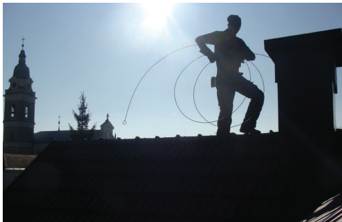
Slika 5: Vaš dimnikar