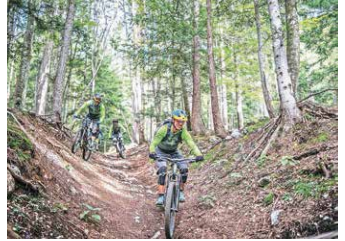
Več o turnokolesarski poti Trans Karavanke najdete na trans-karavanke.pzs.si .

na povezovalni vzpon do tretje in četrte etape. Od tu lahko nadaljujete proti zahodu v smeri Mojstrane (četrta etapa) ali proti vzhodu proti Planinskemu domu na Zelenici (tretja etapa). Če boste etapo zaključili pri Valvasorjevem domu pod Stolom, lahko bolj izkušeni izberete za spust novo pot, imenovano Predigra. Dvokilomska gorskokolesarska pot se začne na Žirovniški planini. Zanj potrebujete ustrezno zaščitno opremo (poleg obvezne čelade tudi ščitnike za kolena in komolce).