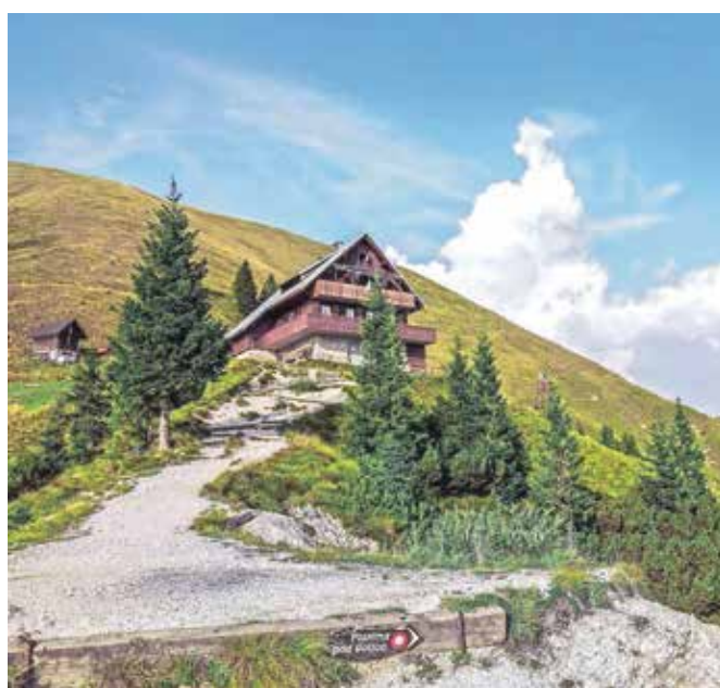
Planinska koča na Golici

Če si želite klasično pot na Golico popestriti s panoramskimi razgledi, se lahko podate na eno ali več etap Panoramske poti Karavanke–Svinška planina, ki