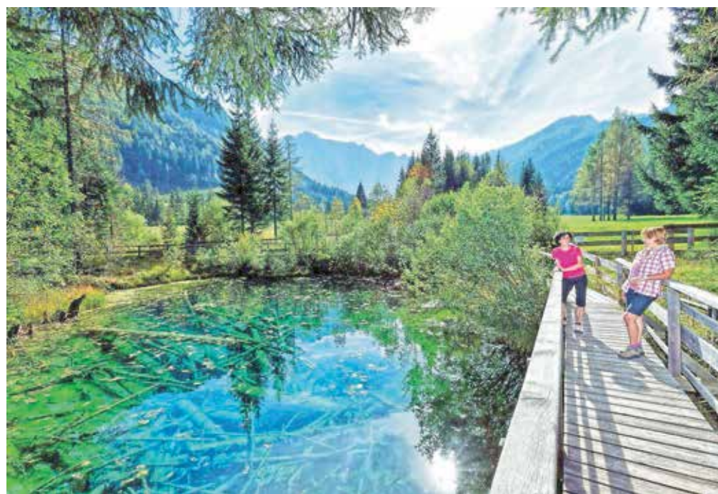
Tematske pohodne poti v dolinah na severni strani Karavank