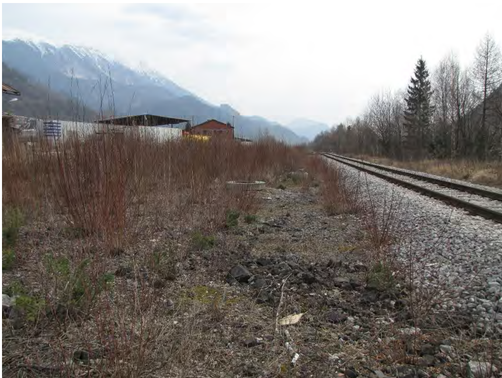
Slika 4 : faza 2