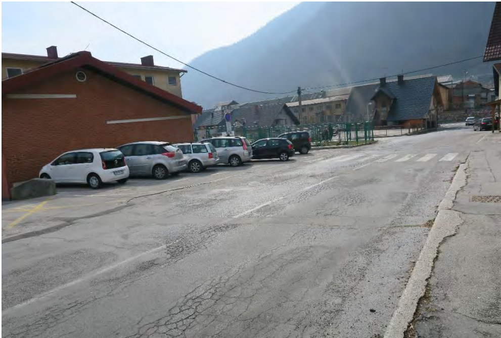
Slika 11 : 1. faza