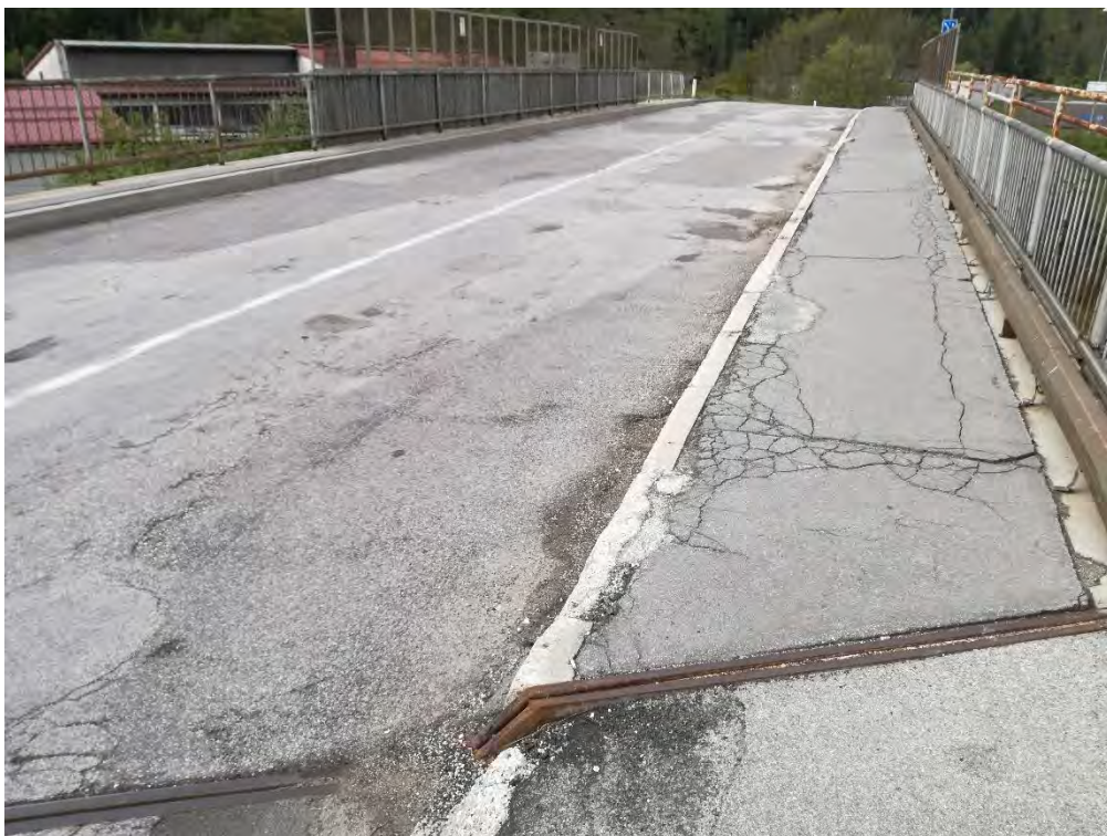
Slika 3: most čez železniško progo – Spodnji Plavž