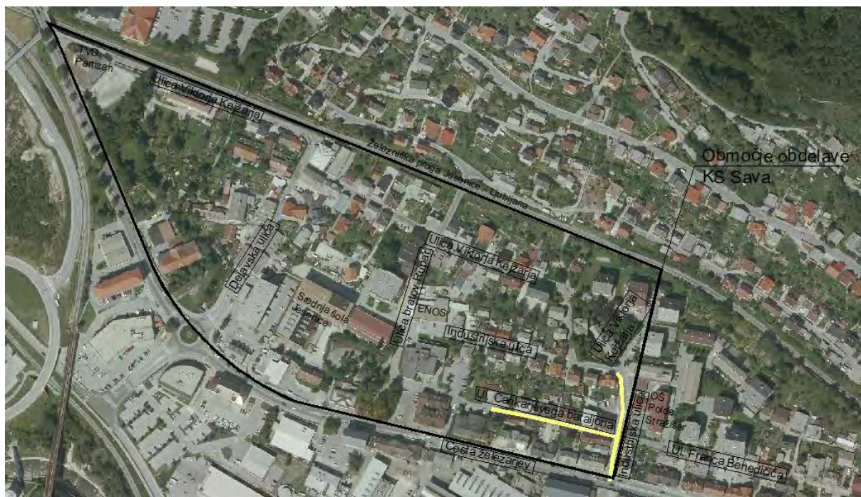
Slika: situacija 1 faze

3.faza: rekonstrukcija kanalizacije z ostalo infrastrukturo ostalega območja.