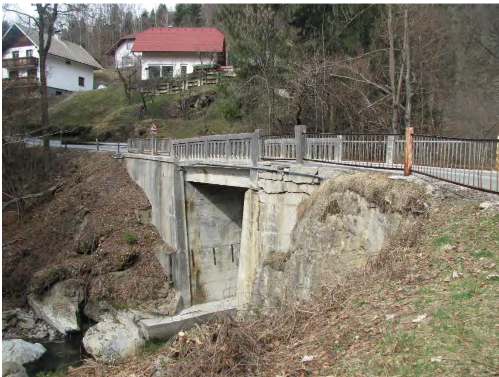
Slika 2 : Most čez Jesenico na cesti v Plavški Rovt/Žerjavec