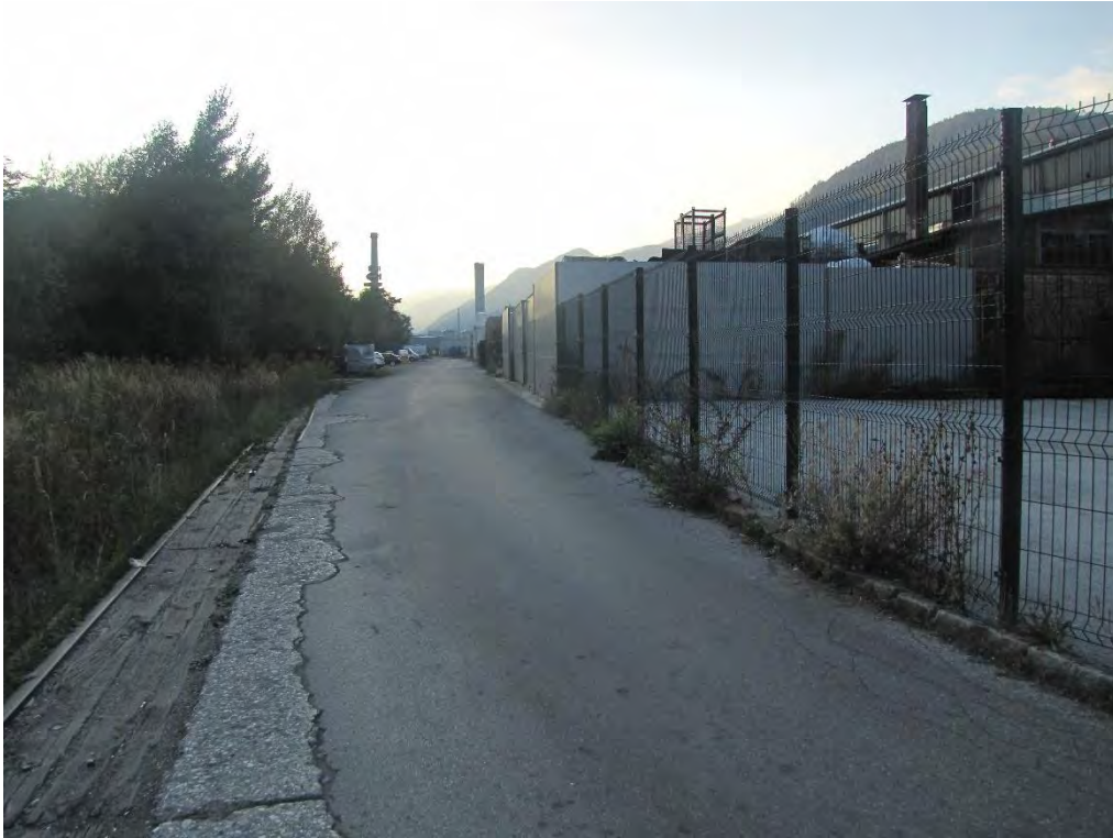
Slika 5 : faza 3