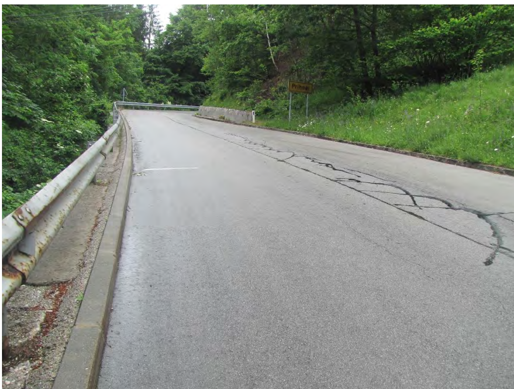
Slika 8 : stanje ceste 2017