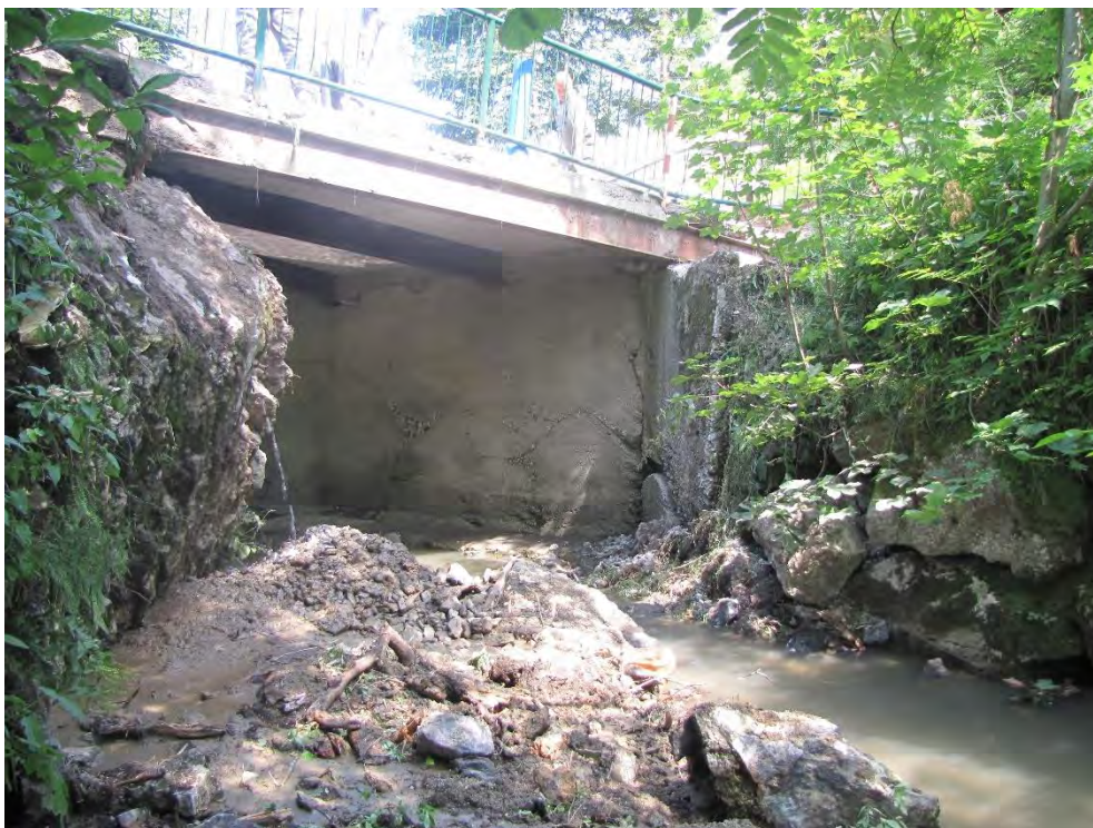
Slika 1 : Most čez Črni potok v Planini pod Golico