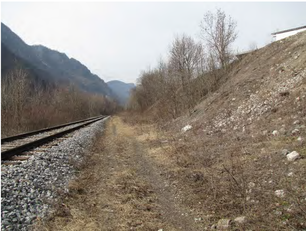
Slika 6 : faza 4