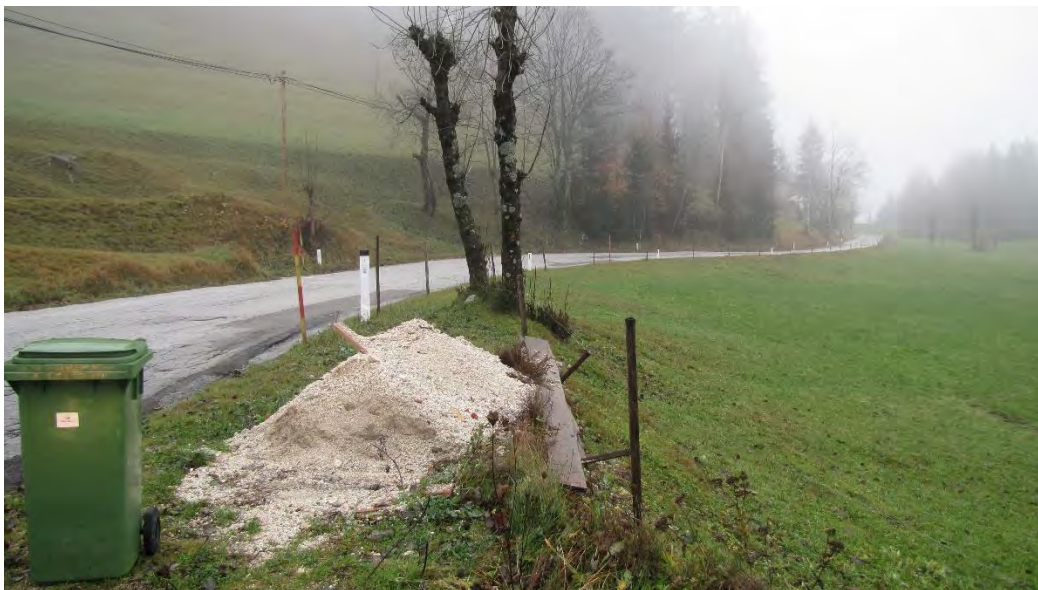
Slika 7 : odsek nad naseljem Prihodi