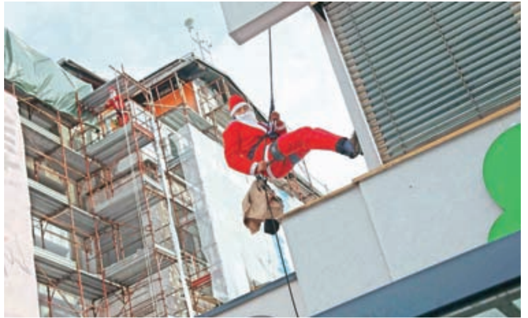
Božički so letos »dostavo« daril zaradi koronavirusa in gradbenih del v bolnišnici malce prilagodili.

Ravno v času obiska Božičkov pa se je na porodnem oddelku rodil par dvojčkov, so povedali v bolnišnici, veseli, da je bil porodni oddelek v predprazničnih dneh poln otroškega joka.