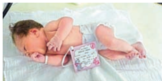
Deklica Mila mu je sledila le dobro uro zatem.

svoji razumejo, da je zaradi epidemije zdaj čas izjemnih razmer. "So izredno potrpežljivi in razumljivi, saj večjih nesoglasij nismo imeli. Porodnice so pri odvzemu brisa izrazile nelagodje, kar