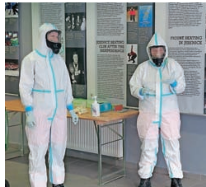
Brezplačno množično testiranje s hitrimi antigenski testi od tega tedna naprej poteka v Zdravstvenem domu Jesenice.