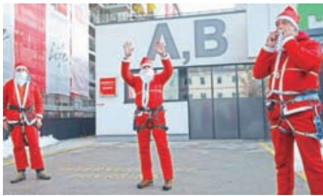
V Božičke se vsako leto spremenijo člani GRS Jesenice.