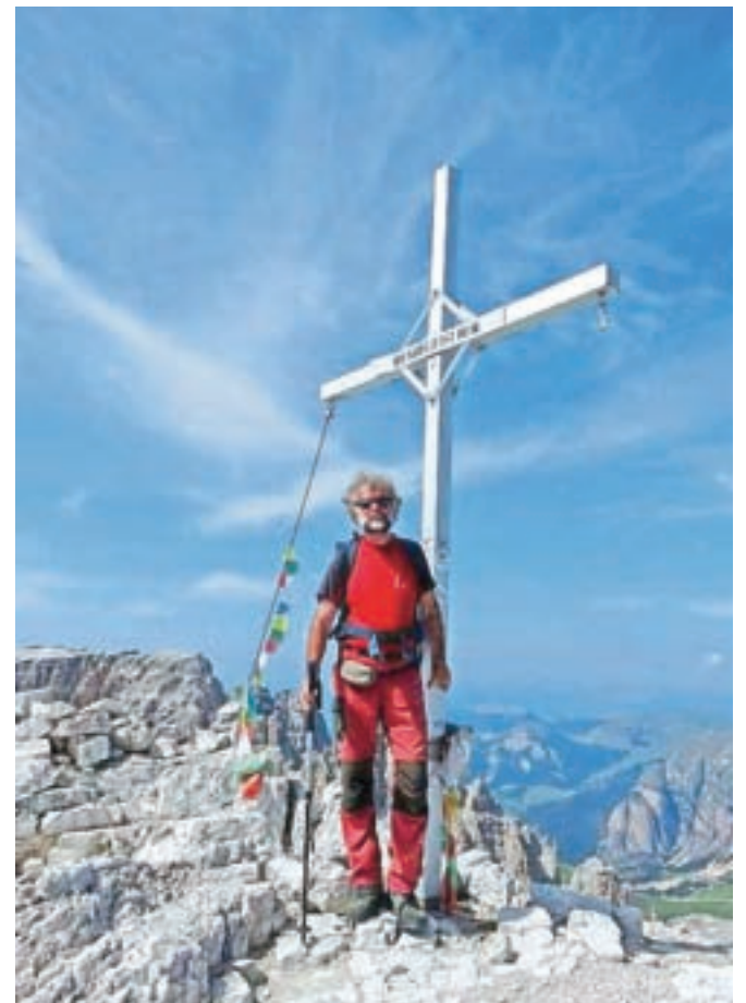
Na vrhu Cime Piscadu v Dolomitih

do najnižjega Strana (711 m n. m.), prečil veliko grebenov, povezanih z vrhovi. Vsega skupaj sem naredil 18 tisoč višinskih metrov. Povzpел sem se na veliko novih hribovk, meni prej