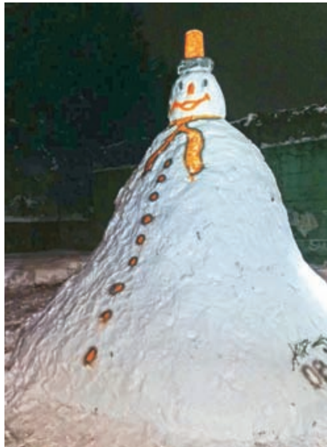
Snežak na Kresu je meril več kot štiri metre.

Ob decembrskem obilnem sneženju so domačini na Kresu nad Koroško Belo postavili velikanskega snežaka, ki je meril več kot štiri metre. Na Facebook strani Koroške Bele so domačine pozvali, naj orjaku dajo ime, med predlogi pa je bilo tudi ime Kresko, glede na to, da je sneženi velikan stal na Kresu.