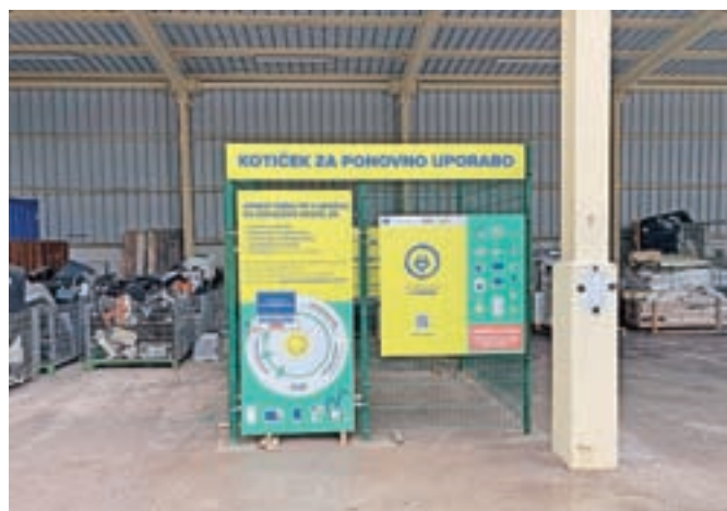
Kotiček za ponovno uporabo v Zbirnem centru Jesenice

Družba ZEOS in javno komunalno podjetje Jeko sta v Zbirnem centru Jesenice na Prešernovi cesti uredila kotiček, ki je namenjen oddaji še delujočih aparatov.