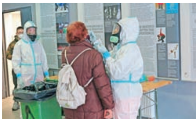
Prvo brezplačno množično testiranje s hitrimi antigenskimimi testi je potekalo prejšnji teden v avli Športne dvorane Podmežakla.