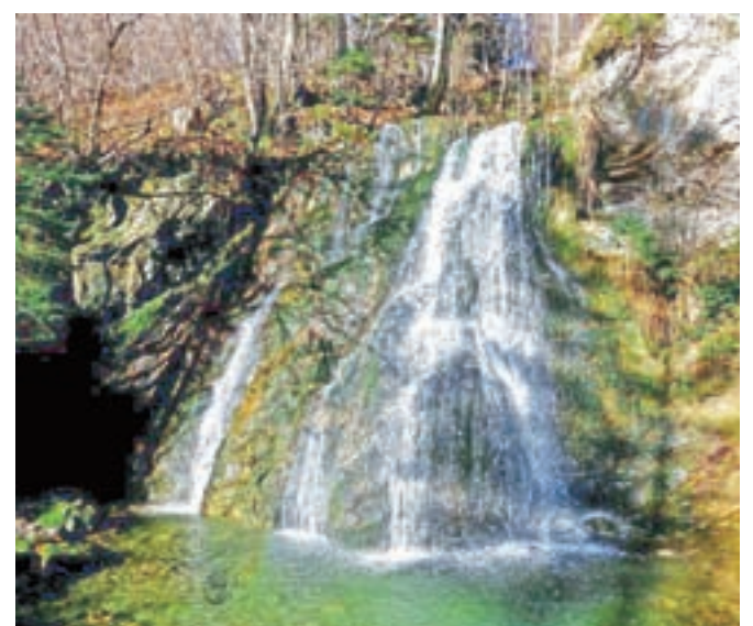
Zgornji pahljačasti slap na potoku Javornik