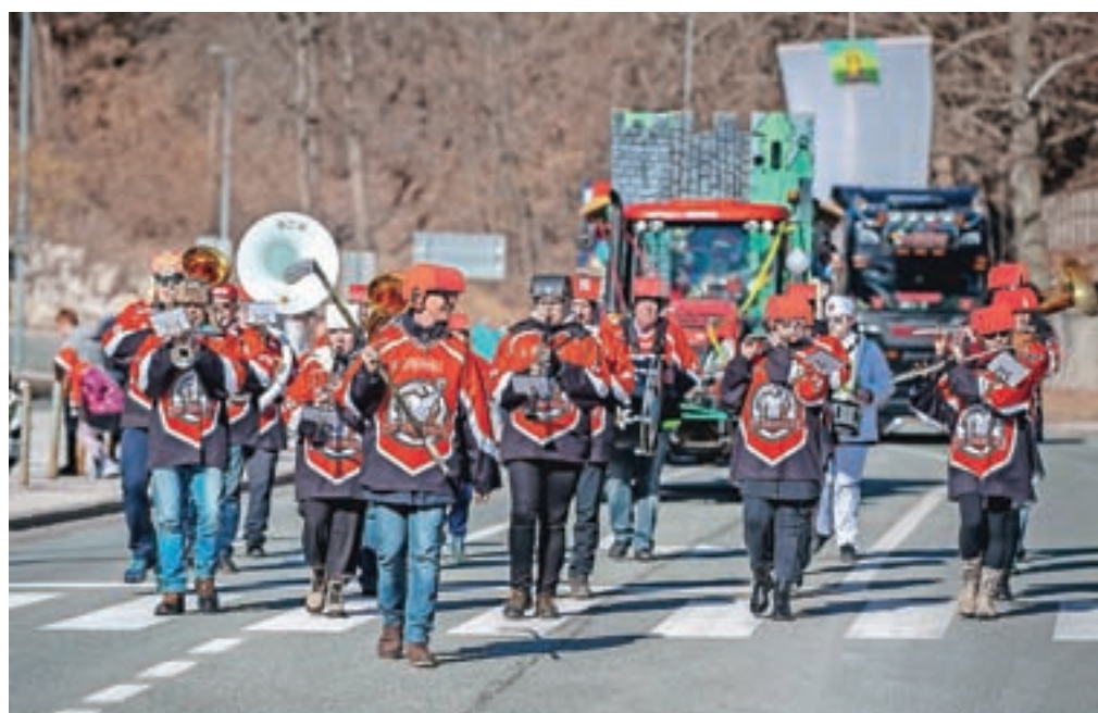
Na čelu povorke so bili strokovnjaki, ki so s ceste pometli virus, sledili so člani Pihalnega orkestra Jesenice - Kranjska Gora, preoblečeni v jeseniške hokejiste.