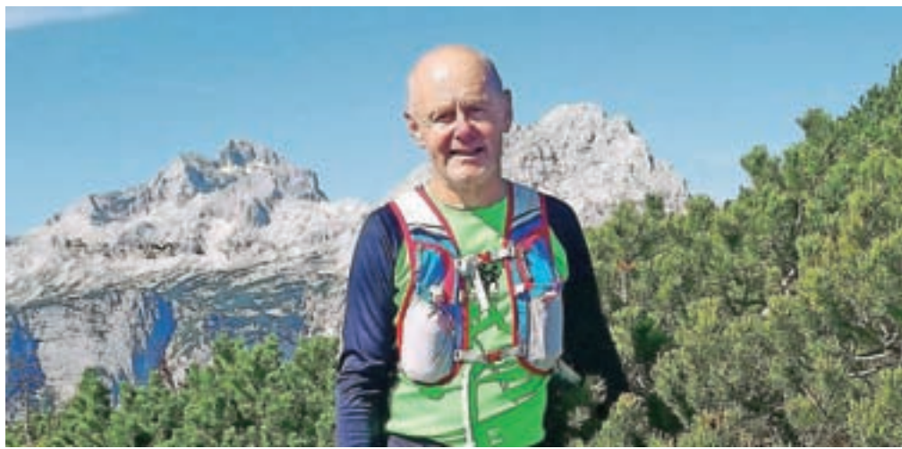
Najbolj uživa v teku po hribih in dolinah. V ozadju Triglav z Rjavino.