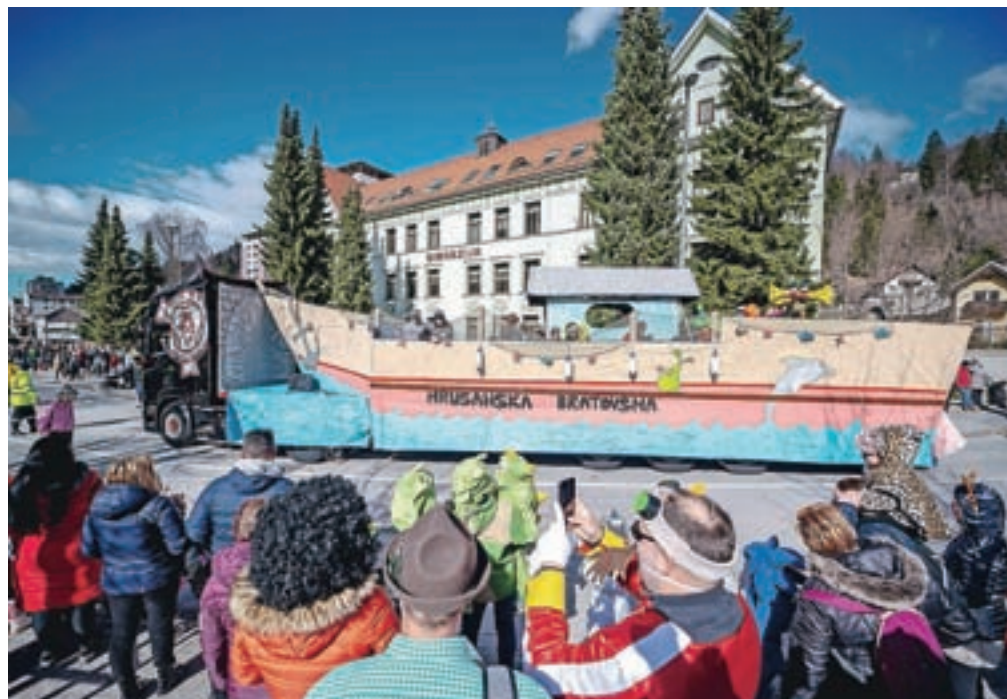
V povorki je bilo okrog 160 maškar, štirinajst vozov, vlačilec, zapravljiček z županom in pometać ceste, skupaj 18 točk.