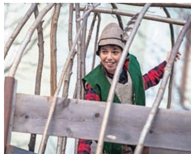
Rdeča nit so bile pravljice in risanke, manjkal ni niti Vandotov Kekec.