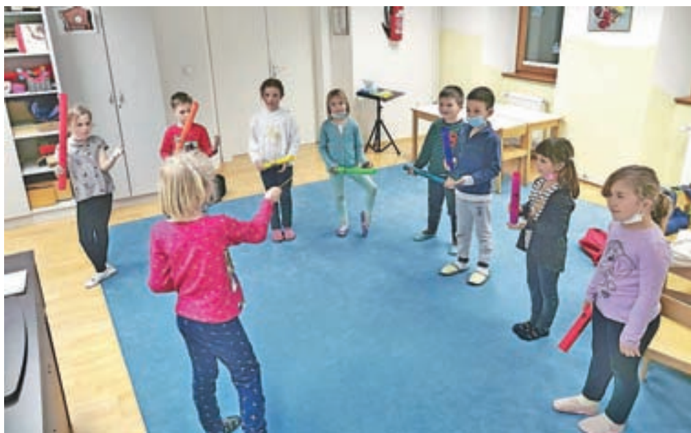
Utrinek s pouka glasbene pripravnice