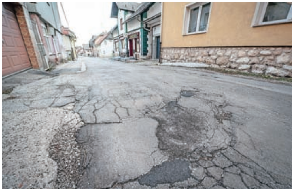
Obnova Delavske ulice in Ulice Viktorja Kejžarja v sprejetem planu obnove občinskih cest sodi med prednostne naloge.

"V proračunu Občine Jesenice za leto 2022 smo zagotovili sredstva za obnovo kanalizacije in vodovoda na območju 2. etape (projektantska ocena vrednosti znaša 700.000 evrov) ter obnovo Delavske ulice (od križišča do TVD Partizan). Izvedbo omenjenega zato načrtujemo še letos, v prihodnjih letih pa nato še izvedbo ostalih etap," so še pojasnili v občinski upravi.