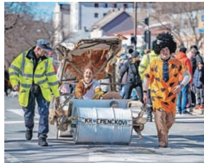
Kremenčkovi po hruščansko

Največja pustna prireditev letos na Gorenjskem je bilo Hruščansko pustovanje s povorko, ki so ga pripravili neutrudni prostovoljci Kulturno-športnega društva Hrušica. Dogodek je na pustno soboto na ulice Jesenic privabil na stotine maškar in ostalih obiskovalcev. Pustna zabava je sledila na Placu na Hrušici, kjer so najboljše maske tudi nagradili. Nagrade so prejeli Smrkci, Kremenčkovi in Spuži Kvadratnik, posebno nagrado organizatorja pa Trnjulčica, Pepelka, Sneguljčica – uporabniki Zavoda oseb s posebnimi potrebami Lepa si. / U. P., FOTOGRAFIJE: NIK BERTONCEJ