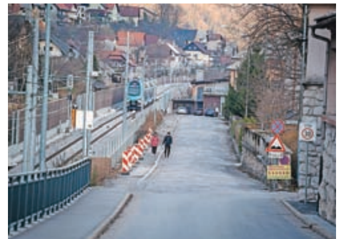
Prostora za gradnjo oziroma stavbnih zemljišč je v občini zelo malo.

upravičencev, drugi pa nanj še čakajo. Ob tem Občina Jesenice skrbi tudi za vzdrževanje stanovanj, od leta 2013 do leta 2021 so za investicijsko vzdrževanje in izboljšave stanovanj namenili 1,3 milijona evrov. Zadnja nova neprofitna stanovanja so v občini pridobili leta 2008, ko je bil zgrajen večstanovanjski objekt Hrušica 56, v njem pa je dvanajst neprofitnih stanovanj. Občina občanom pomaga tudi s subvencioniranjem najemnin, lani je za to namenila nekaj več kot 290 tisoč evrov. Kljub temu pa nekateri najemniki ne plačujejo najemnine (in obratovalnih stroškov), od