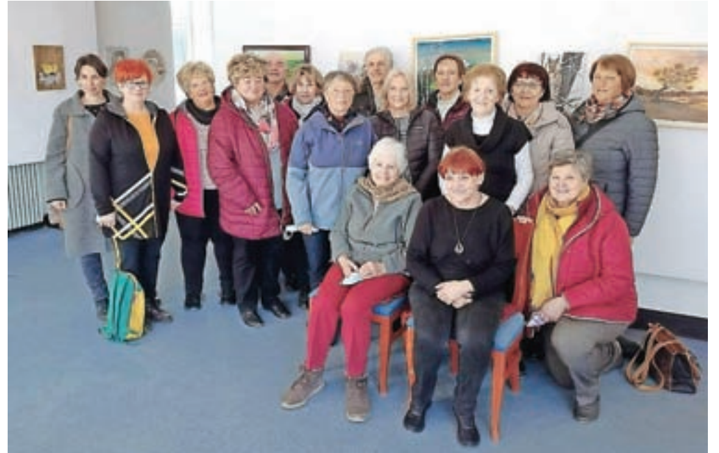
Ljubiteljski slikarji, ki razstavljajo v Doliku.