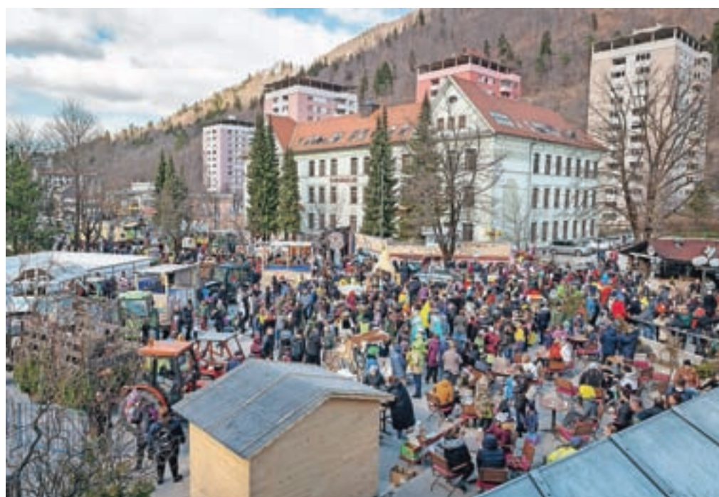
Čufarjev trg so povsem napolnile maske in ostali obiskovalci, kar je dokaz, kako željno so vsi pričakovali sproščanje ukrepov.