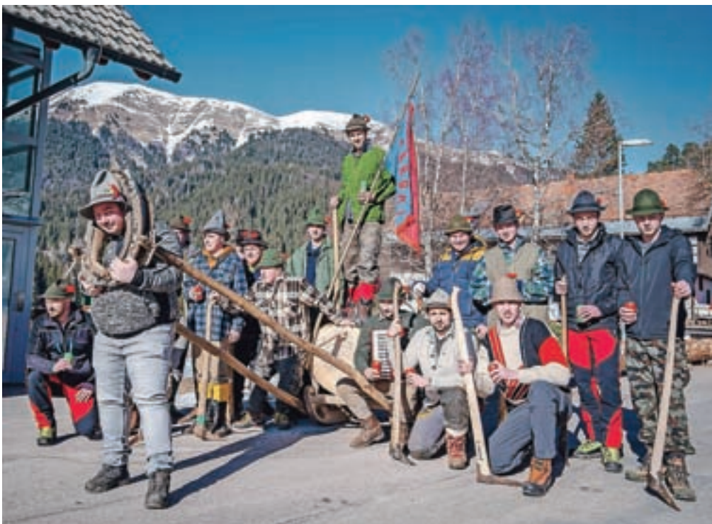
Po nekajletnem premoru so se letos običaja lotili mlajši, "ledik" fantje.

vojni v prejšnjem stoletju. Dolžina ploha je bila različna, po pripovedovanju domačinov je bil najdaljši dolg kar 35 metrov. Letošnji je z dolžino 24 metrov in dobri tri kubičnimi metri lesa sodil med povprečne. Izvedba vleke ploha je odvisna tudi od volje in zagnanosti fantov. Redno in z veliko vnemo so običaj izvajali v letih od 2009 do 2016, po nekajletnem premoru so se letos običaja lotili mlajši, "ledik" fantje, seveda kot vedno ob predpostavki, da se ni omogočilo nobeno dekle.