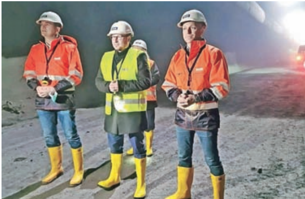
Minister za infrastrukturo Jernej Vrtovec (v sredini) je izrazil zadovoljstvo s potekom del v predoru.