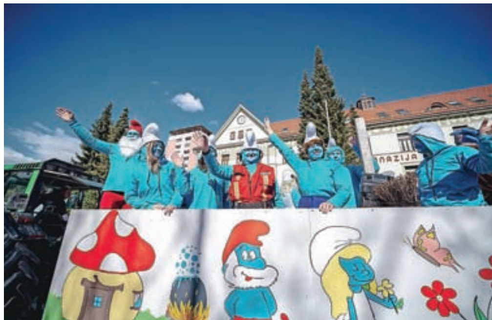
V povorki so sodelovale skupinske maske, kot so Smrkci, Telebajski, Sneguljčica in palčki, Kekec in njegova družina ...