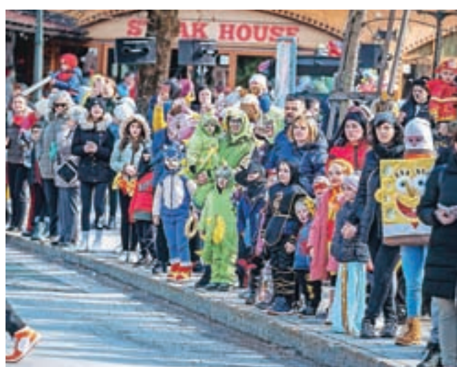
Povorko je na ulicah Jesenic spremljalo ogromno ljudi, zlasti malih maškar.