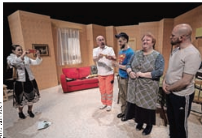
Komedija Za vse sem sama gre na festival v Pekre.

Koronavirus je v zadnjih dveh letih močno posegel tudi v izvajanje programov v Gledališča Toneta Čufarja na Jesenicah. Vse vaje in predstave so prilagajali aktualni epidemiološki situaciji oziroma jih predstavljali v kasnejši čas. Po negotovostih na začetku letošnjega leta se v marcu z večjim optimizmom vendarle počasi vračajo v ustaljeni ritem. Najprej so bili v februarju soorganizatorji osrednje prireditve ob slovenskem kulturnem prazniku, 2. marca so gostili legendarni New Swing Quartet, ki je nastopil na dobrodelnem koncertu