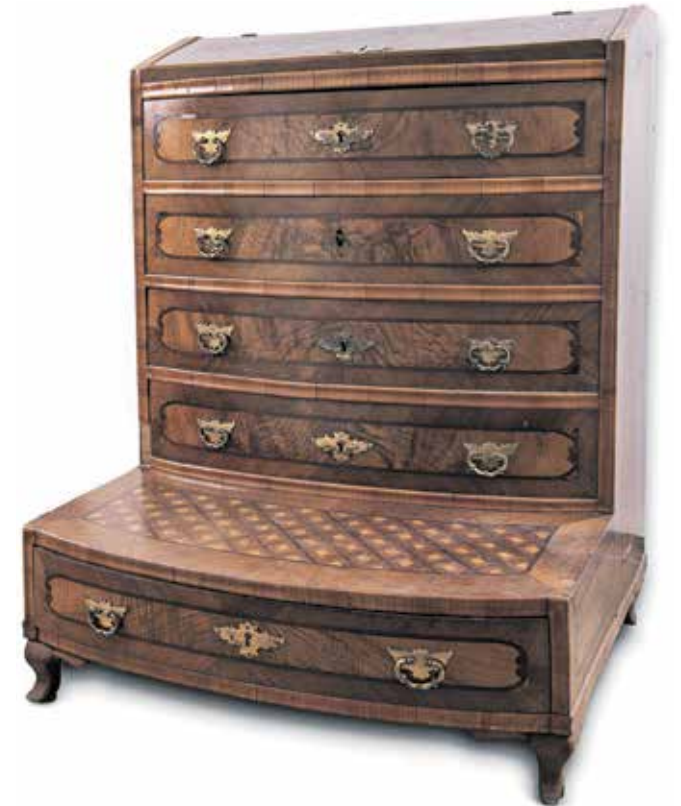
Klečalnik je eden redkih predmetov, za katere lahko z gotovostjo trdijo, da je bil v lasti družine Ruard.

Ime FeNOMEN združuje kemijski znak za železo in besedo nomen, kar v latinščini pomeni ime. Lahko bi rekli, da razstava že v imenu nosi železo ali drugače – »v imenu železa«.