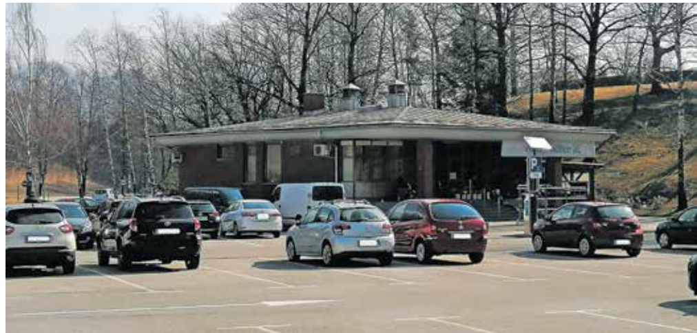
Pokopališki objekt na Blejski Dobravi bodo celovito prenovili.

Pogodbena vrednost del znaša dobrih 686 tisoč evrov, od česar bo nekaj več kot 143 tisoč evrov sofinancirala EU iz Kohezijskega sklada, preostanek pa Občina Jesenice iz proračuna. Dela morajo biti zaključena najkasneje do konca junija prihodnje leto.