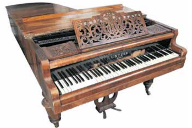
Eden od dragocenih predmetov, ki bo na ogled v graščini: klavir iz druge polovice 19. stoletja

In še posebna zanimivost: svoj prostor bo v obnovljeni Bucelleni-Ruardovi graščini našel tudi jeseniški meteorit, ki je leta 2009 padel na planoto Mežakla. Meteorit Jesenice je šele enajsti meteorit na svetu, ki so mu astronomi lahko točno izračunali orbito, zato predstavlja izjemen predmet v zbirnici geološke dediščine Slovenije.