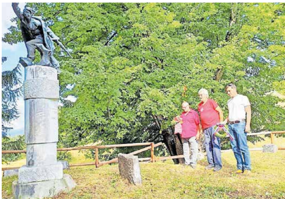
Polaganje venca k spomeniku na Obranci