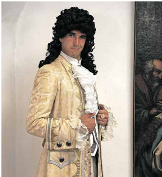
Snemanje promocijskega filma za novi muzej v sklopu projekta Z Valvasorjem po gorenjskih muzejih

Ime FeNOMEN združuje kemijski znak za železo in besedo nomen, kar v latinščini pomeni ime. Lahko bi rekli, da razstava že v imenu nosi železo ali drugače – »v imenu železa«.