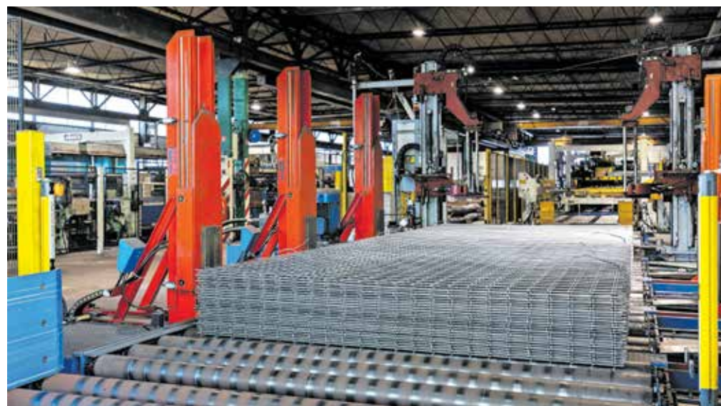
Kovinar Jesenice je največji proizvajalec armaturnih mrež na območju nekdanje Jugoslavije.

Podjetje je od leta 2007 v italijanski lasti, lastnik je skupina Pittini, ki je ena večjih jeklarskih korporacij v Evro-