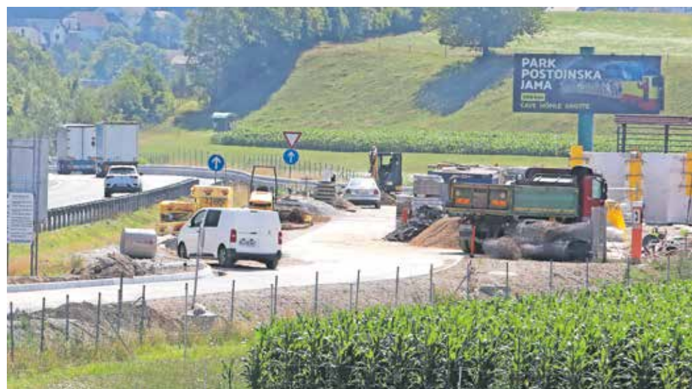
Obnova počivališča Lipce jug že poteka, še letos naj bi začeli dela tudi na drugi strani avtoceste na počivališču Lipce sever.

»Pri veliki večini potnikov v tranzitu so mala počivališča prvi in morda tudi edini stik s Slovenijo. Imenovali bi jih