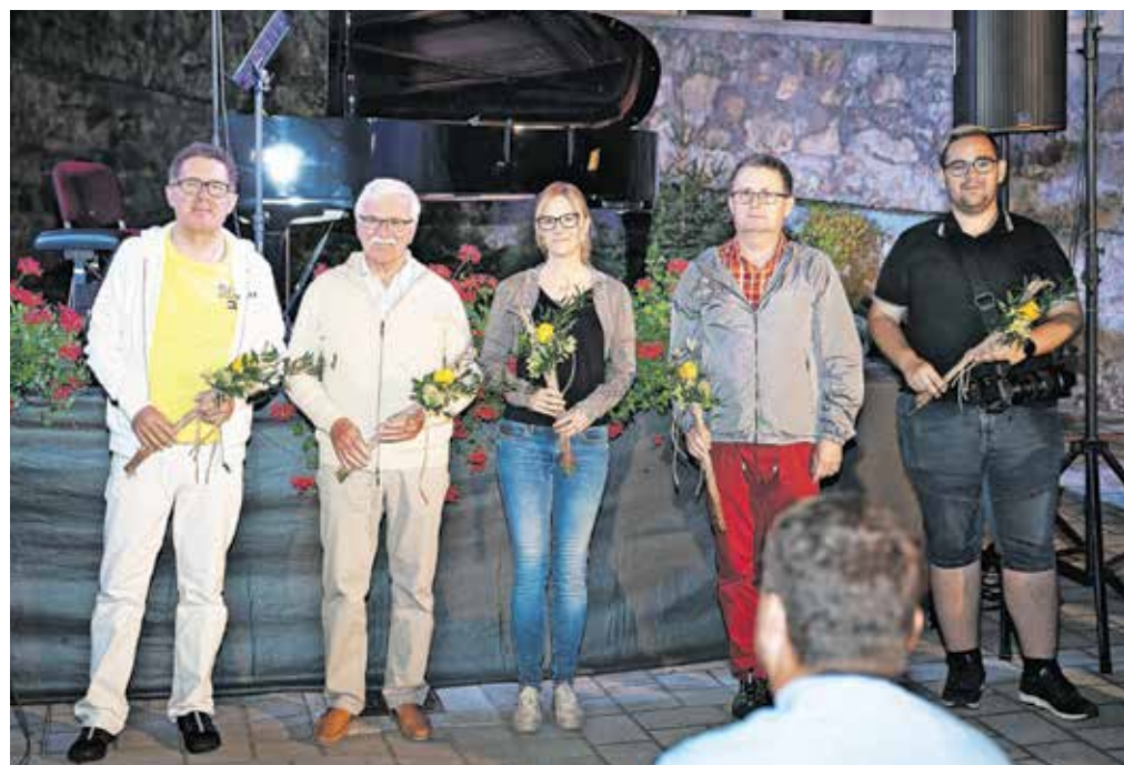
Sodelujoči fotografi, člani Fotografskega društva Jesenice

Palovšnik, predsednica Farnega kulturnega društva.