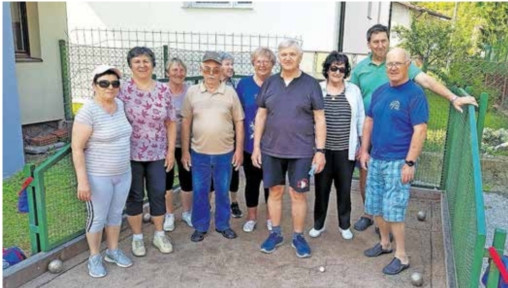
V poletnem času lahko člani uporabljajo balinišče Podmežakla. V objektiv smo ujeli skupino najbolj zagretilih ljubiteljev tega športa.

Dvajsetega julija so v Gozdu - Martuljku organizirali poletno srečanje za člane, ki so se ga udeležili tudi predstavniki gorenjskih društev invalidov in pobratenege društva Mežiške doline, podružnice