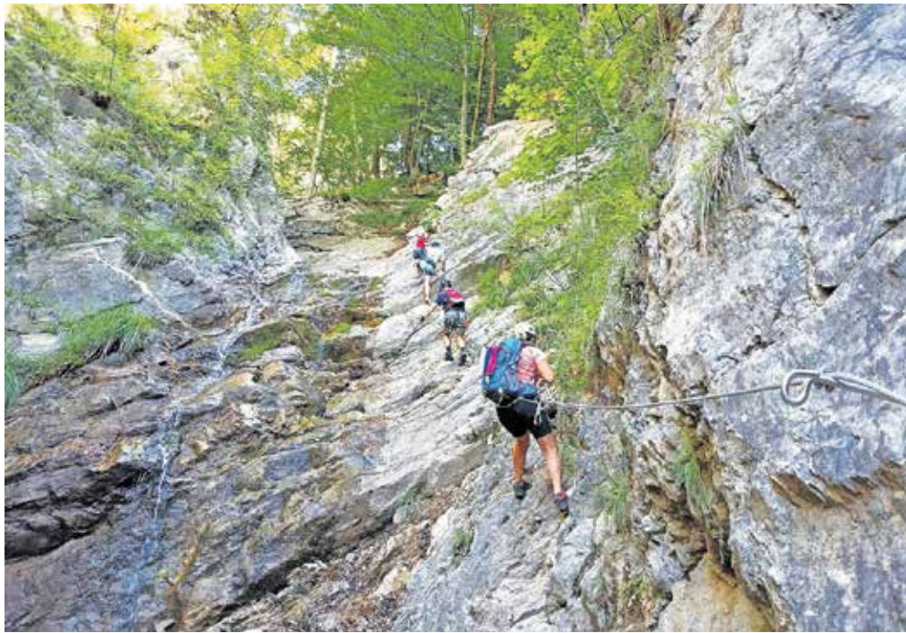
Ferata je označena s stopnjo B ter ponekod C in je srednje zahtevna.

Obiskovalcem priporočajo uporabo primerne obutve, saj je pot zaradi bližine vode spolzka. Opremo, ki je za obisk ferate obvezna, to je čelade in samovarovalnega pasu, pa si lahko tudi izposodijo, in sicer v piceriji Trucker na Hrušici vsak dan med 9. in 22. uro, cena izposoje je 15 evrov na dan. Za sestopanje s ferate je obvezna uporaba gozdne poti, sestopanje navzdol po ferati ni dovoljeno. Ob tem se je Gorinjac zahvalil tudi lastni-