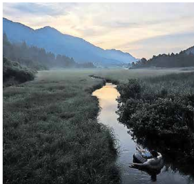
Film Sava slavi mogočnost reke Save.

Gornjesavski muzej Jesenice v začetku septembra pripravlja dve brezplačni projekciji dokumentarnega filma Sava. Premierno bo predvajan 2. septembra ob 20. uri v sklopu Filmov pod lipo na dvorišču Liznjekove domačije, dan pozneje pa bo prav tako ob 20. uri na sporedu v Kolpernu na Stari Savi na Jesenicah. Gre za »meditativni dokumentarec« britanskega režiserja Matthewa Somervillea, ki je nastal lani. Nekoč najdaljša reka v Jugoslaviji se na svoji 990 kilometrov dolgi poti po toku navzdol pogovarja – njen glas povzame nedavno preminula igralka Mira Furlan – z ljud-