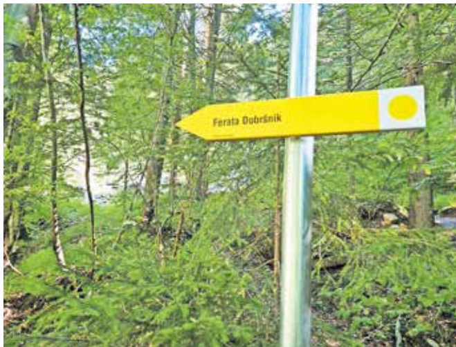
Do ferate obiskovalca vodijo smerokazi z rumenimi puščicami.

kom zemljišč, ki so omogočili uporabo. Čez zimo bo ferata zaprta, uporaba bo dovoljena do 31. oktobra in zatem spet od 1. aprila naprej.