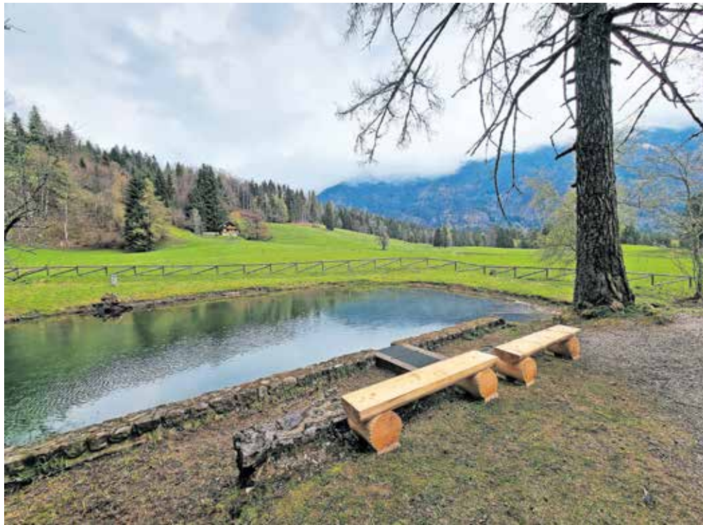
Zoisov park z novimi klopami ob jezeru

V bližini parka se je mogoče okrepčati v Domu Pristava, ki je stalno odprt in je nekdanja Zoisova pristava z vklesano letnico 1647. Nedaleč stran je tudi Kurirčkov dom, kjer je urejen gorskokolesarski učni center, ki je namenjen vsem navdušencem nad gorskim kolesarstvom. V centru si je mogoče izposoditi kolesa in opremo za gorsko kolesarstvo, gorski kolesarji se lahko preskusijo na poligonu, v neposredni bližini pa poteka tudi turnokolesarska pot Trans Karavanke.