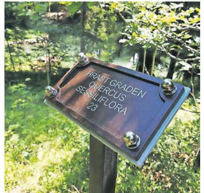
Pred kratkim so zamenjali tudi 27 starih kovinskih tablic, ki označujejo drevesne vrste.

Zoisov park je del Naravoslovne in rudarske učne poti, ki je dolga približno enajst kilometrov, opremljena je z markacijami in tablami na zanimivih točkah ob poti, kot so rudnik mangana, izviri potoka Javornik, najdišče fosilov. Izhodišče poti je pri ČŠOD Trilobit.