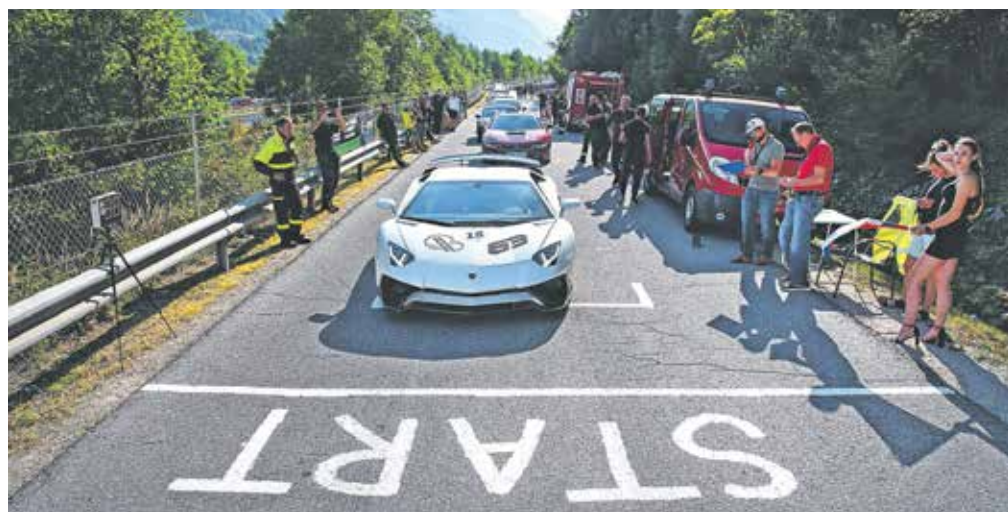
Hillclimb Hrušica bo letos potekal drugič.

žini 2,6 kilometra. Zanimanje amaterskih voznikov za preizkus zmogljivosti njihovih jeklenih »mrcin« je ob prijavih spet presežlo možnosti izvedbe, tako da jih bo lahko na podlagi izbora najatraktivnejših, posebnih in raznolikih nastopilo osemdeset. Tekmovali bodo s športnimi vozili in drugimi svetovno znanimi znamkami dirkalnih vozil. Po zaključenem tekmovanju bodo lastniki vse avtomobile pripeljali na Plac na Hrušici, kjer se obeta zabavni in glasbeni program za vse obiskovalce, za odličan zaključek dneva pa bodo za vzdušje poskrbeli člani skupine Rock Partyzani. Za organizatorje je celotna izvedba velik zalogaj, v času priprav na sam dan tekmo-