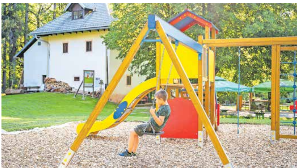
V krajevni skupnosti Slovenski Javornik - Koroška Bela so ob domu na Pristavi postavili nova igrala.

V krajevni skupnosti Podmežakla so bili na Cesti 1. maja drogovi ulične razsvetljave dopolnjeni s konzolnimi nastavki za zastave, osvetljen je tudi Hermanov