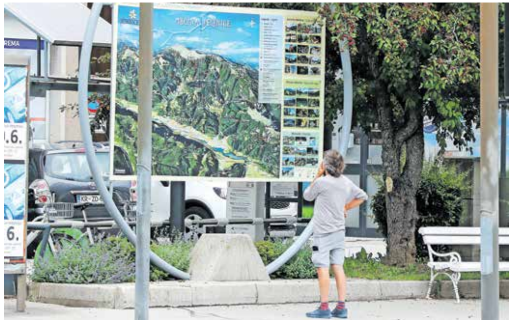
Turisti se z Jesenic razpršijo po okoliških hribih in krajih.

Katja Medja in pojasnila, da imajo izletniki večinoma že izdelane načrte, kaj si želijo ogledati.