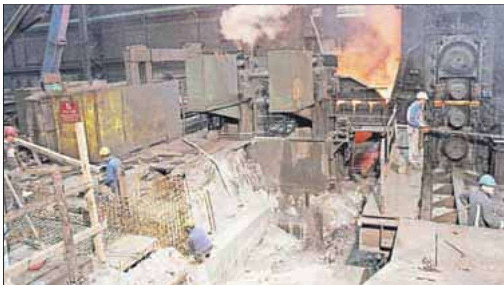
Prilagodljiva dela med proizvodnim procesom na menjavo valjavnega stroja

»Kljub rekordnim proizvodnim in prodajnim rezultatom iz vidika količin je bila vrednost naše prodaje za tri odstotke nižja kot leta 2011 oziroma osem odstotkov