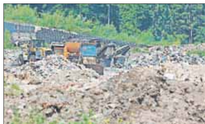
Količina odloženih odpadkov na deponiji Mala Mežakla se iz leto v leto zmanjšuje.

be ravnanja z odpadki v občinah Postojna, Pivka, Kamnik in Komenda. Marko Markelj je opozoril, da se vse deponije v Sloveniji trudijo zagotoviti potrebno količino odpadkov in s tem rentabilno poslovanje. Nekatere deponije ponujajo tudi bistveno nižjo ceno za dovoz odpadkov, celo od 40 do 60 evrov za tono. Vendar nekatere od teh deponij nimajo okoljevarstvenega dovoljenja, zato tudi ne zaračunavajo finančnega jamstva.