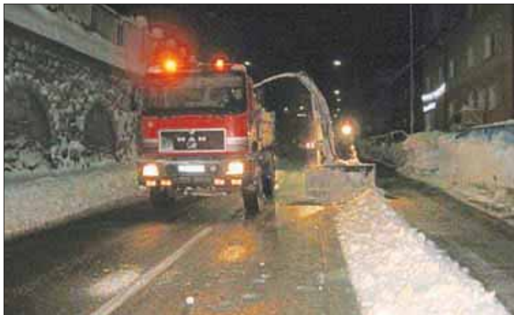
Delavci komunale so prek noči očistili večji del zapadlega snega.

Zaradi obilnega sneženja, po podatkih komunale je prejšnji teden samo v torek med 7. in 14. uro na območju Jesenic padlo več kot 50, v Planini pod Golico pa več kot 90 centimetrov snega, je prišlo do prometnega kolapsa. Na več mestih so tako v prometu obtičali tovornjaki, po stranskih ulicah so se Jeseničani prebijali po cellem snegu, kjer so številni obtičali in se na svoj način spopadli z obilico snega. Slabe razmere na cestah pa so povzročile nemalo hude krvi med občani in občankami Jesenic, ki se še popoldne na nekaterih območjih Jesenic niso mogli prebiti do svojih domov. Kot je pojasnil vodja zimske službe jeseniškega komunalnega podjetja Jeko-in Blaž Knific, so bile na terenu vse razpoložljive sile, ki pa obilne količine snega preprosto niso zmogle: »Delali smo celo noč in odvažali sneg, ki je zapadel dan prej, zjutraj pa zaradi obilnega sneženja ni šlo več. Več kot delati se ne da. Dve ekipi sta frezali in dve odvažali. V dveh dneh, zase lahko povem, sem spal slabi dve uri. Program imamo dober, številni koooperanti pa so opravili neverjetno delo, saj so bile razmere res kaotične.« Delo zimske službe v dneh sneženja smo si ogledali tudi sami, komunalni delavci pa so nas seznanili s težavami, s katerimi se spopadajo. Največjo