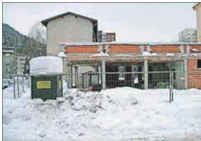
Zagotovo se bo še letos selila Lekarna Plavž – v nov objekt na mestu Pikove dame.