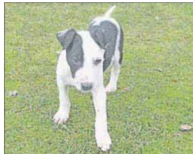
Nov dom išče samček, star tri mesece. Tel.: 041/666-187