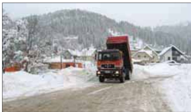
Zaradi obilne količine so bili delavci Jeko-ina prisiljeni sneg odvažati na deponije, eno takšnih so naredili pri balinišču Baza.