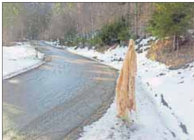
Živalska koža na občestnem drogu ...