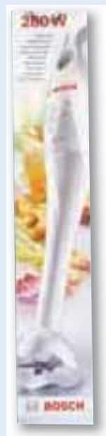
ali palični mešalnik BOSCH

Na Gorenjski glas se želim naročiti najmanj za eno leto (cena izvoda je 1,50 EUR). Brezplačno ga bom prejel 3 mesece, prejel bom od 10- do 25-odstotni popust, enkrat mesečno brezplačno objavo malega oglasa, veliko zanimivega branja in darilo.