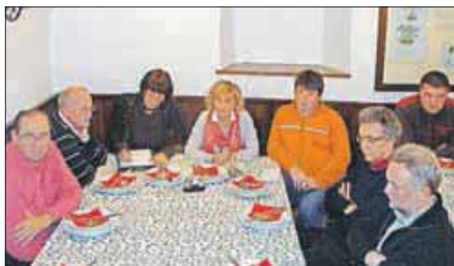
Decembrsko srečanje sveta krajevne skupnosti s predstavniki društev in organizacij

dotrajane prostore. Največ dela in stroškov je z vzdrževanjem, zelo drago je ogrevanje.