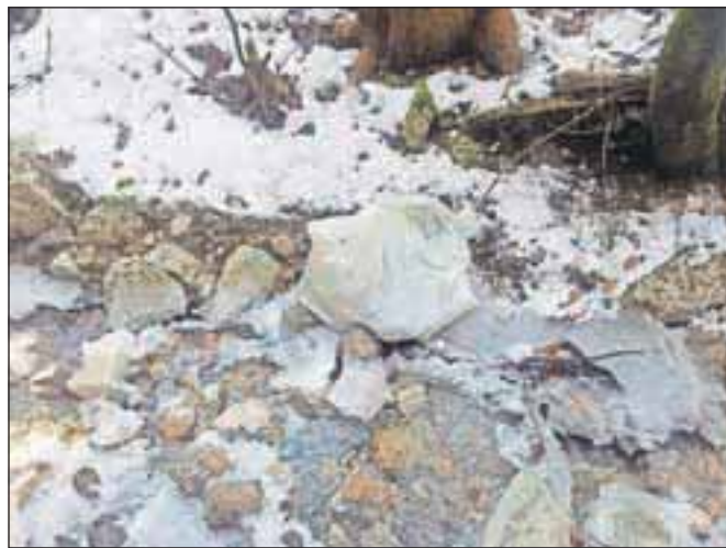
Vrečka z živalskimi ostanki v potoku Javornik

tej Demšar pojasnil: "Če gre za prijavo oziroma najdbo nelegalnega odlaganja odpadkov, ki so živalskega izvora, v naravi, je za obravnavo prijave pristojen Inšpektorat Republike Slovenije za okolje in prostor. Če inšpektorat, policija ali kdo drug ugotovijo, kdo je povzročitelj nelegalno odloženega odpadka in gre za cela trupla živali, ki bi lahko predstavljala tveganje za zdravje živali ali ljudi, zadeve prevzame naš urad." Sicer pa je koncesionar za izvajanje gospodarske javne službe ravnanja s stranskimi živalskimi proizvodi podjetje KOTO. To podjetje je v skladu z zakonodajo pristojno za prevzemanje, zbiranje, predelavo in odstranjevanje živalskih stranskih proizvodov.