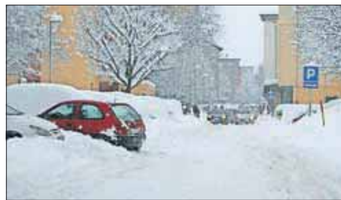
Zaradi obilnega sneženja je v torek po Jesenicah prihajalo do prometnih zastojev, obtičali so tovornjaki, nekatere ulice pa so bile neprevozne.

optika Berce fashion eyewear JESENICE - LESCE