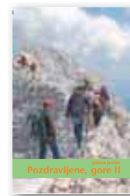
ali knjiga Pozdravljene gore II