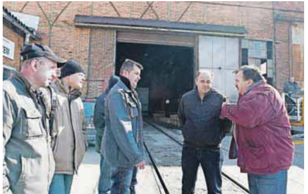
Zaposleni v Pilastru bodo v ponedeljek dobili delovne knjižice in se prijavi na Zavod za zaposlovanje. Kje lahko dandanes dobijo službo?

Stečajna upraviteljica niti še nima natančnih podatkov o premoženju podjetja, kljub temu pa je pojasnila, da vsi stroji niso zastavljeni, zato se bo lahko oblikovala stečajna masa, kolikšna, je za zdaj prehitro ugibati. Zato pa je jasno, da se bo zaposlenim v teh dneh iztekel 15-dnevni odpovedni rok, zato se bo v ponedeljek začel postopek vročitve delovnih knjižic.