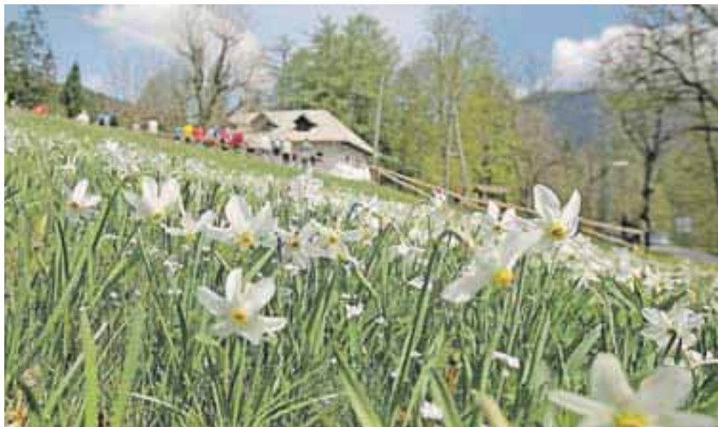
Pristava je zadnja leta tradicionalno prizorišče prvomajskih srečanj Jeseničank in Jeseničanov. Lani so prvega maja že cvetele narcise.

Po tradiciji se Jeseničanke in Jeseničani za prvi maj zberejo na prvomajskem srečanju, ki zadnja leta poteka pri Domu Pristava nad Javorniškimi Rovtom. Srečanje bo tudi letos, in sicer v sredo, 1. maja, začelo se bo ob 11. uri. Nastopil bo Pihalni orkester Jesenice-Kranjska Gora, slavnostni nagovor naj bi imel župan občine Jesenice, poskrbljeno bo za hrano in pijačo in zabavo. Organizator srečanja je letos Zveza društev prijateljev mladine Jesenice, ki je najemnica Doma Pristava in se tretje leto trudi oživiti ta lep del narave nad Jesenicami. Pri organizaciji sodelujeta tudi Občina Jeseni-