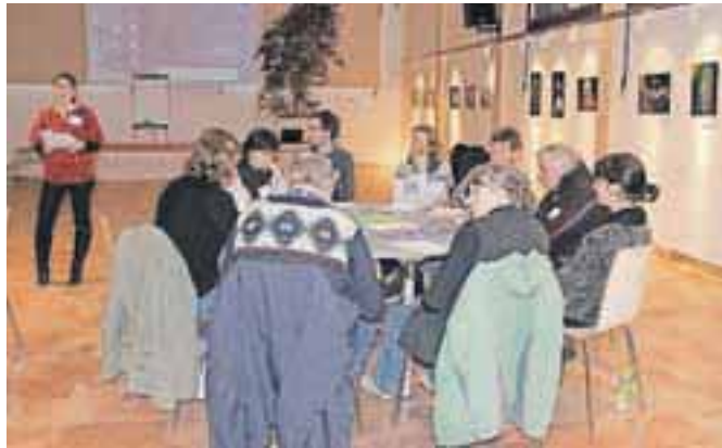
Utrinek s tretje delavnica v Kolpernu

Alianta kot zunanji sodelavec povezali s posameznimi udeleženci in opravili ogled Stare rudne poti ter sestanek za programsko obogatitev meseca narcis. Poleg tega bodo pripravili pregled