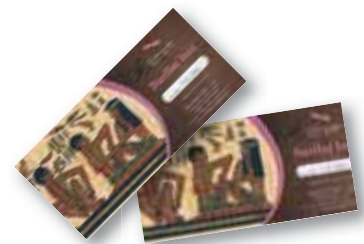
ali darilni bon za refleksoterapijo v vrednosti 20 EUR