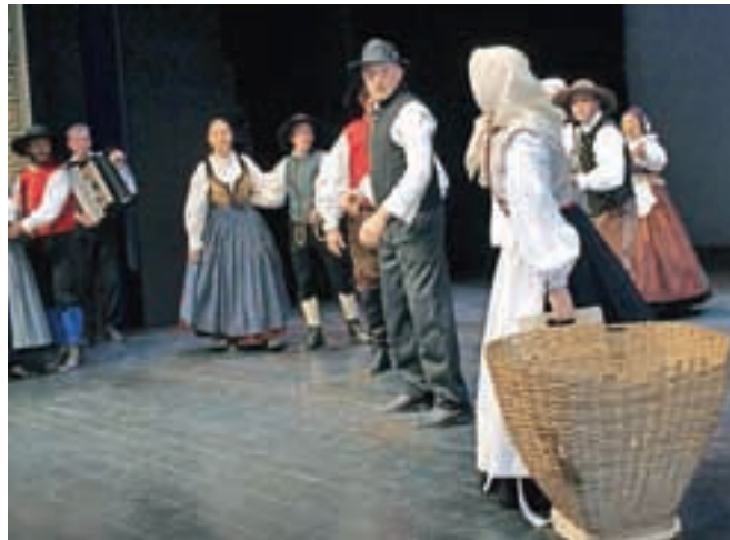
Nastop Folklorne skupine Triglav Slovenski Javornik - Jesenice

videli danes, ni le vrhunec ljubiteljske kulture na Jesenicah, temveč njen vrh v slovenskem merilu. Treba je poudariti, da kulturna in folklorna društva treh občin, ki jih pokriva jeseniška območna izpostava JSKD, na slovenskem nivoju zelo dobro delujejo.« Obiskovalci so izrazili izjemno navdušenje nad nastopom gimnazijskega teatra Gimnazije Jesenice, ki se je predstavil z recitalom Šel je popotnik skozi atomski vek Mateja Bora.