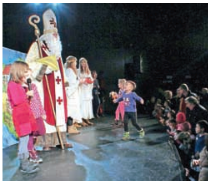
Več kot 500 mladih obiskovalcev je sprejelo Miklavža v dvorani Kina železar.