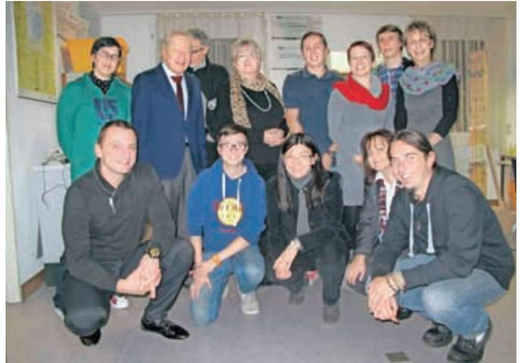
Na obisku v mladinskem razvojnem centru v Nagoldu