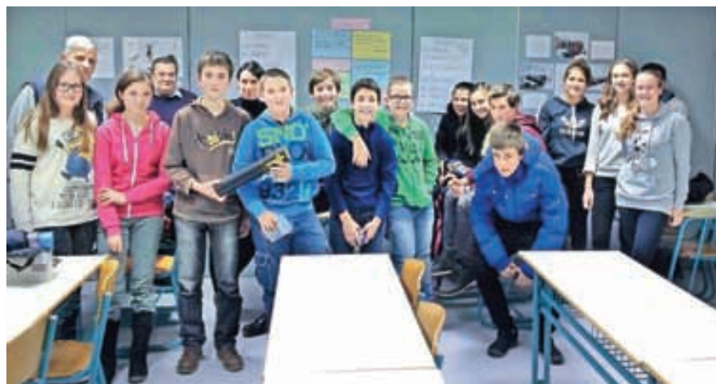
Jeseniški osnovnošolci, ki so tekmovali v igri križemkrazem na Ljudski univerzi Jesenice.