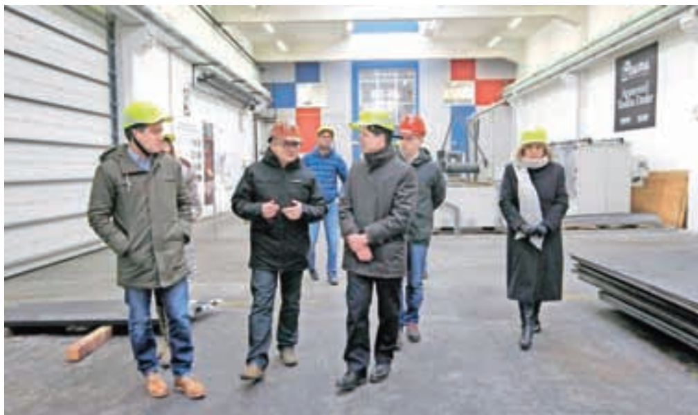
Proizvodnjo so si ogledali predstavniki Evropske komisije.