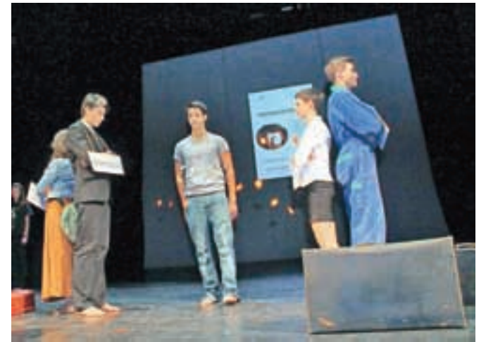
Z recitalom Šel je popotnik skozi atomski vek so navdušili gimnazijci.