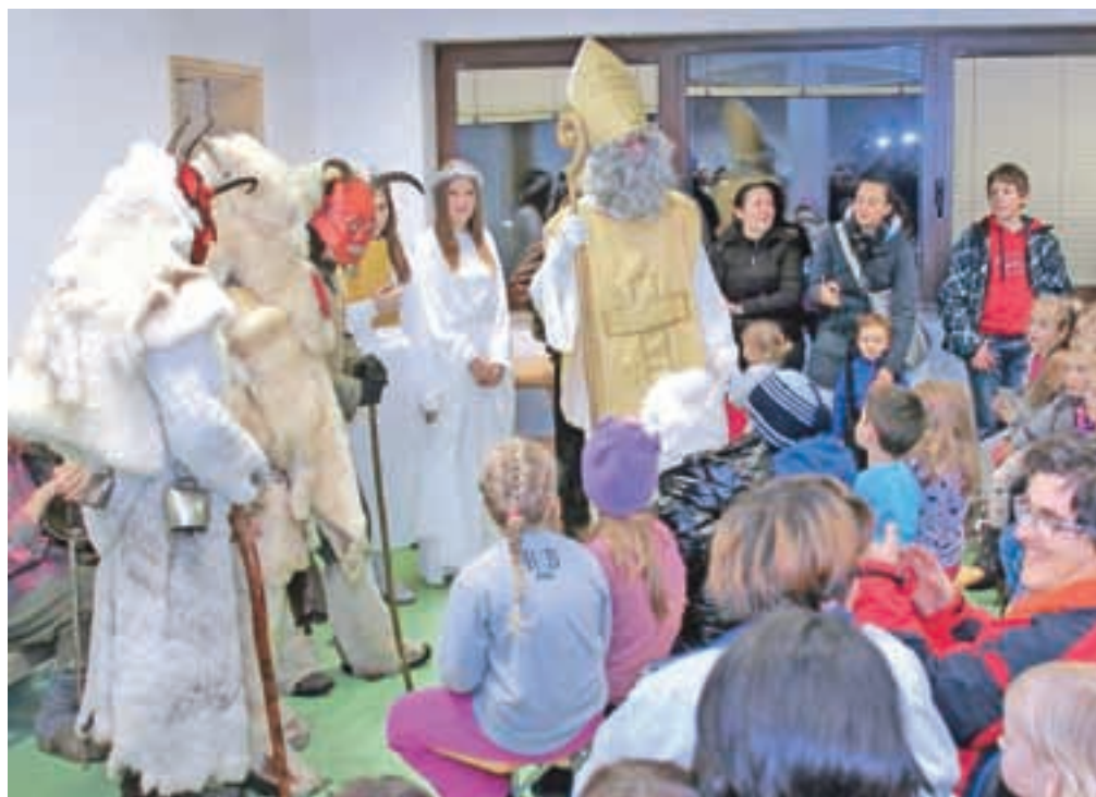
Miklavž je pozdravil otroke in njihove starše tudi na Hrušici.

Miklavž in parkeljni, ki so sprejeli pridne in malo manj pridne otroke, pa so obiskali tudi Hrušico. Na Placu se je zbralo kar okoli 200 obiskovalcev. Te so najprej sprejeli parkeljni, ki so tiste, ki se v minulem letu niso najbolj izkazali s pridnostjo, dodo-