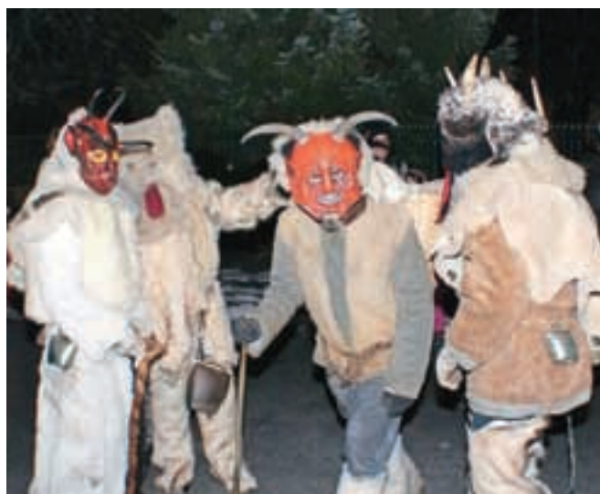
Prihod parkeljnov na Plac pred kulturnim domom na Hrušici

bra premazali s sajami. V dvorani Kulturnega doma so v družbi domače gledališke skupine z otroki tudi pričakali prihod Miklavža. Tradicionalno Miklavževanje organizira domače kulturno športno društvo, od koder so sporočili, da so se tudi letos v času prihoda parkeljnov in v nočnih urah znova soočili s skupino, ki naj bi prihajala z Jesenic in že vrsto let povzroča težave na Hrušici, tako s pirotehniko kot vandalizmom. Hrušičanski parkeljni tako sporočajo, da niso bili krivi za dejanja vandalizma, temveč svoje obujanje tradicije jemljejo skrajno resno.