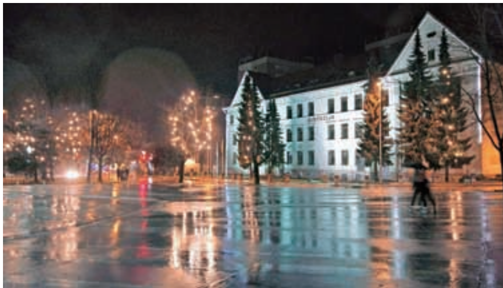
Praznična okrasitev Jesenic

Že danes, v petek, se na Jesenicah začne sklop prazničnih dogodkov v organizaciji Občine Jesenice, ki sodijo pod okrilje akcije Zabavaj se v mestu. Od danes do nedelje bo tako na Čufarjevem trgu med 15. in 19. uro potekal božično-novoletni sejem. Ob 17. uri bo vsak dan za obiskovalce organiziran glasbeni nastop, ob 17.45 pa Božična pravljica in prihod Božička. Glasbenemu nastopu skupine Joške v n bodo obiskovalci lahko prisluhnili danes, v petek, ob 21. uri v Cafe TeaTer baru. Jutri, v soboto, 20. decembra, pa bo ob 21. uri na prireditvenem prostoru na Stari Savi koncert skupine The stroj. Naslednji petek, 26. decembra, bo ob 22. uri na Čufarjevem trgu zabava s skupino Mambo Kings. Vrhunec decembrskih prireditev pa bo v sredo, 31. decembra, ko Občina Jesenice vabi v Športno dvorano Podmežakla na skupno silvestrovanje. Potem ko je prejšnja leta silvestrovanje potekalo na prostem na Čufarjevem trgu in lani v no-