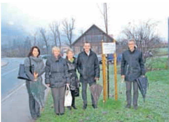
Lipa miru na Jesenicah