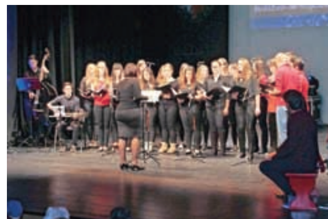
... v dvorani gledališča pa koncert dijakov.