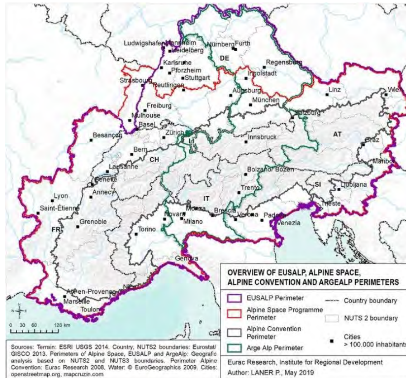
Slika 4 – Primerjalni obseg območja EUSALP, programa Interreg za Območje Alp, Alpske konvencije in združenja Arge Alp