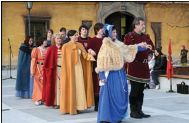
Otvoritev trga.