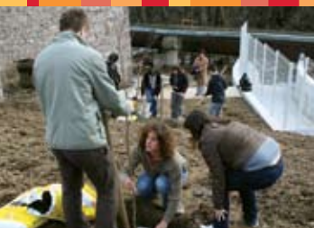
Jesenice - Stara Sava