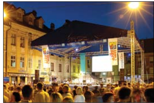
Kranfest postaja stičišče kultur.

Kranj je zgodovinsko mesto na skalnatem pomolu nad sotočjem rek Save in Kokre. Bogata naravna in kulturna dediščina in večstisoletna zgodovina stalne poselitve so mestu dodali neizbrisni pečat. Razvoju mesta s širitvijo je sledila tudi izgradnja športnih objektov, ki mestu poleg pestre kulturne ponudbe dajejo ime športnega mesta s prireditvami v svetovnem merilu. Pestrost prireditev in bogato kulturno življenje so rdeča nit živahnega starega Kranja, ki ne zamrejo niti pozimi. Decembrske prireditve na prostem, praznovanje kulturnega praznika s Prešernovim semnjem in pustovanje kljub mrazu privabljajo v mesto obiskovalce. Toplejši meseci pa so prepolni tako tradicionalnih prireditev kot tistih, ki nastajo spontano. Za živahen utrip mesta skrbi Zavod za turizem Kranj, ki je našel svoj dom v Kranjski hiši, kot drugi organizatorji prireditev v mestu.