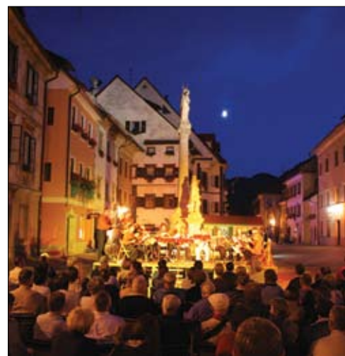
Koncert Tamburaškega orkestra Bisernica na Mestnem trgu.

S Pisano Loko bodo nadaljevali tudi po zaključku projekta Sejem bil je živ, saj odgovorni v tej smeri vidijo način, da mesto utripa, živi in se tudi razvija. Na ta način bo staro mestno jedro postalo zanimivo za investitorje, ki bodo z obnovami hiš in odpiranjem nove ponudbe dali tudi novo priložnost za oživitve. Lani je bilo v sklopu Pisane Loke pripravljenih 150 prireditev, sodelovalo je 30 društev, organizacij ali skupin, našteji so 50.000 obiskovalcev in v ta namen porabili 50.000 evrov.