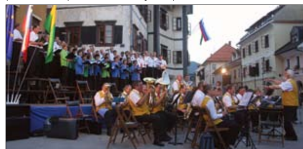
Mestni pihalni orkester ob občinskem prazniku.

Sokolski dom se iz zastarele Kristalne dvorane spreminja v moderno zasnovano kulturno kongresni prostor. Vrednost prenove je ocenjena na 2,6 milijona evrov. Gradbeniki, ki že nekaj mesecev z velikim žerjavom na Mestnem trgu opozarjajo na prenovo Sokolskega doma, se bodo umaknili do konca leta, ko bo dom tudi osnovno opremljen. Prihodnje leto bodo Sokolski dom še primerno ozvočili in opremili do konca. Takrat bo Škofja Loka dobila primeren prostor za koncerte, predstave, plese, seminarje in podobno.