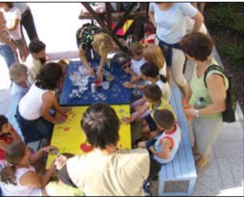
Zmigaj se.

Jesenice so mesto z dolgoletno železarsko tradicijo. Mestno jedro pa se v zadnjih letih oblikuje na Stari Savi. Dolgoročni cilj za to območje je oblikovanje funkcionalne zaokrožene celote, ki jo sestavlja bogata kulturna in tehniška dediščina v Muzejski kompleks Stara Sava, ki ne bo le lokalnega, pač pa tudi širšega regionalnega in mednarodnega pomena. Letos se bo dokončala ureditev rak, za obnovo Ruardove graščine, Plavža in delavnice pa se bo pridobila projektna dokumentacija. Delno bo opremljena tudi cerkev sv. Roka. Naslednje leto se bo začela obnova Kolperne in Ruardove graščine, ureditev območja ter dostop do Plavža. Kasneje se načrtuje ureditev cerkve, Pudlovke in trga med Kolperno in Kasarno.